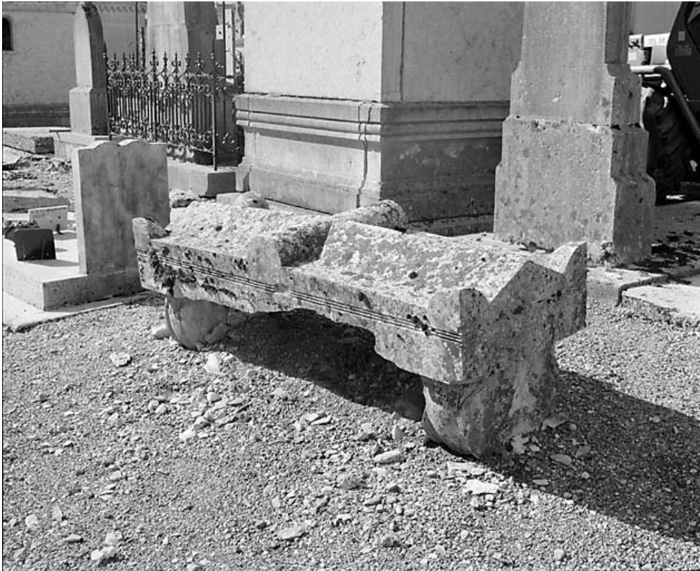
Vue de trois quarts.

39, Morez, 10 allée du 3 Septembre, lieudit : cimetière, quartier 4