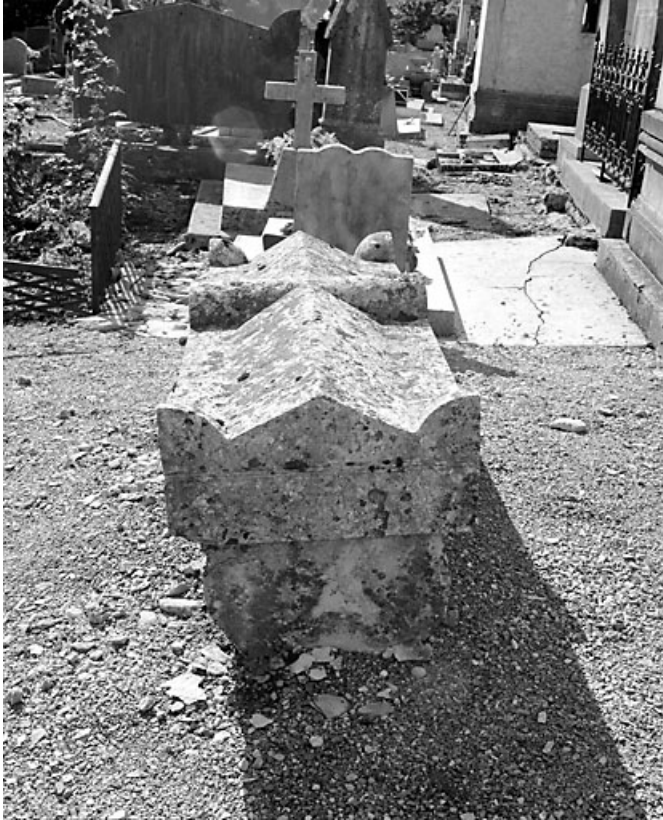
Vue dans l'axe longitudinal.

39, Morez, 10 allée du 3 Septembre, lieudit : cimetière, quartier 4