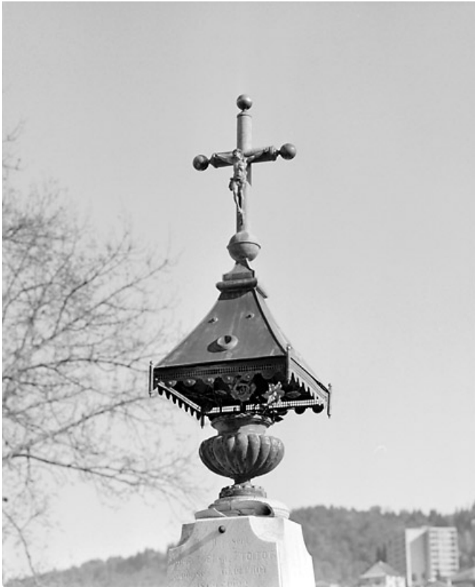
Vase, dais et crucifix.

39, Morez, 10 allée du 3 Septembre, lieudit : cimetière, quartier 7