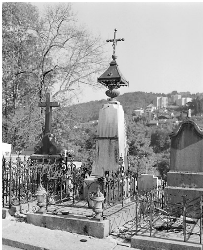
Vue de trois quarts droite.

39, Morez, 10 allée du 3 Septembre, lieudit : cimetière, quartier 7