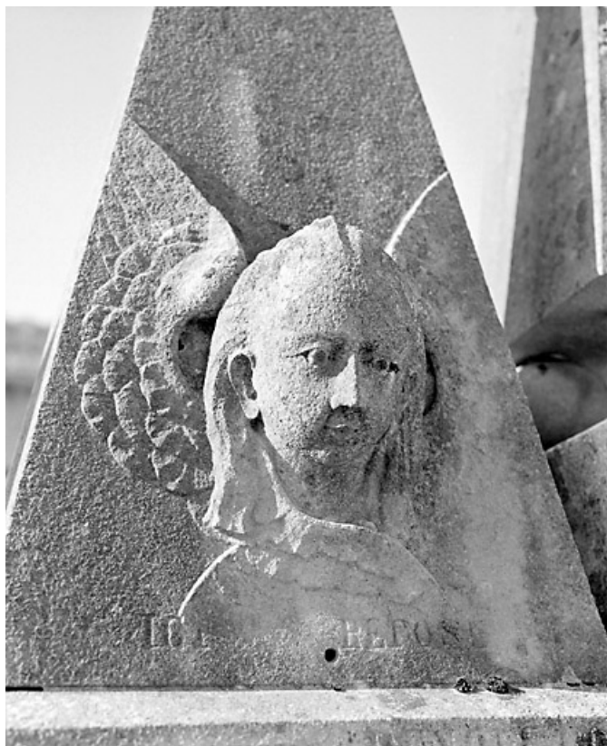
Tête de l'ange de gauche.

39, Morez, 10 allée du 3 Septembre, lieudit : cimetière, quartier 1