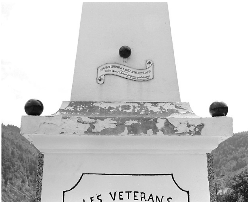
Boulets sur la corniche et en partie basse de l'obélisque.

39, Morez, 10 allée du 3 Septembre, lieudit : cimetière, quartier 2