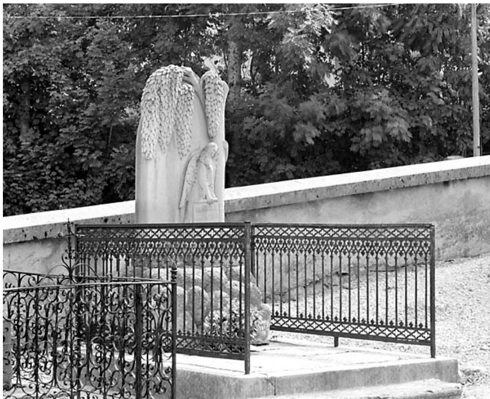
Vue d'ensemble, de trois quarts gauche.

39, Morez, 10 allée du 3 Septembre, lieudit : cimetière, quartier 2