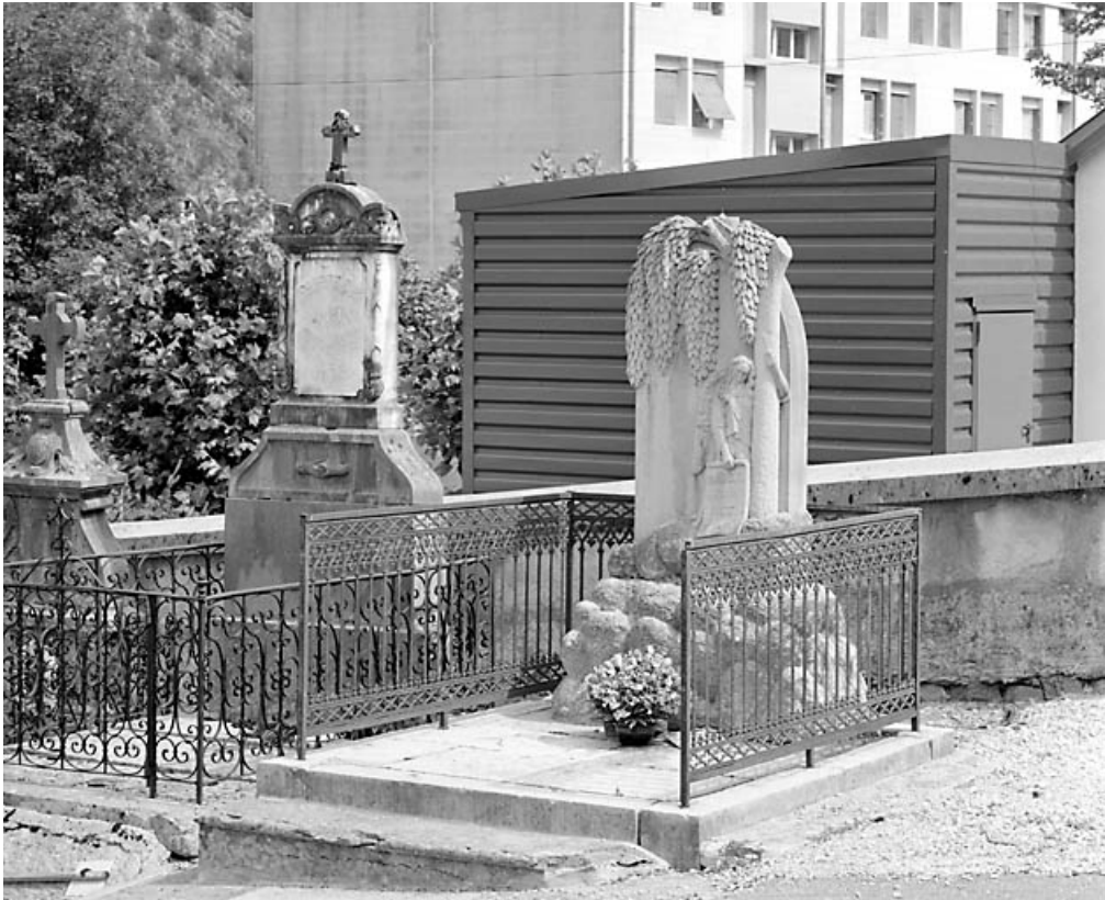
Vue d'ensemble, de trois quarts droite.

39, Morez, 10 allée du 3 Septembre, lieudit : cimetière, quartier 2