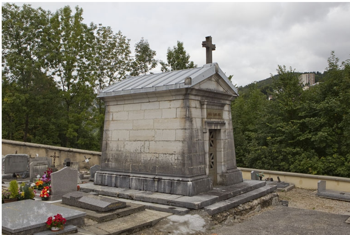
Vue d'ensemble, de trois quarts gauche.

39, Morez, 10 allée du 3 Septembre, lieudit : cimetière, quartier 10