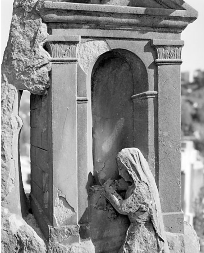
Détail de la sculpture.