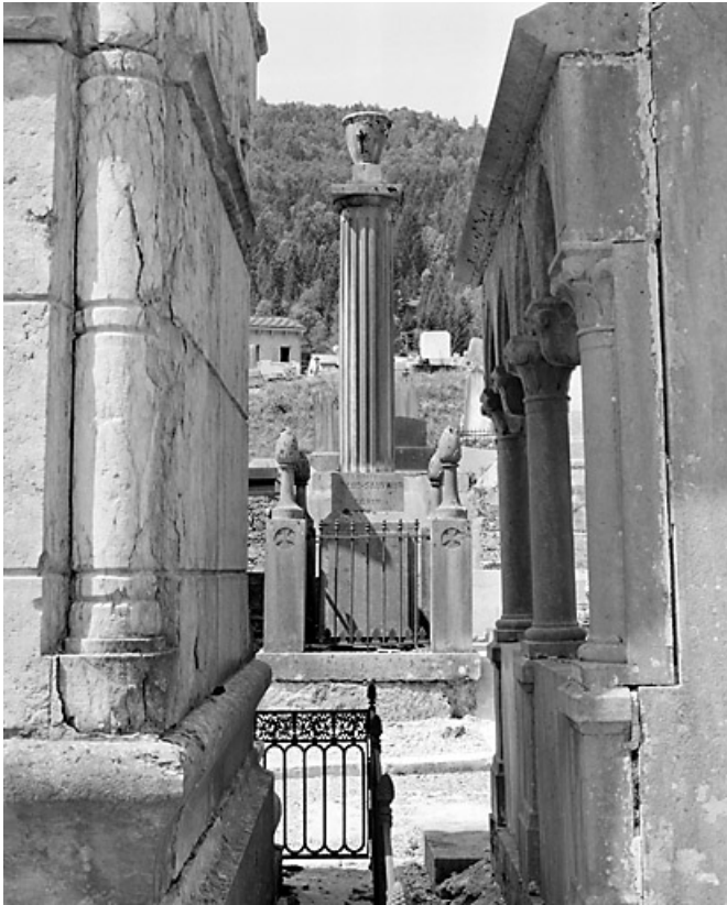
Vue d'ensemble, depuis le quartier 4 (nord-est).

39, Morez, 10 allée du 3 Septembre, lieudit : cimetière, quartier 3