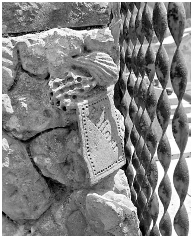
Cartouche portant la signature Belloni et grille.

39, Morez, 10 allée du 3 Septembre, lieudit : cimetière, quartier 3