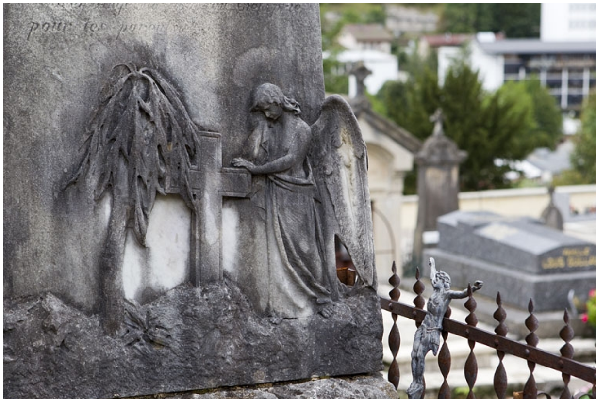
Stèle : ange, croix et arbre étêté.

39, Morez, 10 allée du 3 Septembre, lieudit : cimetière, quartier 3