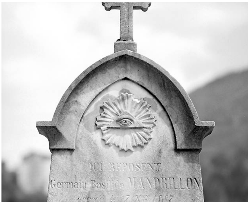
Stèle : triangle de la Trinité et oeil céleste.

39, Morez, 10 allée du 3 Septembre, lieudit : cimetière, quartier 3