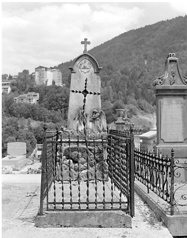
Vue d'ensemble, de face : grille de clôture.

39, Morez, 10 allée du 3 Septembre, lieudit : cimetière, quartier 3