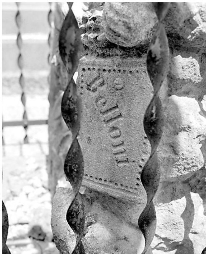
Cartouche portant la signature Belloni.

39, Morez, 10 allée du 3 Septembre, lieudit : cimetière, quartier 3