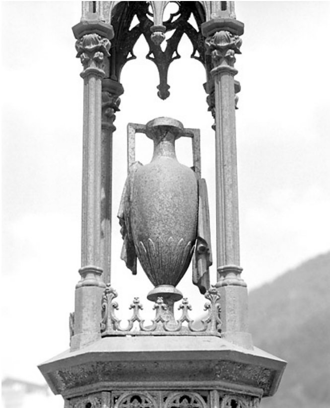
Tombeau d'Eugénie Girod : l'urne.

39, Morez, 10 allée du 3 Septembre, lieudit : cimetière, quartier 3