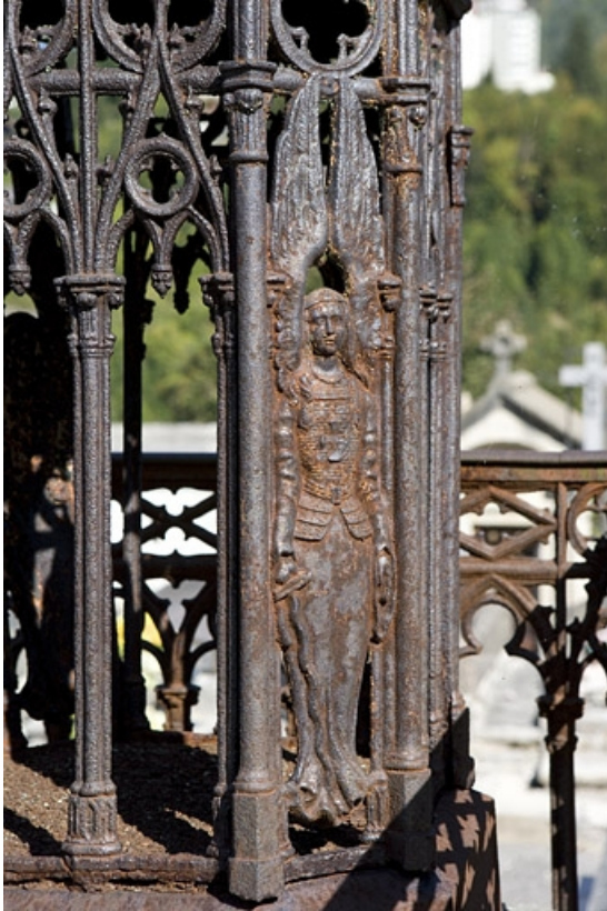
Tombeau d'Eugénie Girod : détail d'un ange du piédestal.

39, Morez, 10 allée du 3 Septembre, lieudit : cimetière, quartier 3