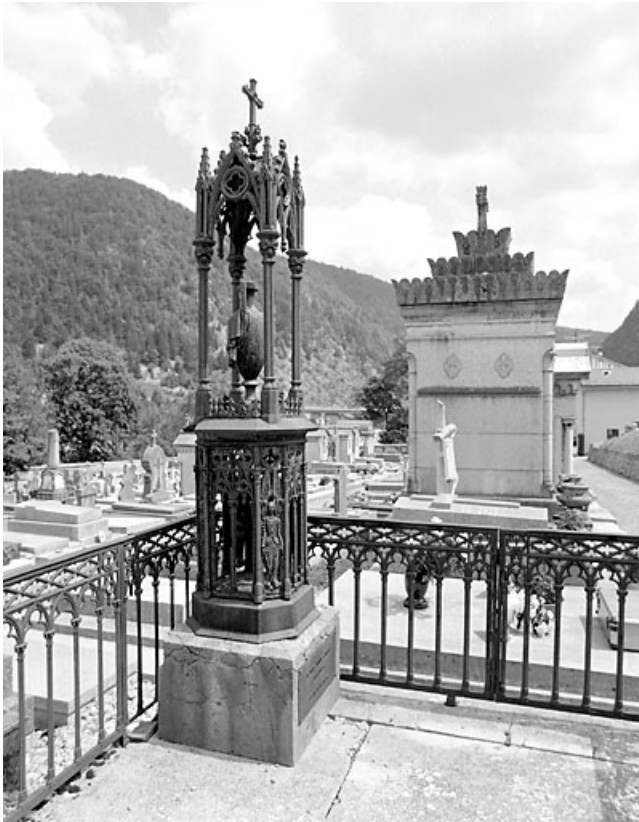
Tombeau d'Eugénie Girod : vue d'ensemble.

39, Morez, 10 allée du 3 Septembre, lieudit : cimetière, quartier 3