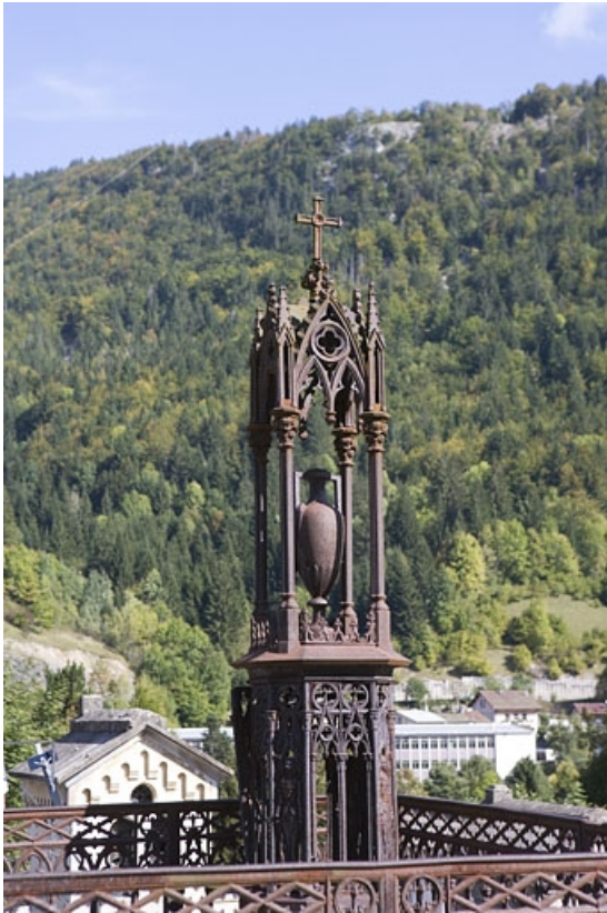
Tombeau d'Eugénie Girod : baldaquin et urne.

39, Morez, 10 allée du 3 Septembre, lieudit : cimetière, quartier 3