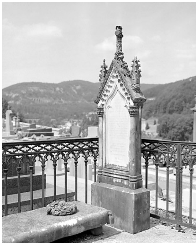
Tombeau de Julie Girod : la stèle.

39, Morez, 10 allée du 3 Septembre, lieudit : cimetière, quartier 3