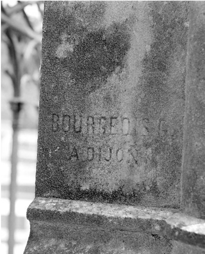
Tombeau de Julie Girod : signature du sculpteur G. Bourgeois.

39, Morez, 10 allée du 3 Septembre, lieudit : cimetière, quartier 3