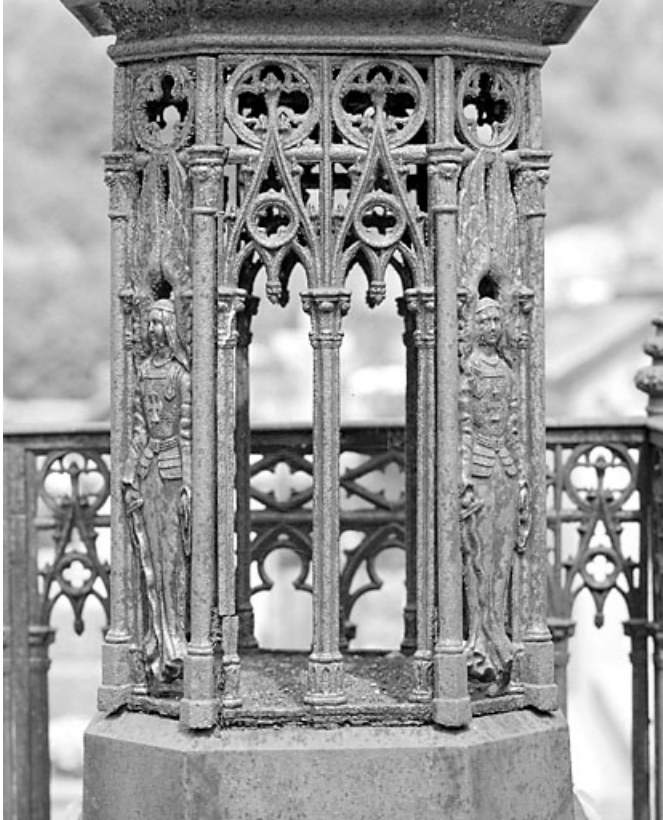
Tombeau d'Eugénie Girod : arcature double et anges sur le piédestal.

39, Morez, 10 allée du 3 Septembre, lieudit : cimetière, quartier 3