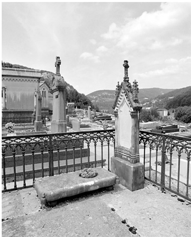
Tombeau de Julie Girod : vue d'ensemble.

39, Morez, 10 allée du 3 Septembre, lieudit : cimetière, quartier 3