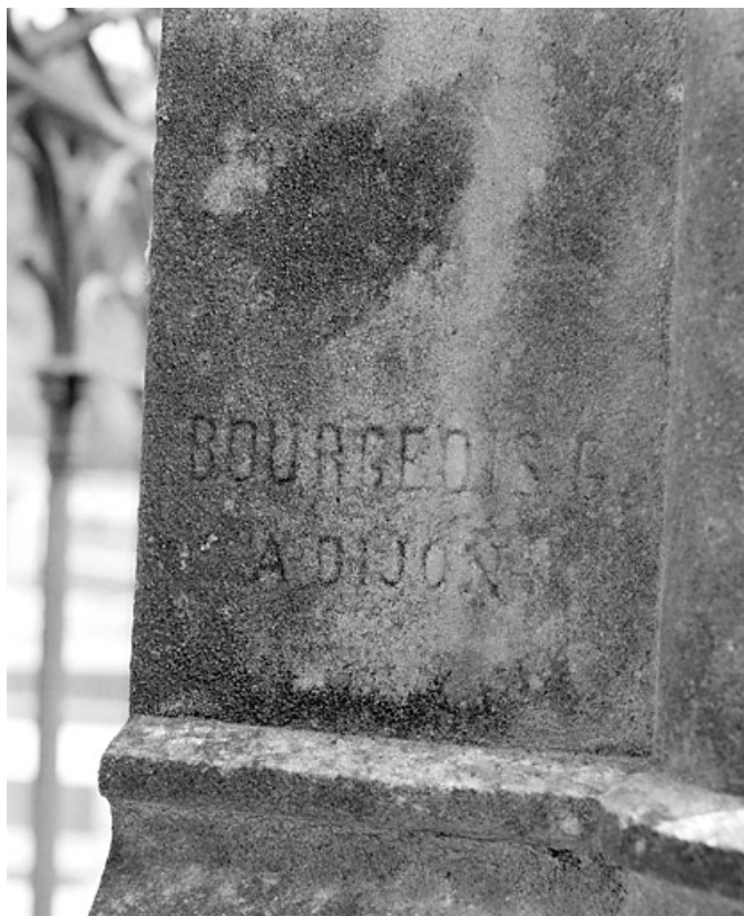
Tombeau de Julie Girod : signature du sculpteur G. Bourgeois. 39, Morez, 10 allée du 3 Septembre, lieudit : cimetière, quartier 3