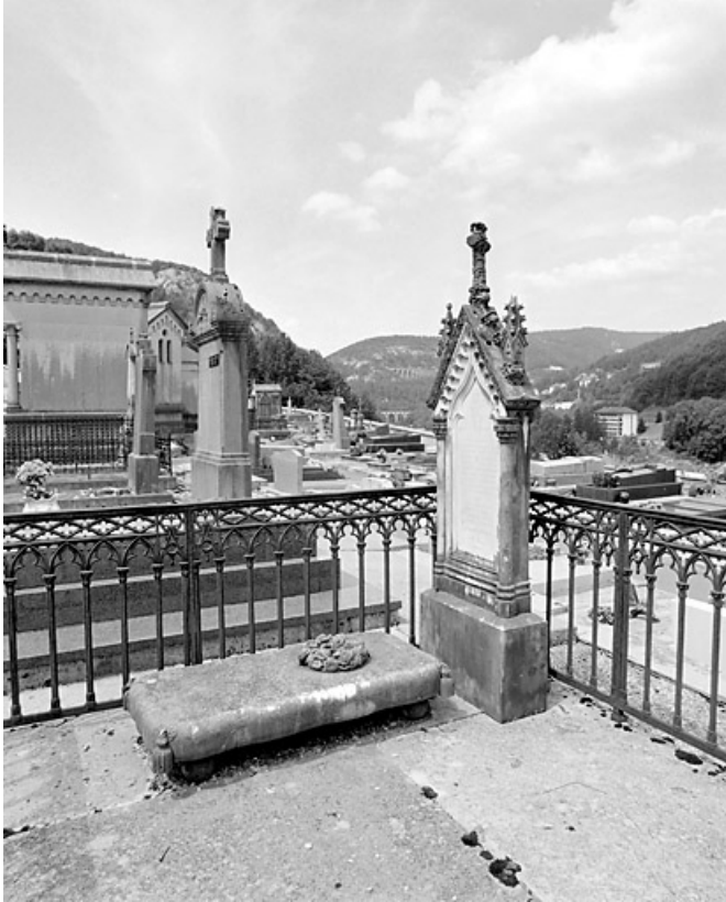
Tombeau de Julie Girod : vue d'ensemble.

39, Morez, 10 allée du 3 Septembre, lieudit : cimetière, quartier 3