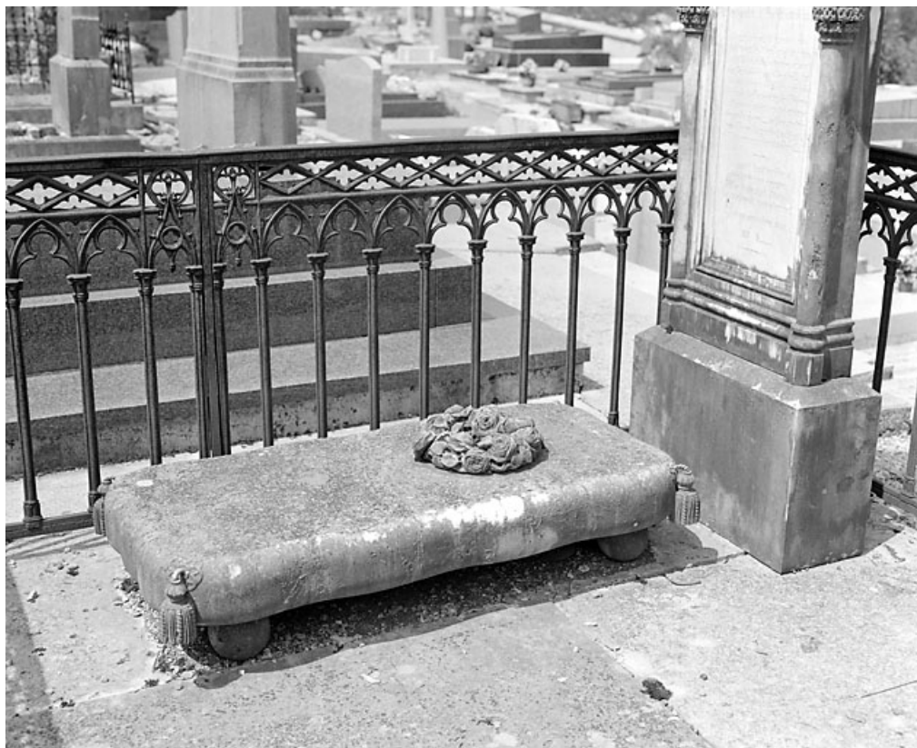
Tombeau de Julie Girod : la plate-forme et sa couronne de roses.

39, Morez, 10 allée du 3 Septembre, lieudit : cimetière, quartier 3