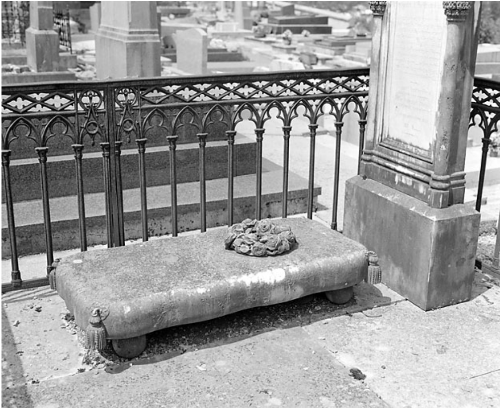
Tombeau de Julie Girod : la plate-forme et sa couronne de roses.

39, Morez, 10 allée du 3 Septembre, lieudit : cimetière, quartier 3