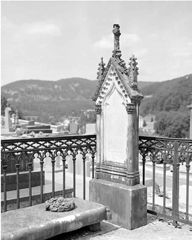
Tombeau de Julie Girod : la stèle.

39, Morez, 10 allée du 3 Septembre, lieudit : cimetière, quartier 3