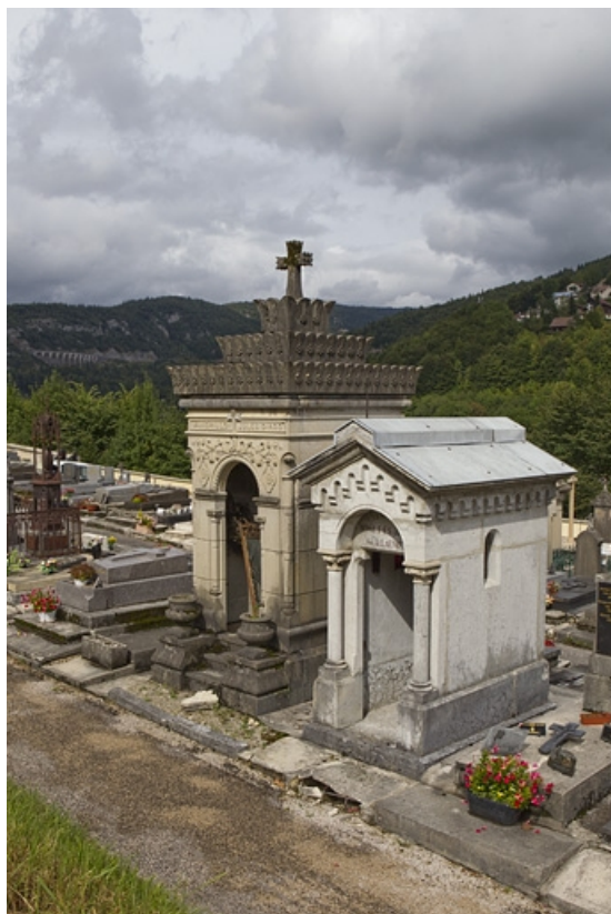
Vue d'ensemble, de trois quarts droite.

39, Morez, 10 allée du 3 Septembre, lieudit : cimetière, quartier 3