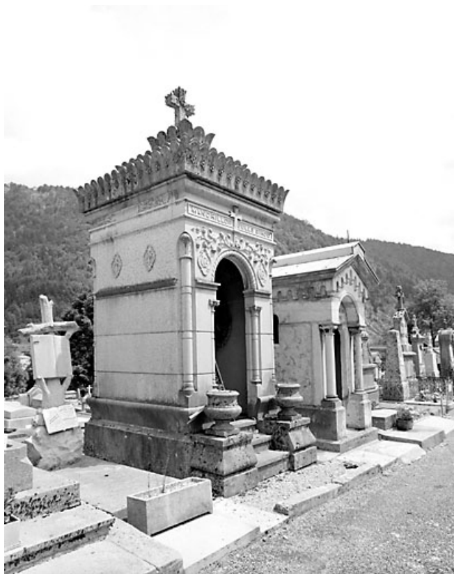
Vue d'ensemble, de trois quarts gauche.

39, Morez, 10 allée du 3 Septembre, lieudit : cimetière, quartier 3