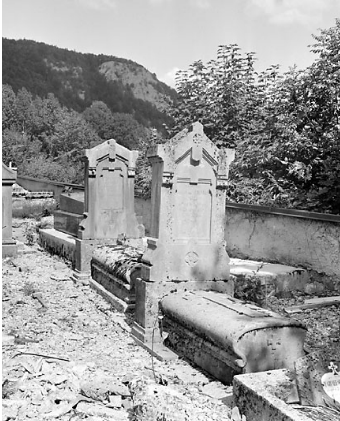
Vue d'ensemble des deux tombeaux. Le tombeau d'Aimé Chavin est au second plan.

39, Morez, 10 allée du 3 Septembre, lieudit : cimetière, quartier 4