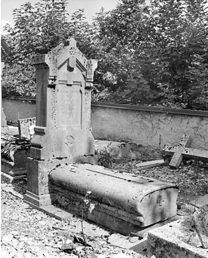
Tombeau de Marie-Reine Chavin.

39, Morez, 10 allée du 3 Septembre, lieudit : cimetière, quartier 4