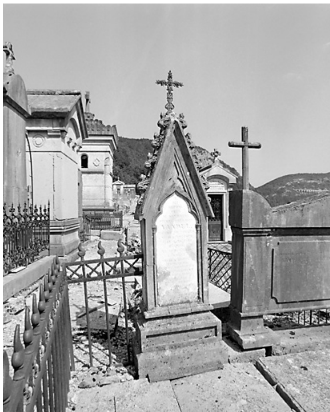
Stèle de Pierre-Célestin Vandel.

39, Morez, 10 allée du 3 Septembre, lieudit : cimetière, quartier 4