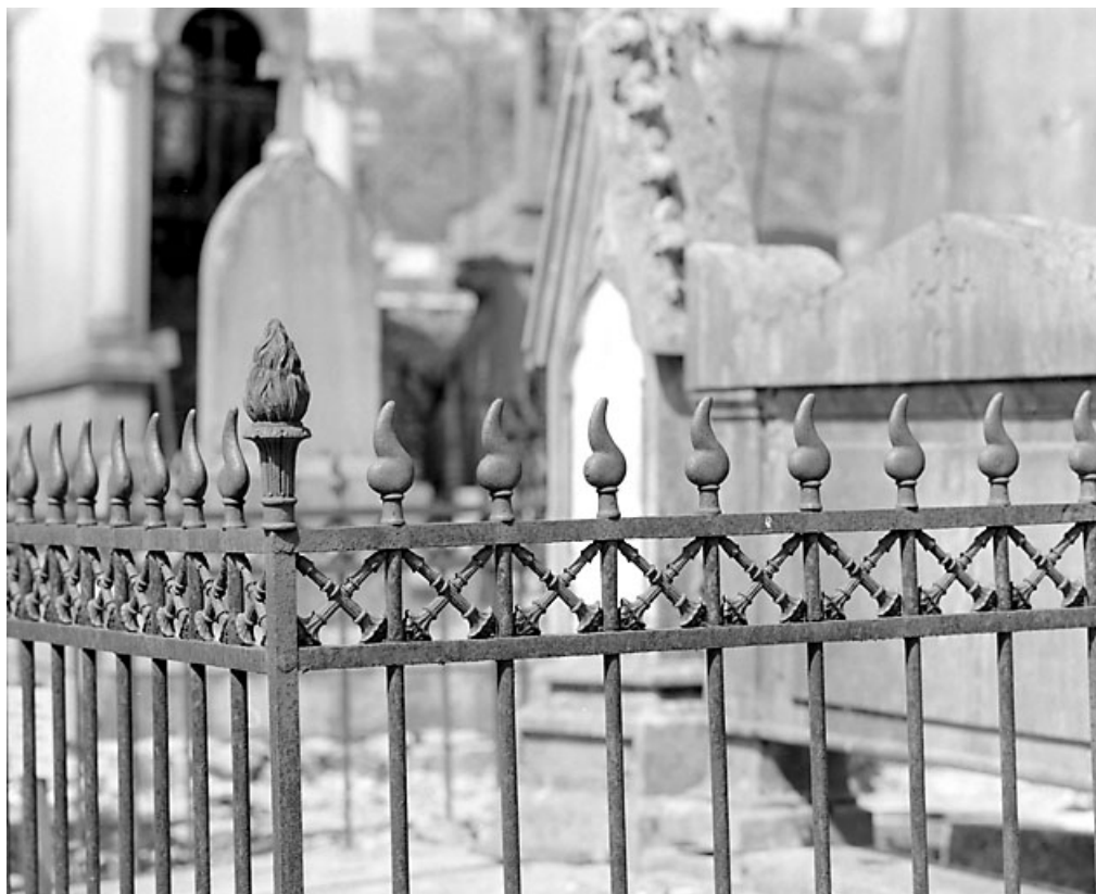
Détail de la grille de clôture.

39, Morez, 10 allée du 3 Septembre, lieudit : cimetière, quartier 4