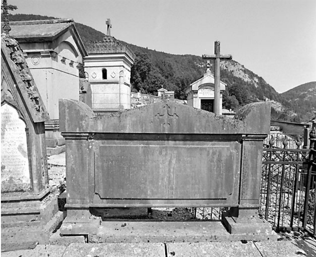
Stèle de la famille de Jean-Gabriel-Germain Vandel.

39, Morez, 10 allée du 3 Septembre, lieudit : cimetière, quartier 4