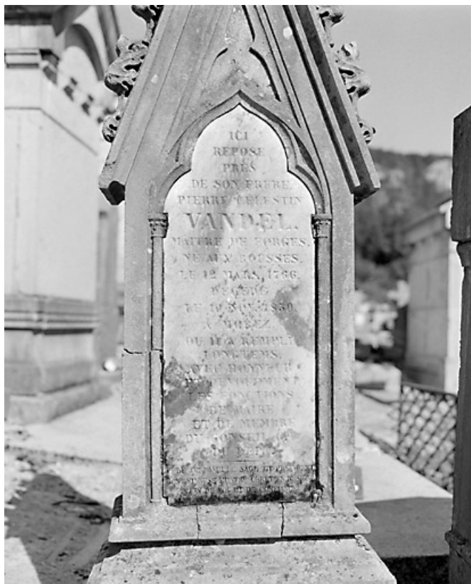
Stèle de Pierre-Célestin Vandel : détail de l'inscription.

39, Morez, 10 allée du 3 Septembre, lieudit : cimetière, quartier 4