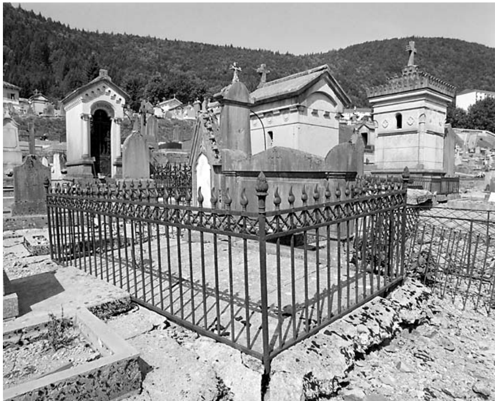
Vue d'ensemble, de trois quarts droite.

39, Morez, 10 allée du 3 Septembre, lieudit : cimetière, quartier 4