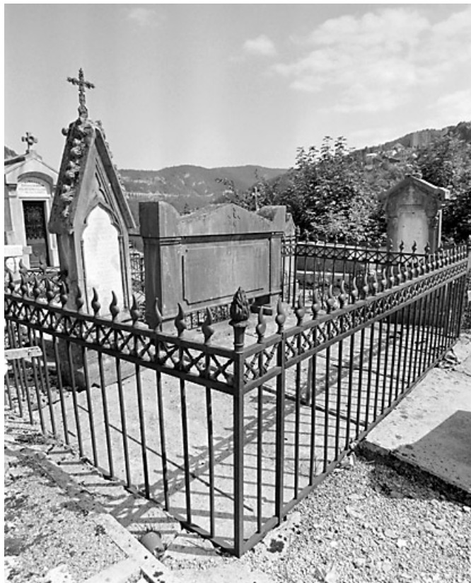
Vue d'ensemble, de trois quarts gauche.

39, Morez, 10 allée du 3 Septembre, lieudit : cimetière, quartier 4