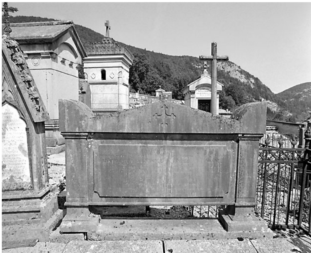
Stèle de la famille de Jean-Gabriel-Germain Vandel.

39, Morez, 10 allée du 3 Septembre, lieudit : cimetière, quartier 4