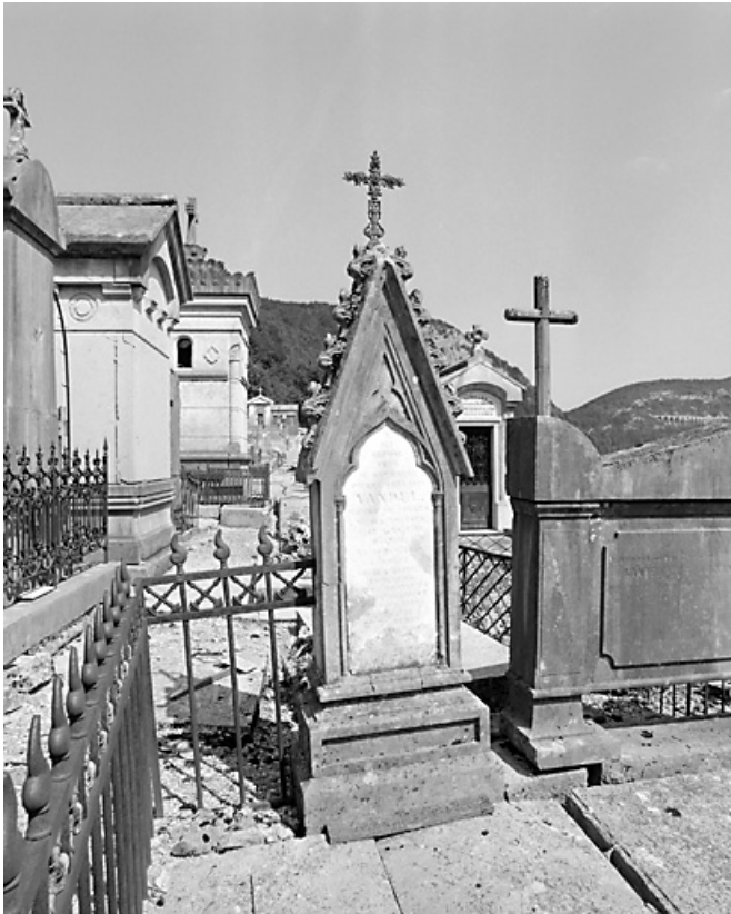
Stèle de Pierre-Célestin Vandel.

39, Morez, 10 allée du 3 Septembre, lieudit : cimetière, quartier 4