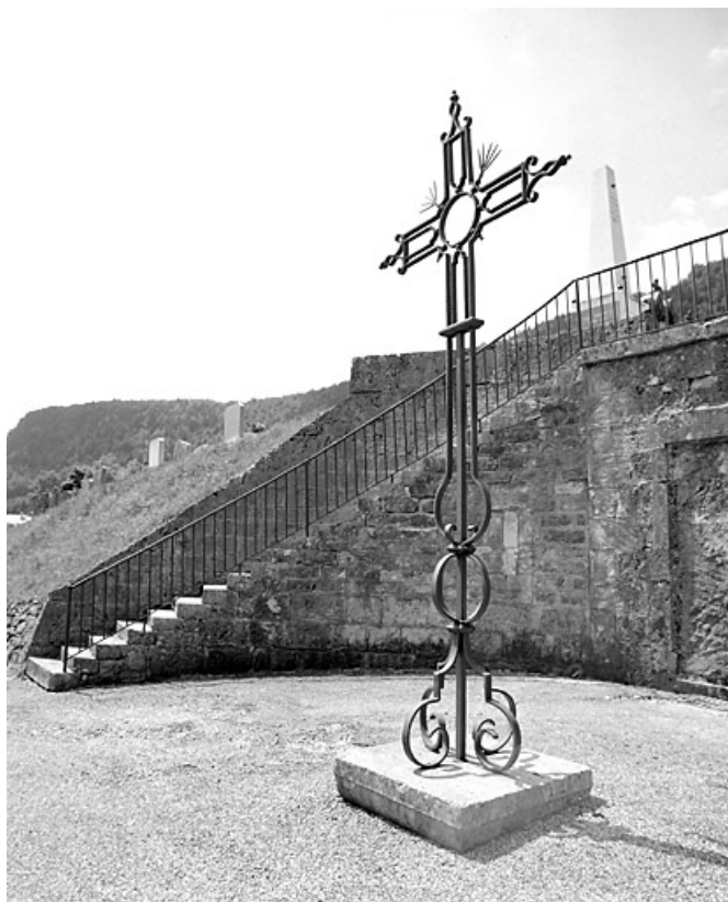
Vue d'ensemble, de trois quarts droite.