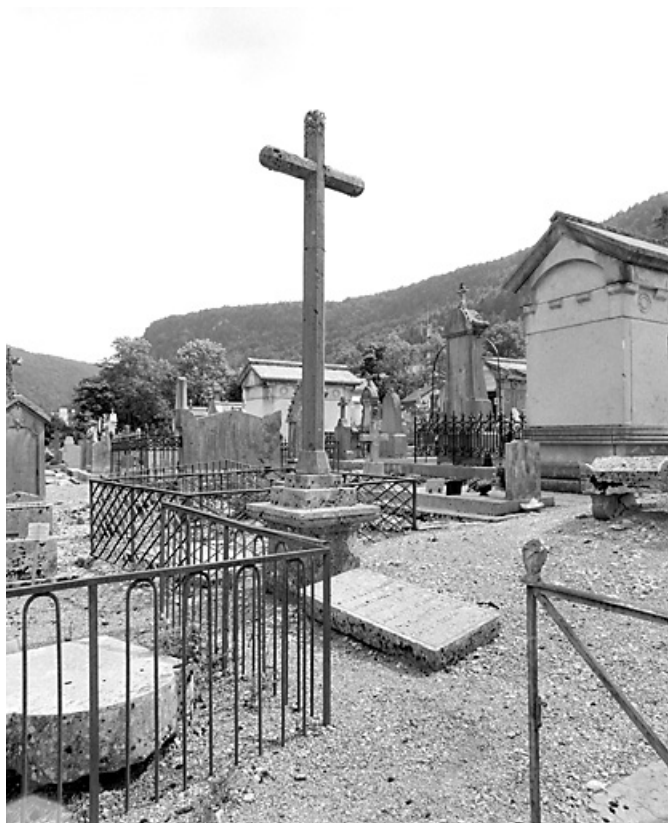
Vue d'ensemble, côté tombeau.