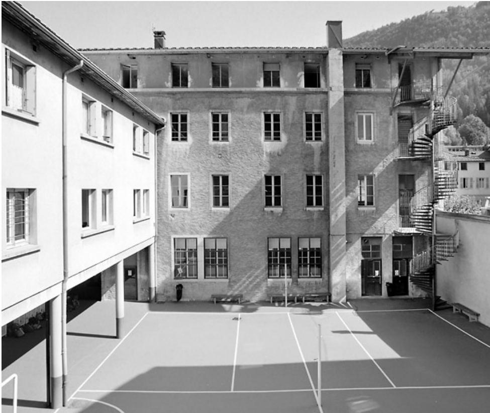
Façade postérieure et aile du préau et des logements.