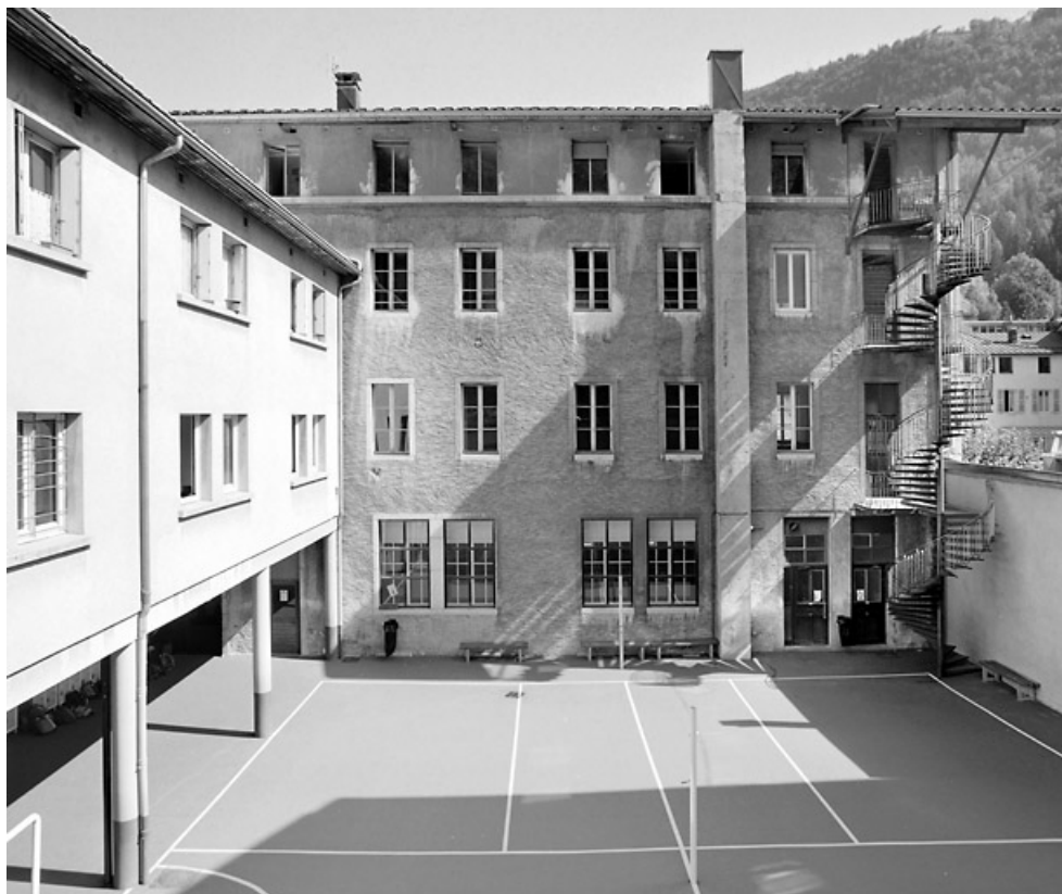
Façade postérieure et aile du préau et des logements.