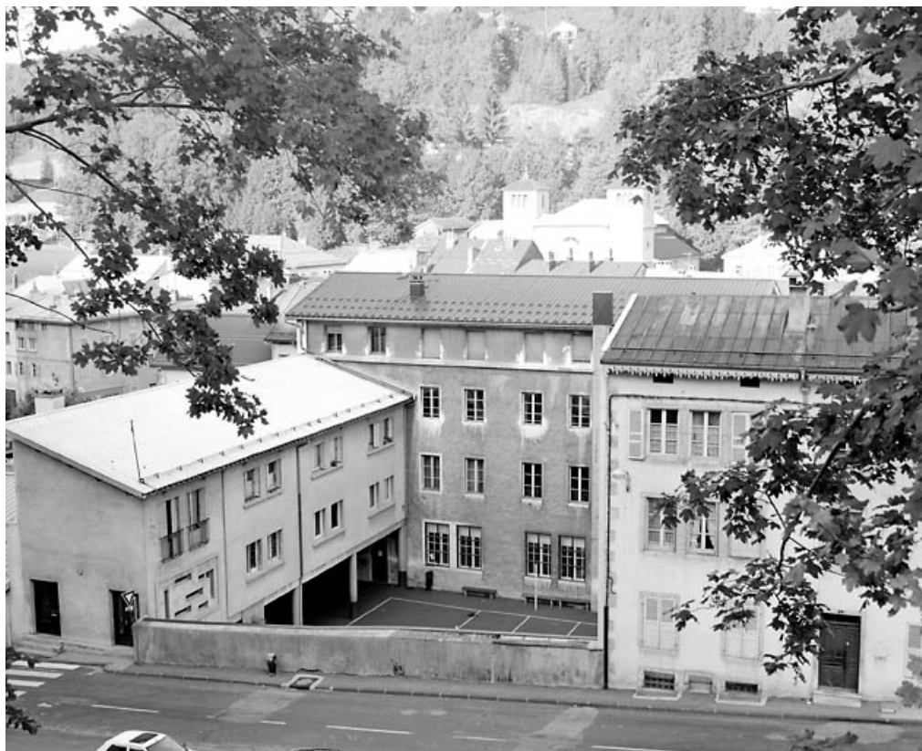
Façade postérieure : vue d'ensemble éloignée, de trois quarts droite. 39, Morez, 28 quai Jobez