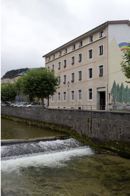
Vue d'ensemble, depuis le nord.