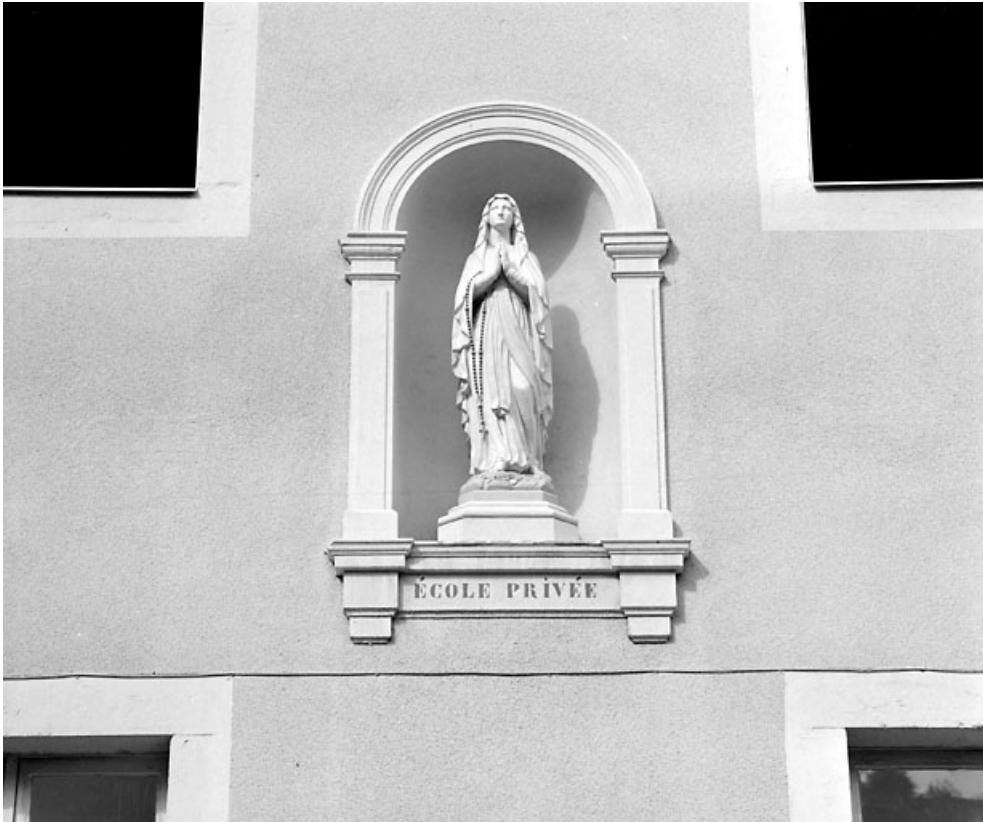
Niche et statue de la Vierge sur la façade antérieure.