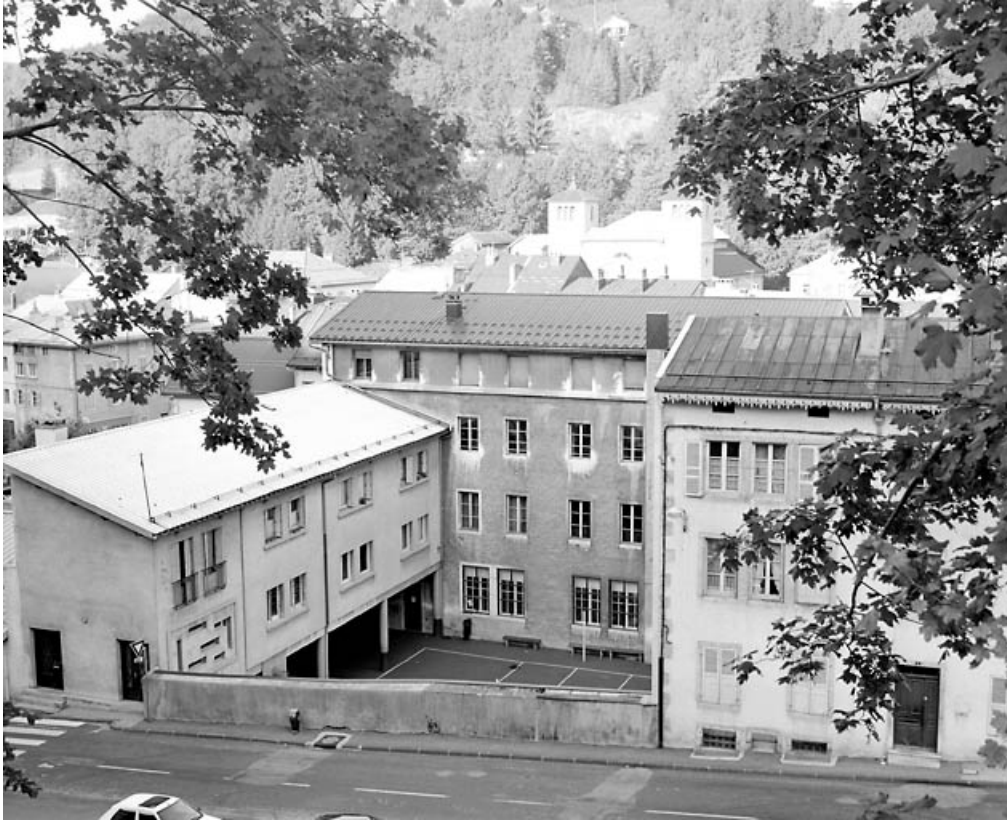
Façade postérieure : vue d'ensemble éloignée, de trois quarts droite.