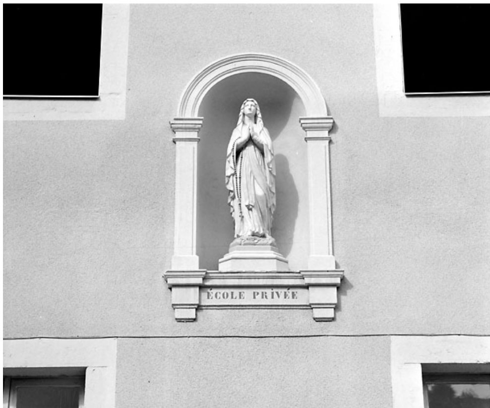
Niche et statue de la Vierge sur la façade antérieure.