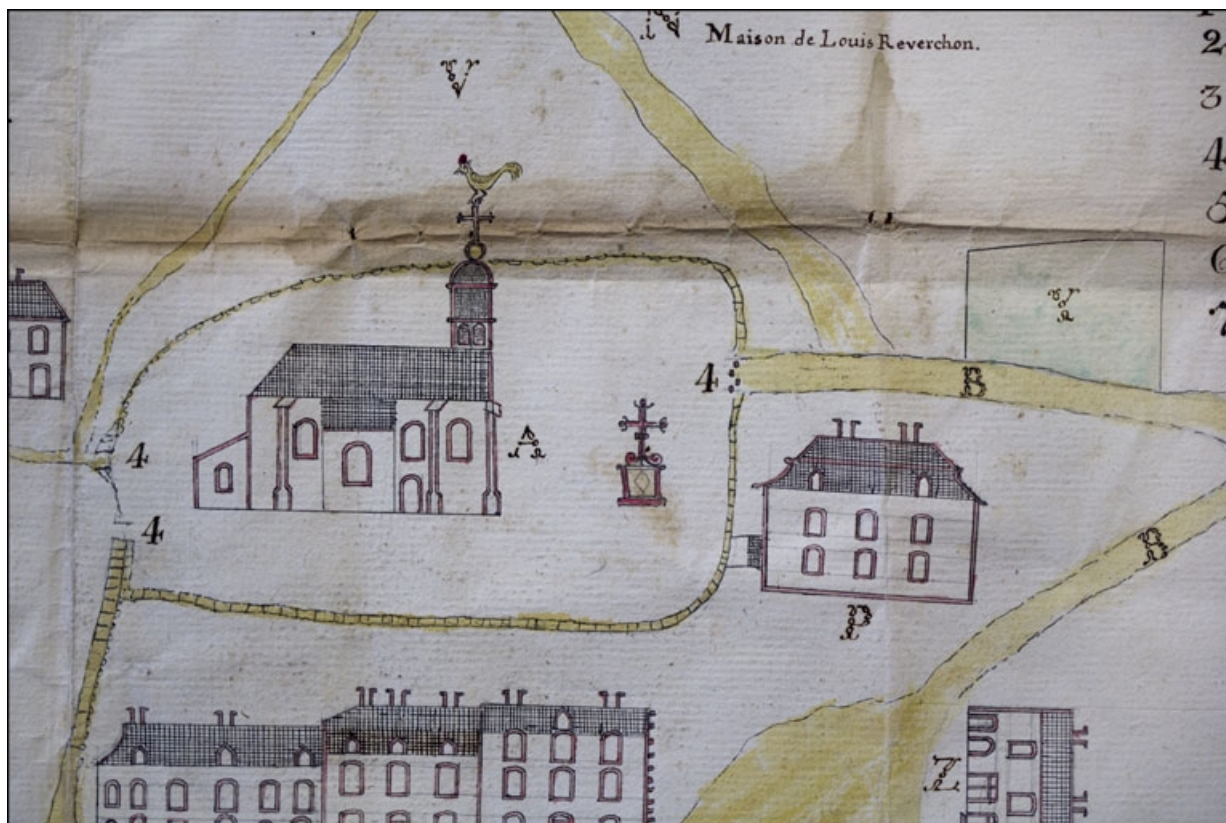
[Plan du quartier de l'église : détail], 1781.