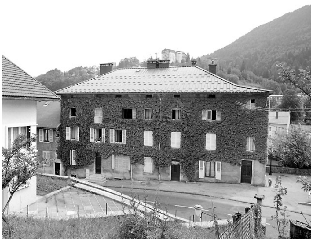
Bâtiment 11-15 rue Pasteur : façade antérieure.