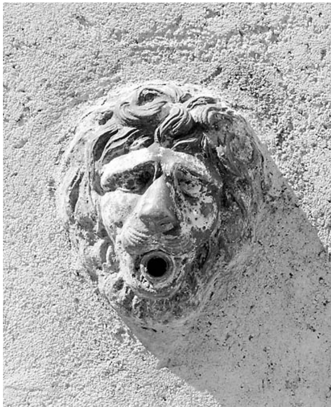
Bâtiment 3 rue Etienne Dolet : mufle de lion du point d'eau.