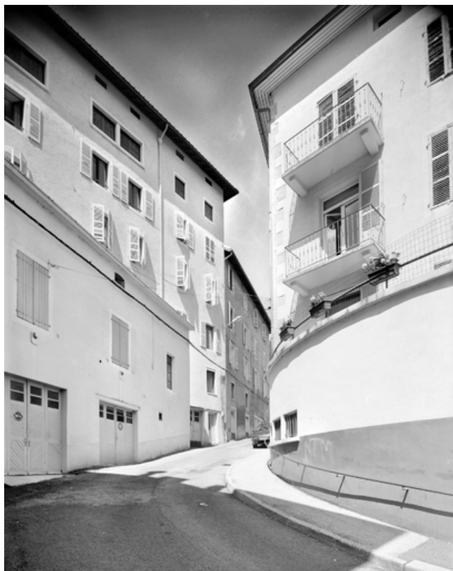
Vue d'ensemble, depuis le bas de la rue Etienne Dolet (sud-est). 39, Morez, 7-15 rue Pasteur