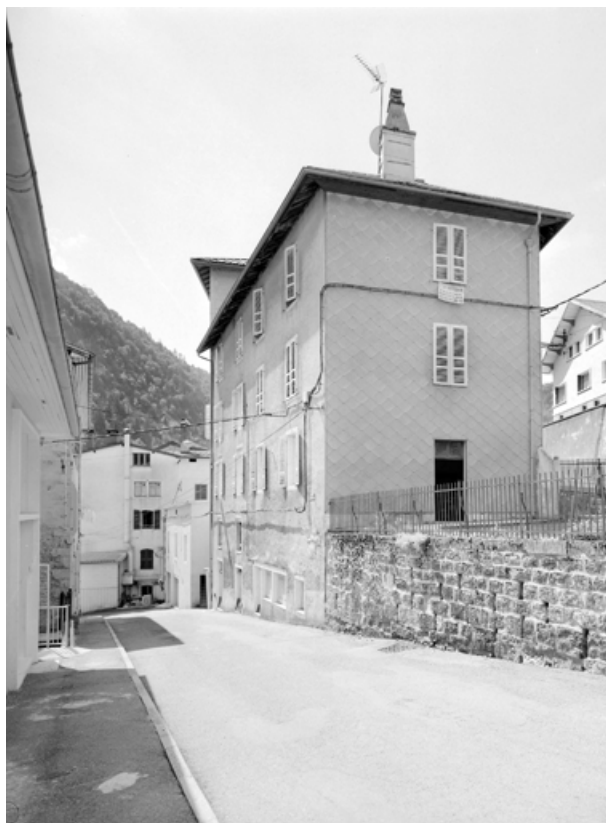
Vue d'ensemble, depuis le haut de la rue Etienne Dolet (nord). 39, Morez, 7-15 rue Pasteur