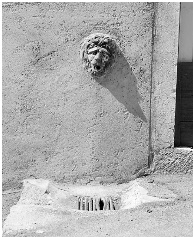
Bâtiment 3 rue Etienne Dolet : point d'eau.