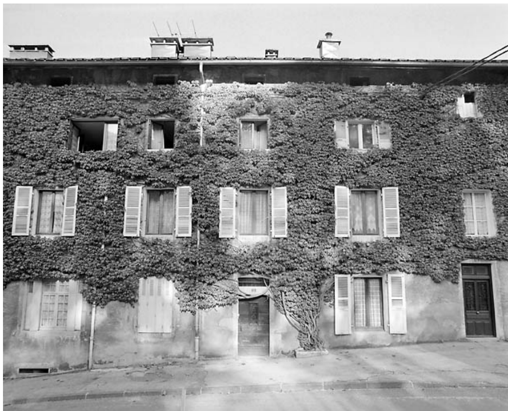
Bâtiment 11-15 rue Pasteur : façade antérieure au niveau des n° 11 et 13. 39, Morez, 7-15 rue Pasteur