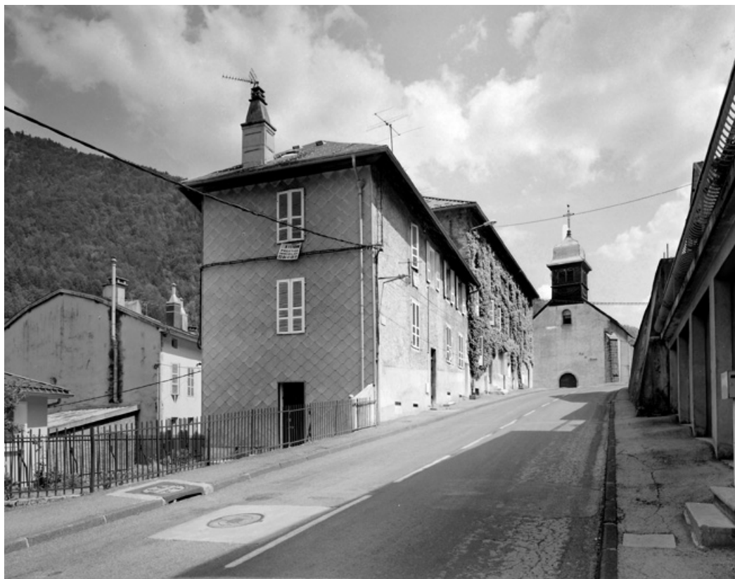
Vue d'ensemble, depuis le bas de la rue Pasteur (nord-ouest).