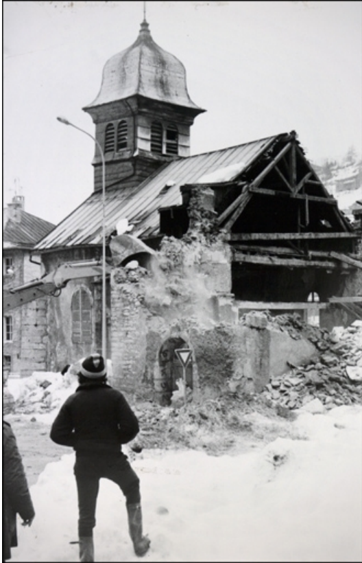
[Démolition du chœur de l'église], 1981 39, Morez, 19 rue Pasteur