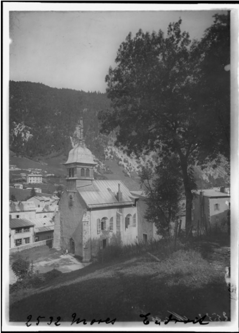
[Façades antérieure et latérale droite], 1er quart 20e siècle. 39, Morez, 19 rue Pasteur