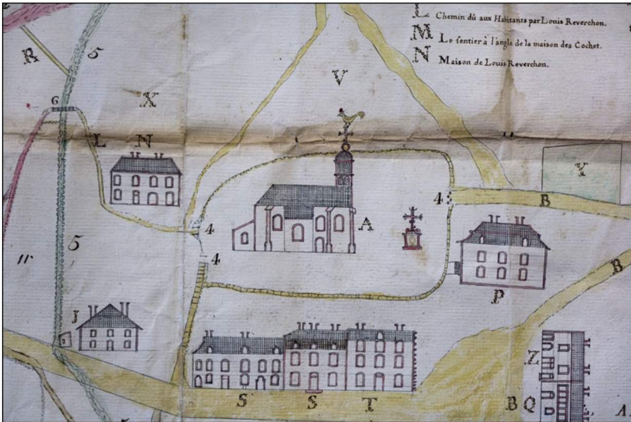
[Plan du quartier de l'église : détail], 1781.