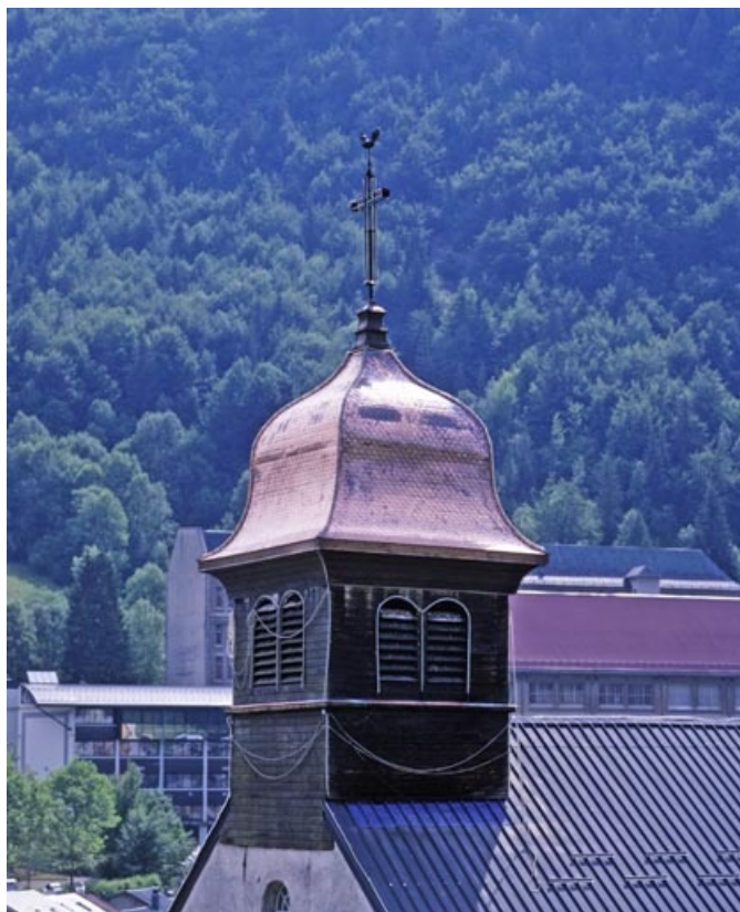
Clocher, depuis le nord-ouest.