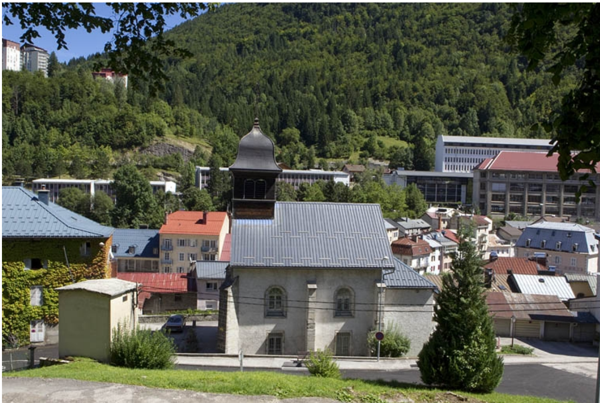
Vue d'ensemble, depuis le sud-ouest. 39, Morez, 19 rue Pasteur