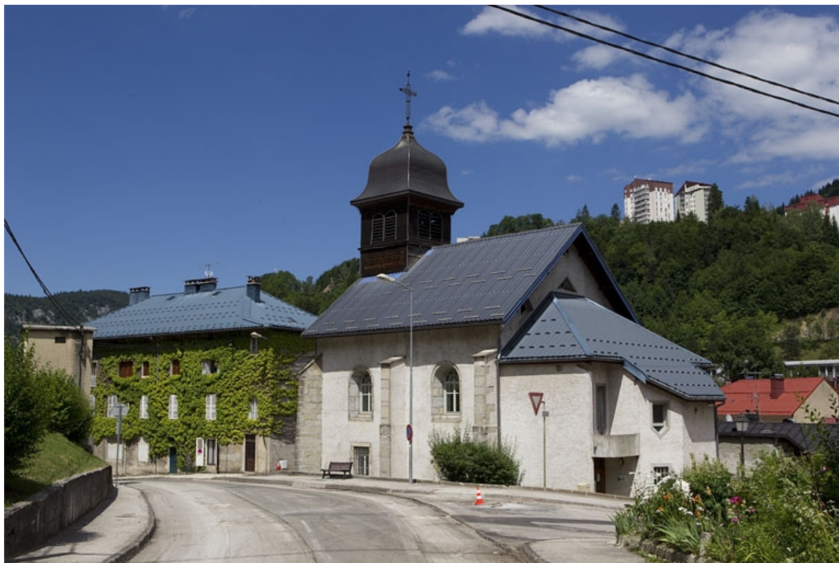
Façade latérale droite.