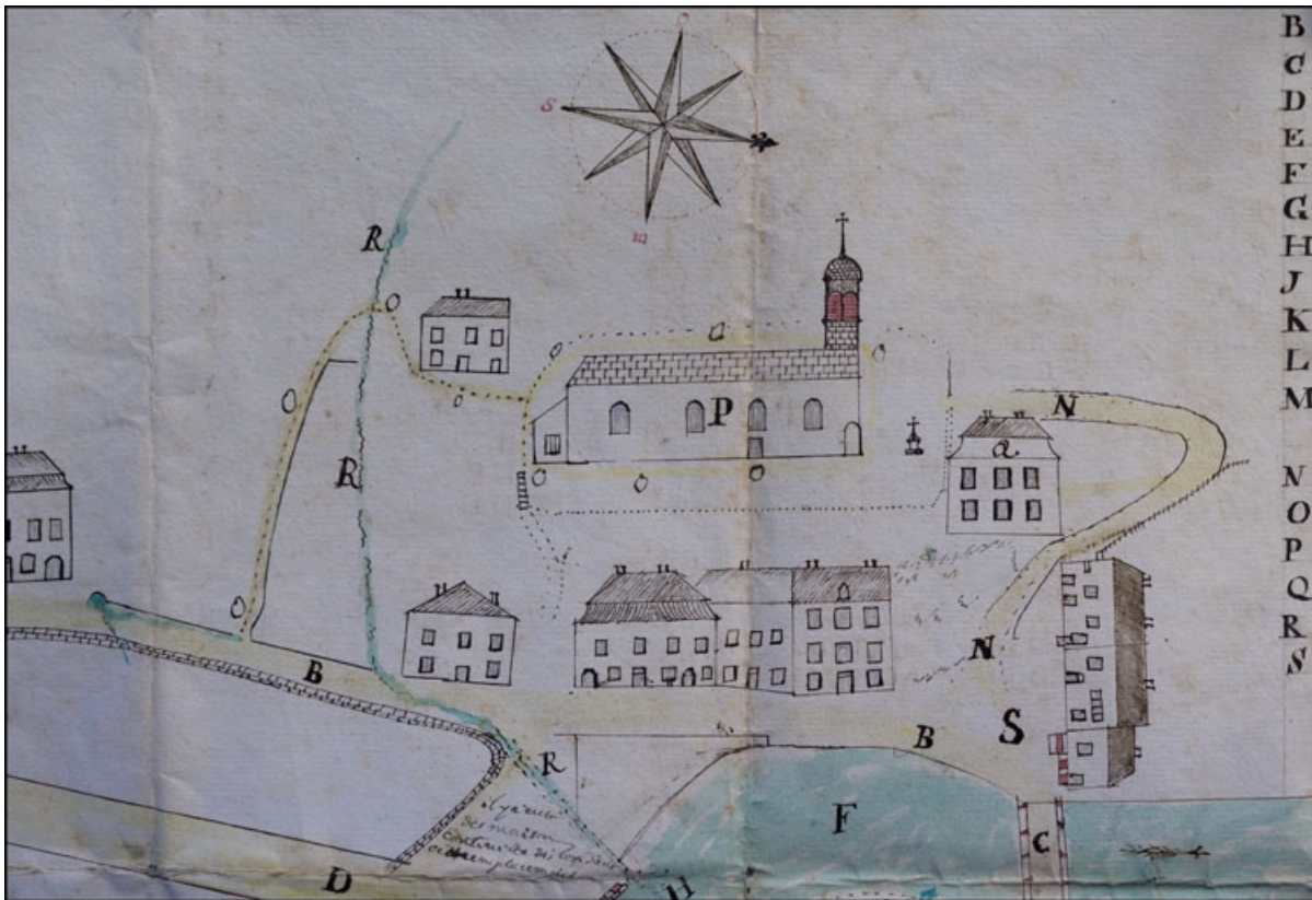
Plan [du moulin Chavin et du quartier de la place du Marché] fait par Pierre Augustin Roche de Morez [détail], 1782. 39, Morez, 19 rue Pasteur