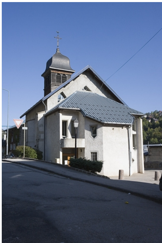
Vue d'ensemble, depuis le sud.