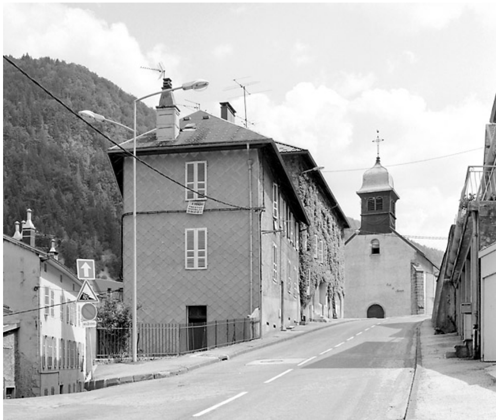
Vue d'ensemble éloignée, depuis la rue Pasteur (nord-ouest). 39, Morez, 19 rue Pasteur