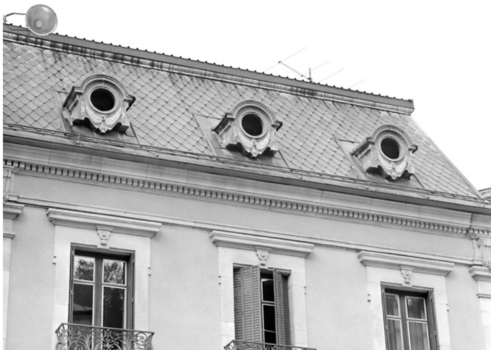
Élévation rue de la République : oeil-de-boeuf du comble à surcroît. 39, Morez, 122 rue de la République