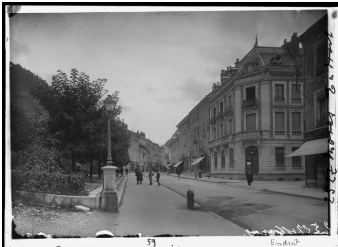
[Vue d'ensemble de la caisse d'épargne et de la rue de la République], 1er quart 20e siècle. 39, Morez, 122 rue de la République