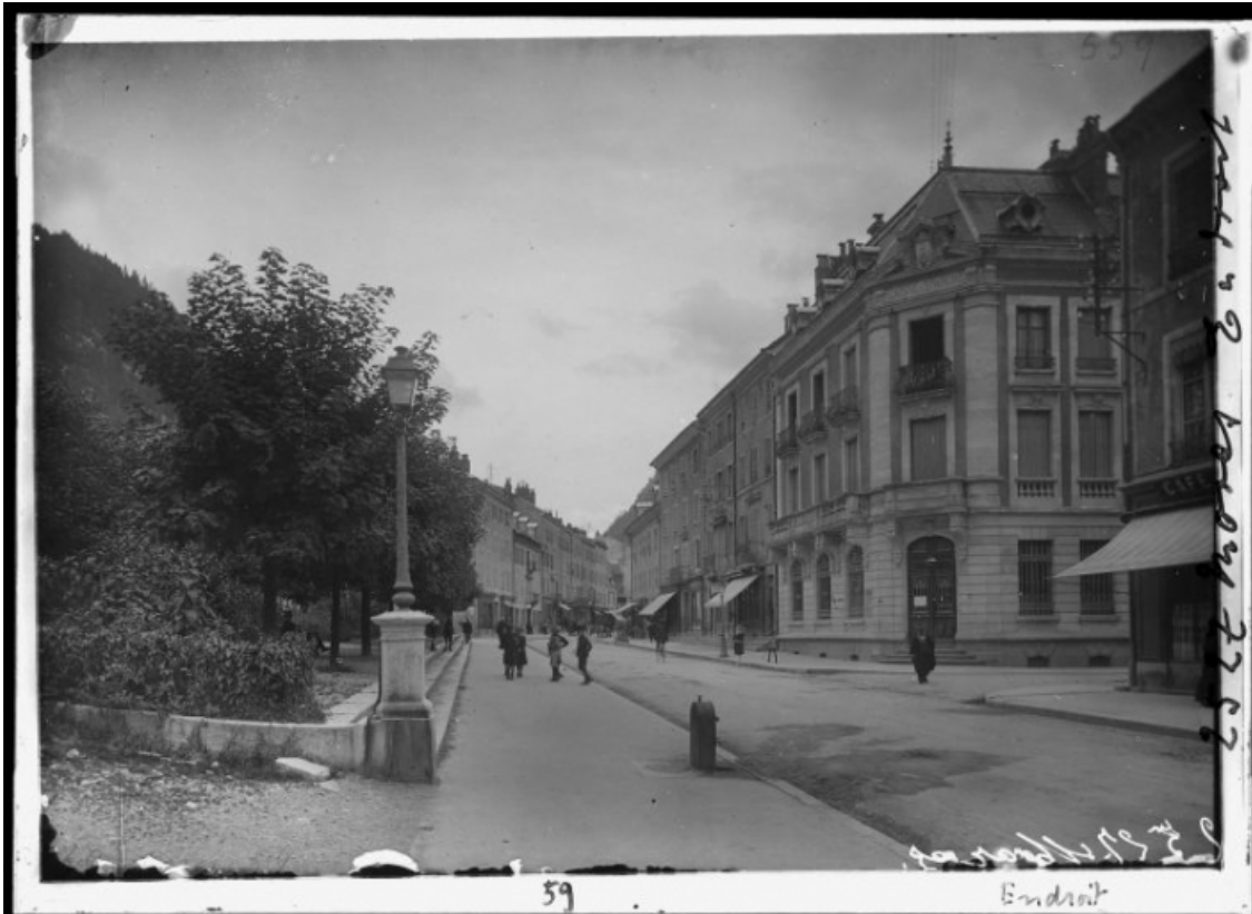
[Vue d'ensemble de la caisse d'épargne et de la rue de la République], 1er quart 20e siècle. 39, Morez, 122 rue de la République