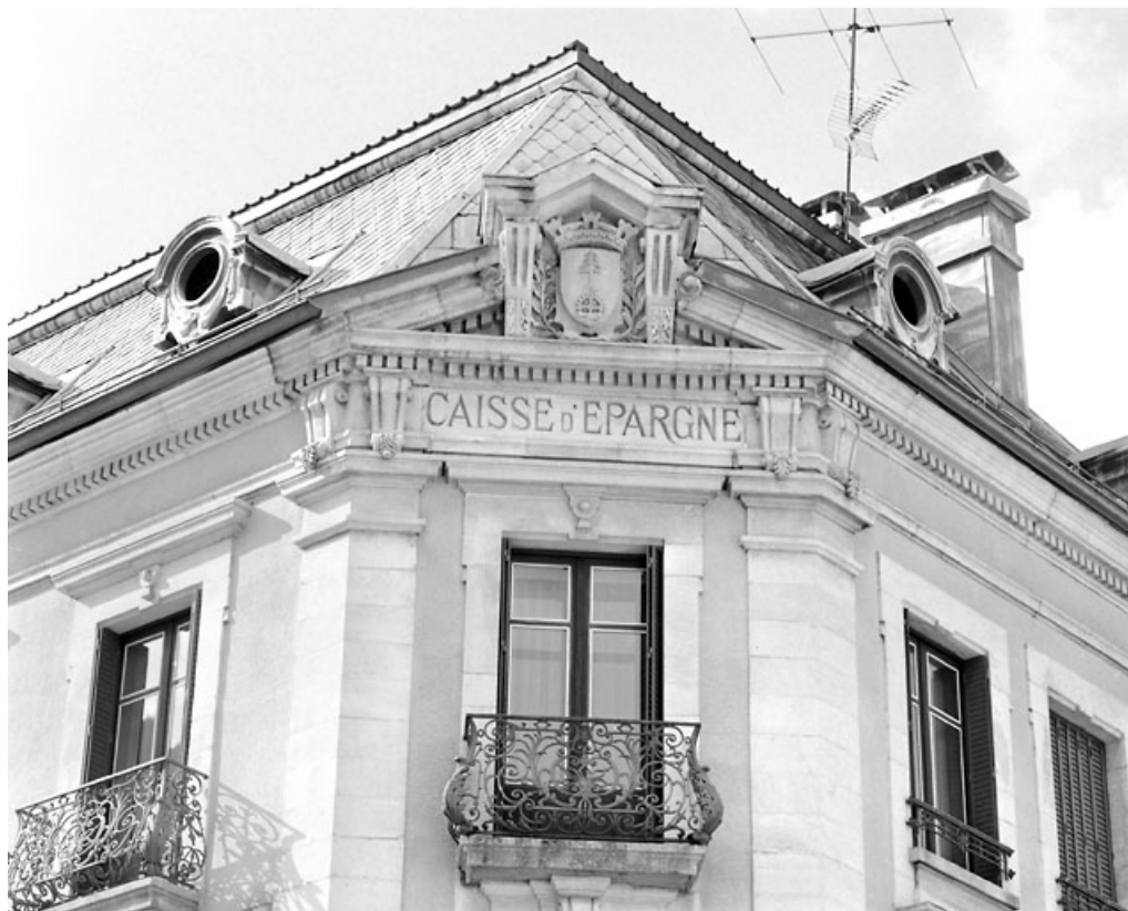
Pan coupé, deuxième étage : inscription et armoiries de la ville.