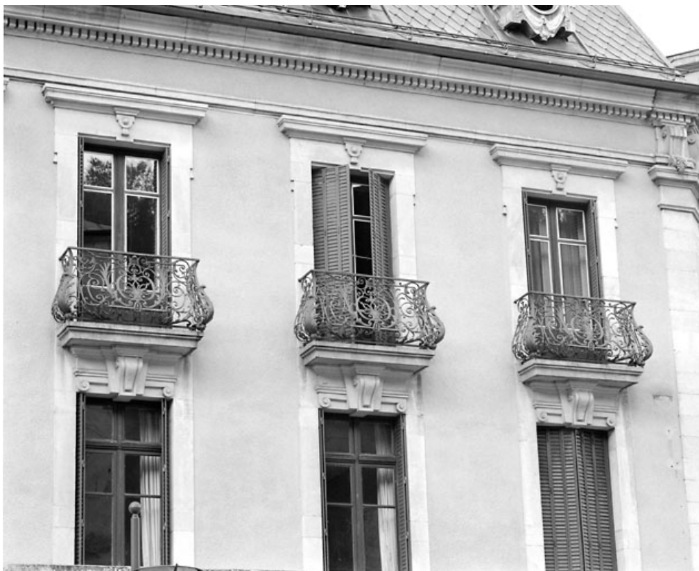
Élévation rue de la République : balcons du deuxième étage.