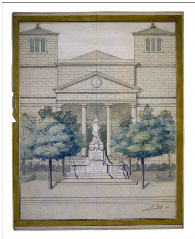
[Projet de monument aux morts], 1921.