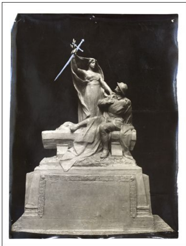
[Projet de monument aux morts : La Gloire éveille le Poilu à l'Immortalité (maquette des statuaires Pierre Curillon et Diosi)], 1921. 39, Morez place Notre-Dame