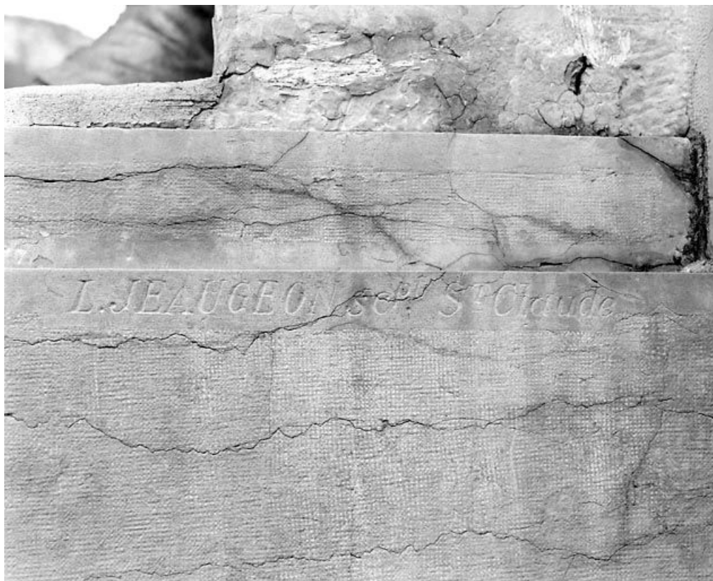
Socle : signature du sculpteur Jeugeon.