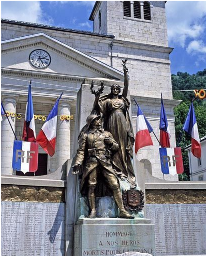
Groupe sculpté : vue d'ensemble.