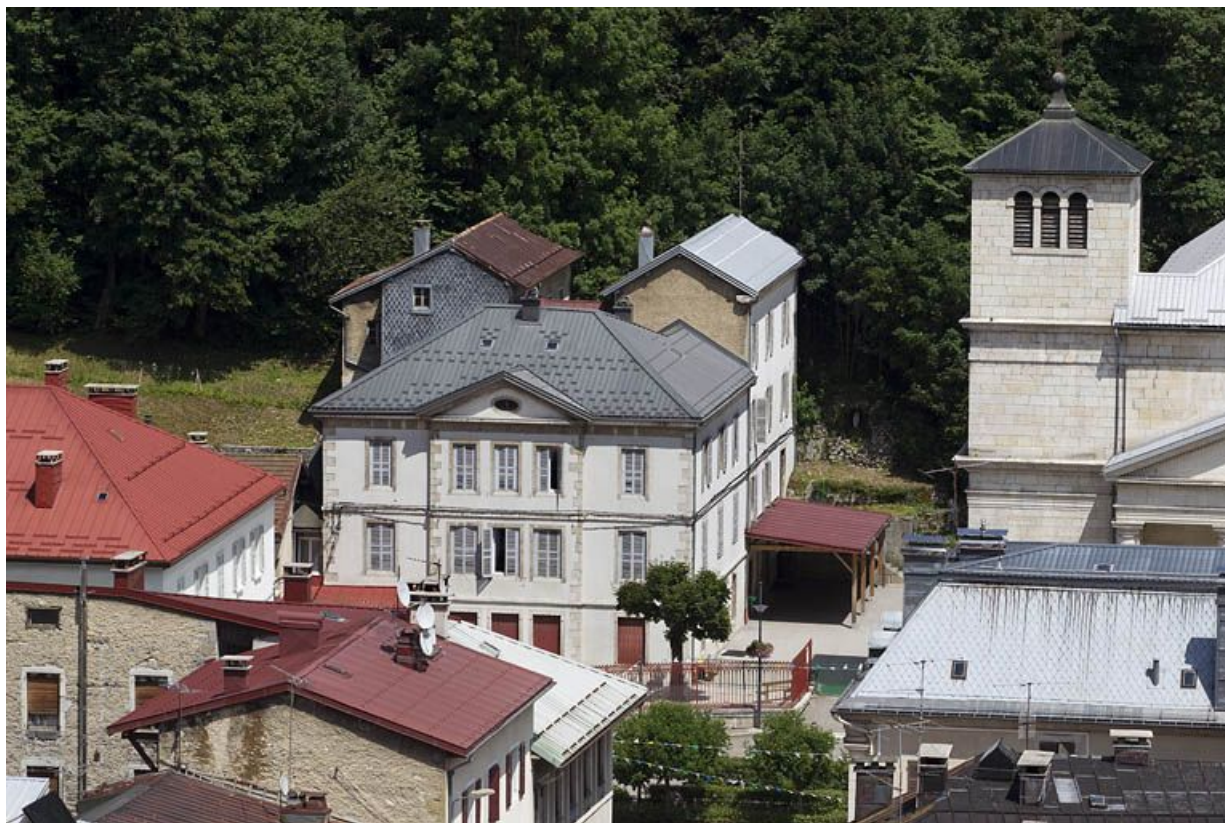
Vue d'ensemble plongeante, depuis le sud-ouest.