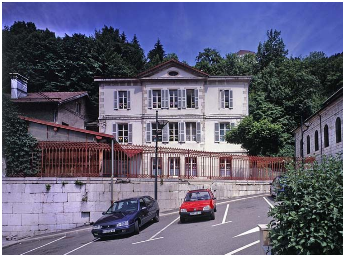
Façade antérieure. 39, Morez