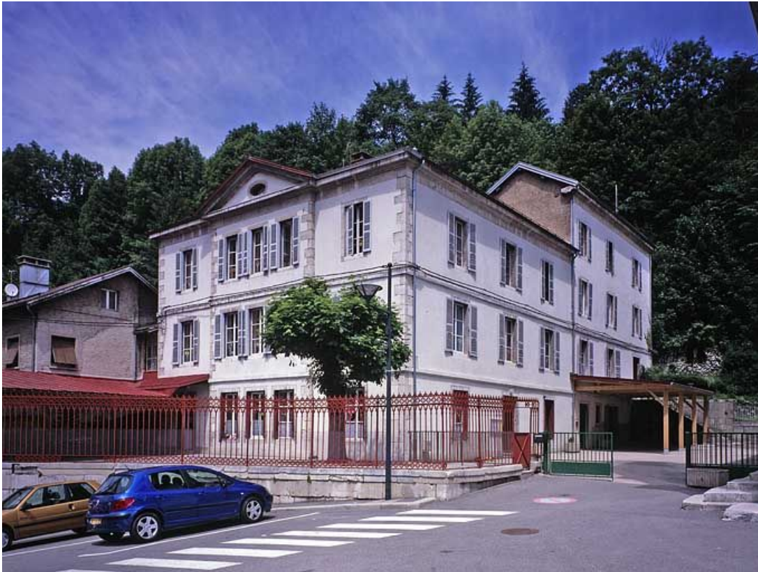
Vue d'ensemble, de trois quarts gauche. 39, Morez, 1 place Notre-Dame