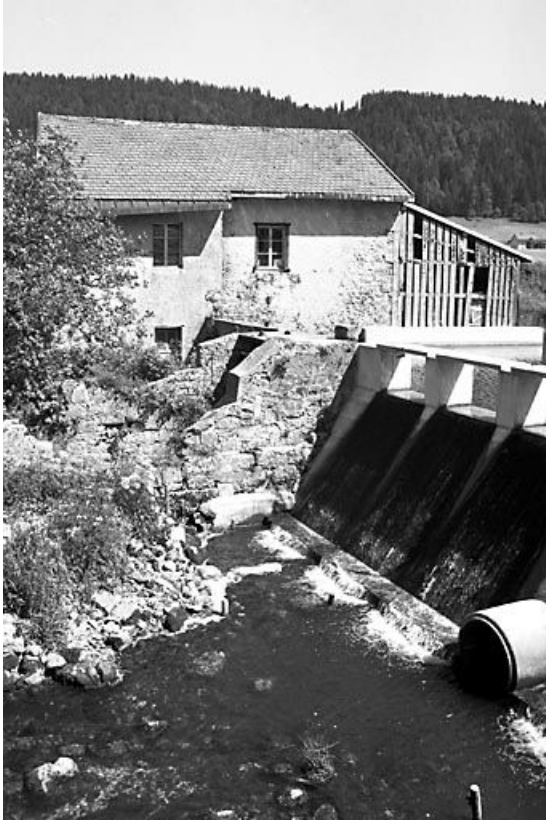
Vue du barrage et de la façade le long de l'Orbe.

39, Bois-d'Amont, 441 rue des Meuniers, lieudit : les Meuniers