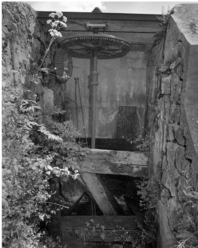
Système de roues hydrauliques, vue générale.

39, Bois-d'Amont, 441 rue des Meuniers, lieudit : les Meuniers