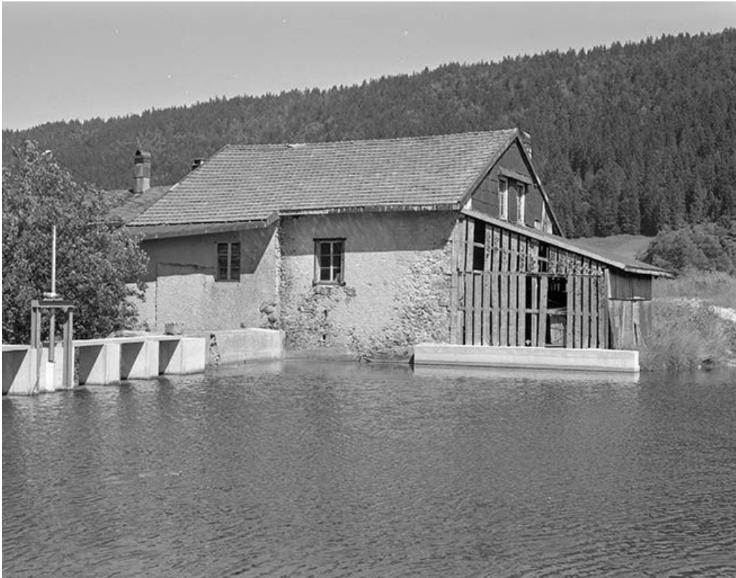
Vue de la façade le long de l'Orbe.

39, Bois-d'Amont, 441 rue des Meuniers, lieudit : les Meuniers