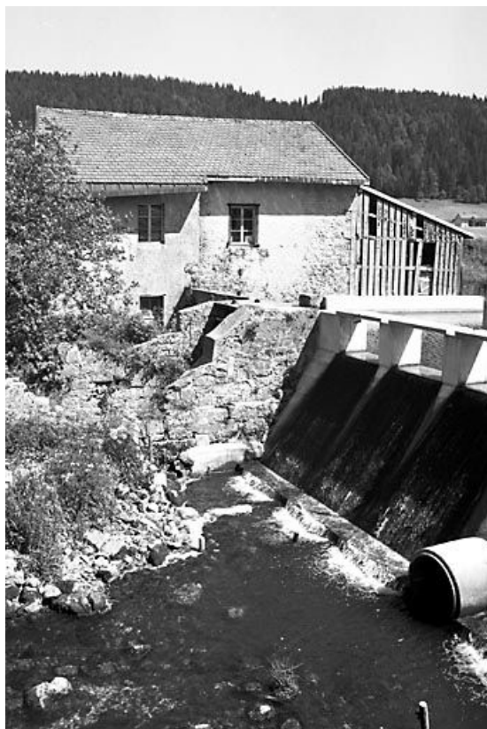
Vue du barrage et de la façade le long de l'Orbe.

39, Bois-d'Amont, 441 rue des Meuniers, lieudit : les Meuniers