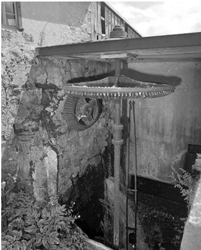
Système de roues hydrauliques, vue rapprochée.

39, Bois-d'Amont, 441 rue des Meuniers, lieudit : les Meuniers