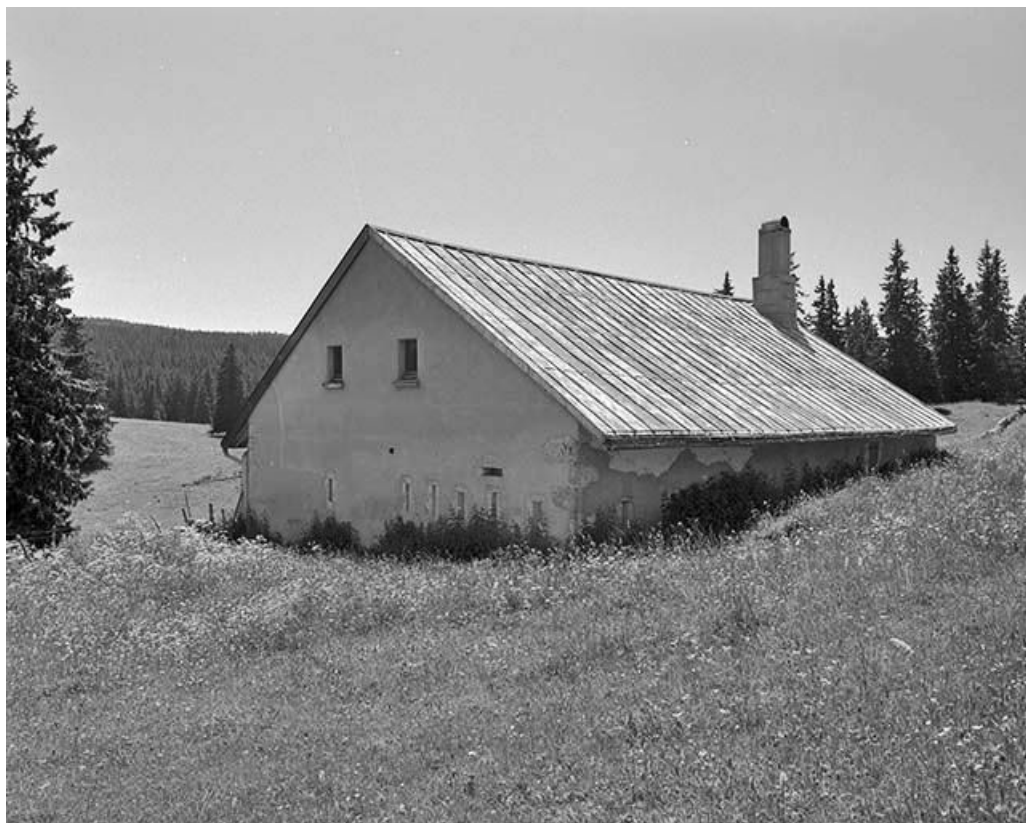
Vue de trois quarts de la face droite et de la façade postérieure.

39, Bois-d'Amont, lieudit : les Petits Plats