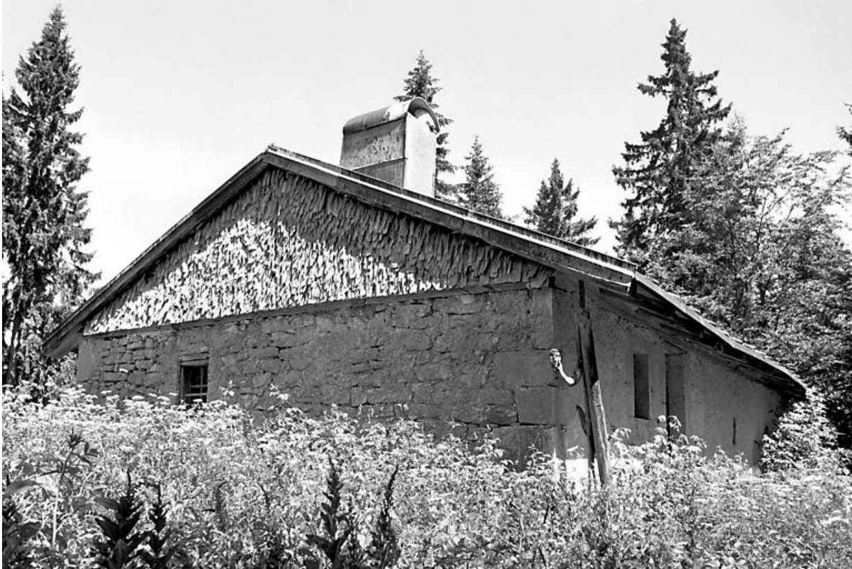
Face gauche et façade antérieure.

39, Bois-d'Amont, lieudit : Plan de la Fruitière