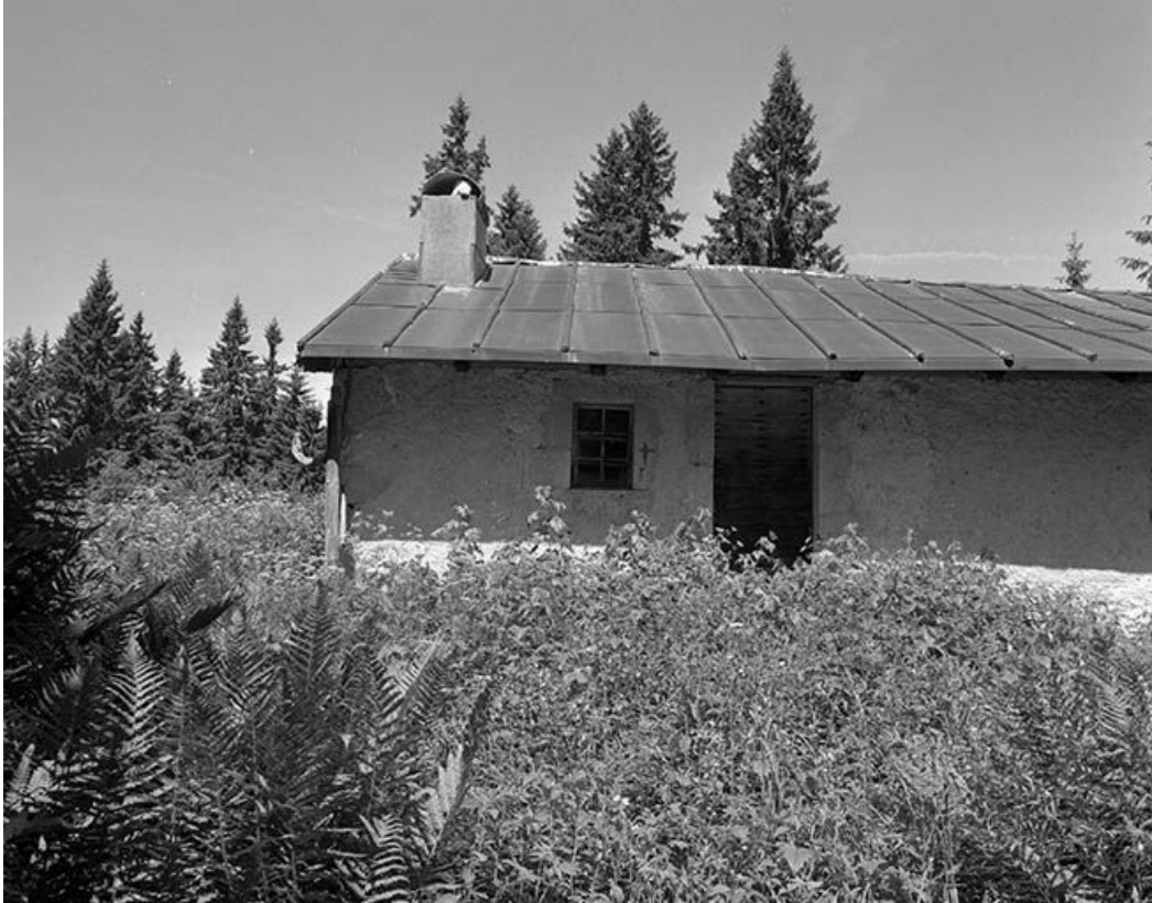
Porte d'accès de la façade antérieure.

39, Bois-d'Amont, lieudit : Plan de la Fruitière