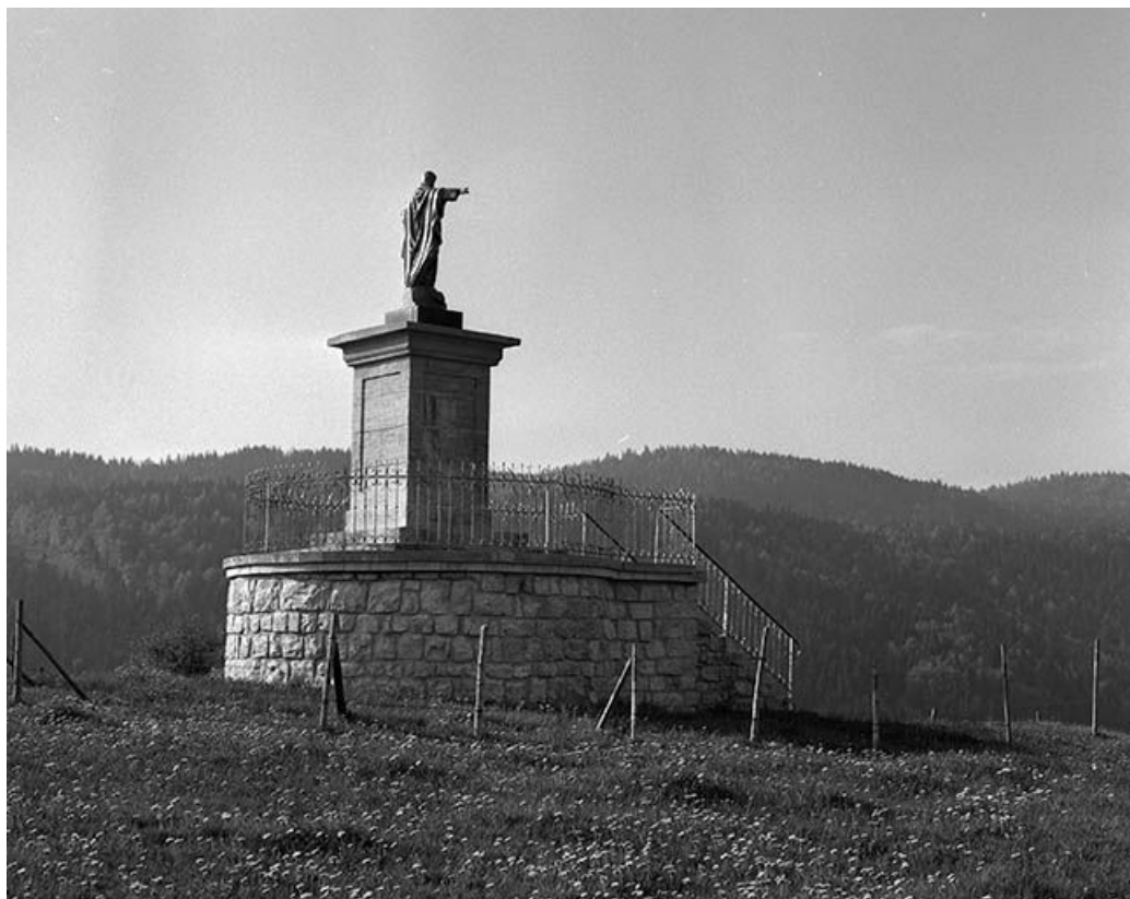
Vue d'ensemble, de trois quarts arrière.