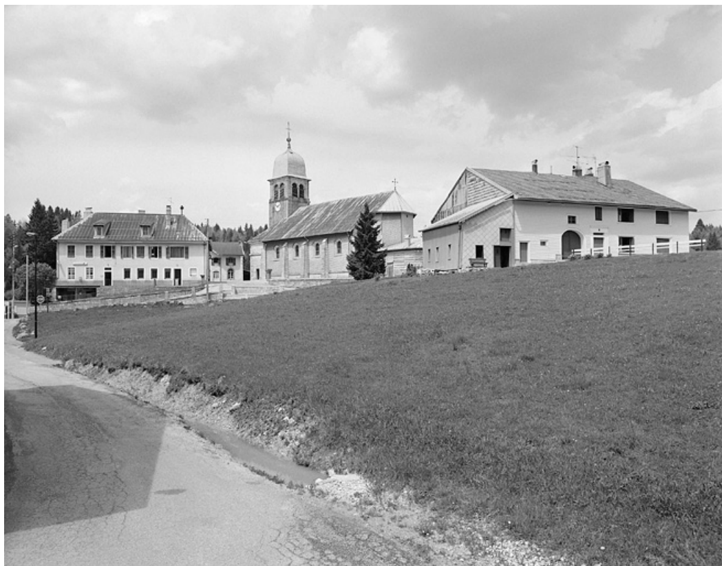
Vue du centre du village.