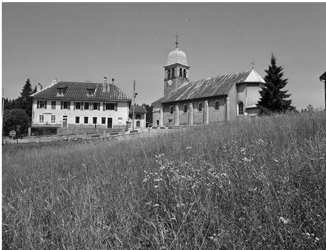
Vue générale de la mairie-école et de l'église.