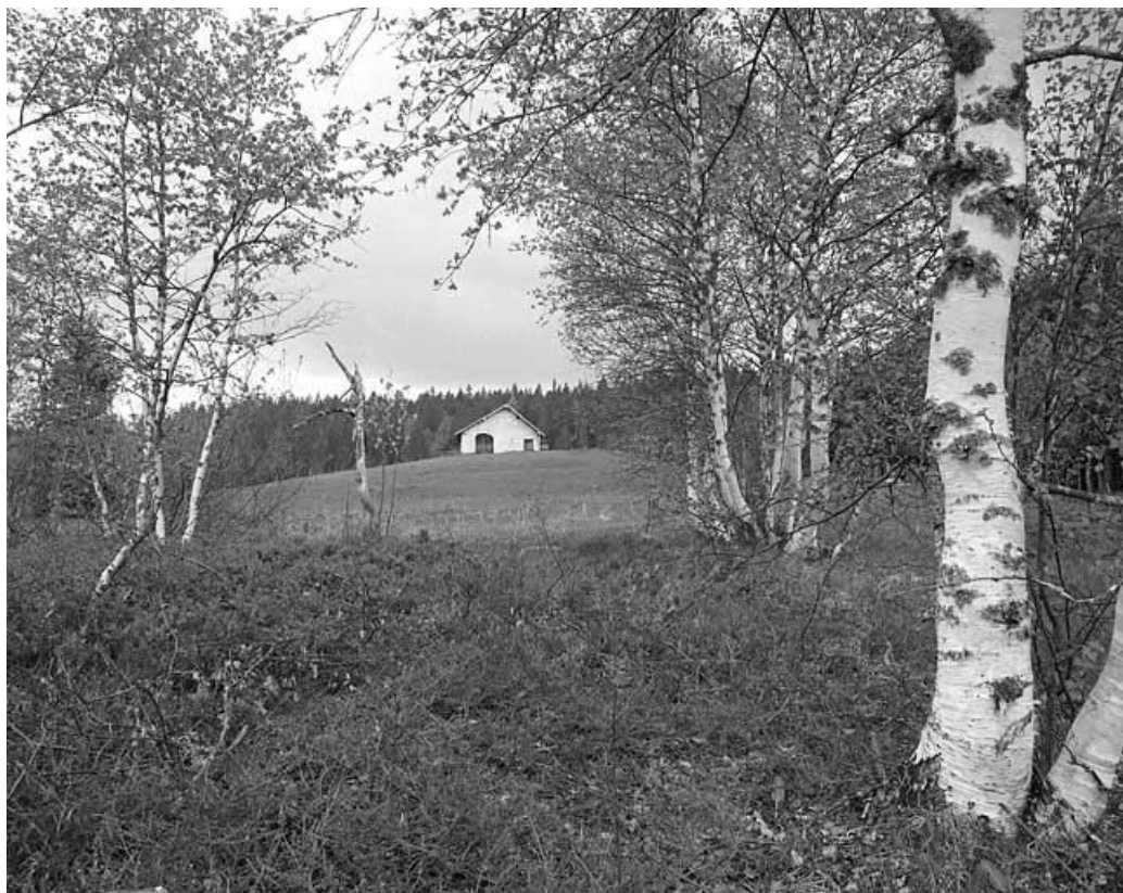
Vue éloignée d'une étable à vaches à Bellefontaine, façade antérieure.