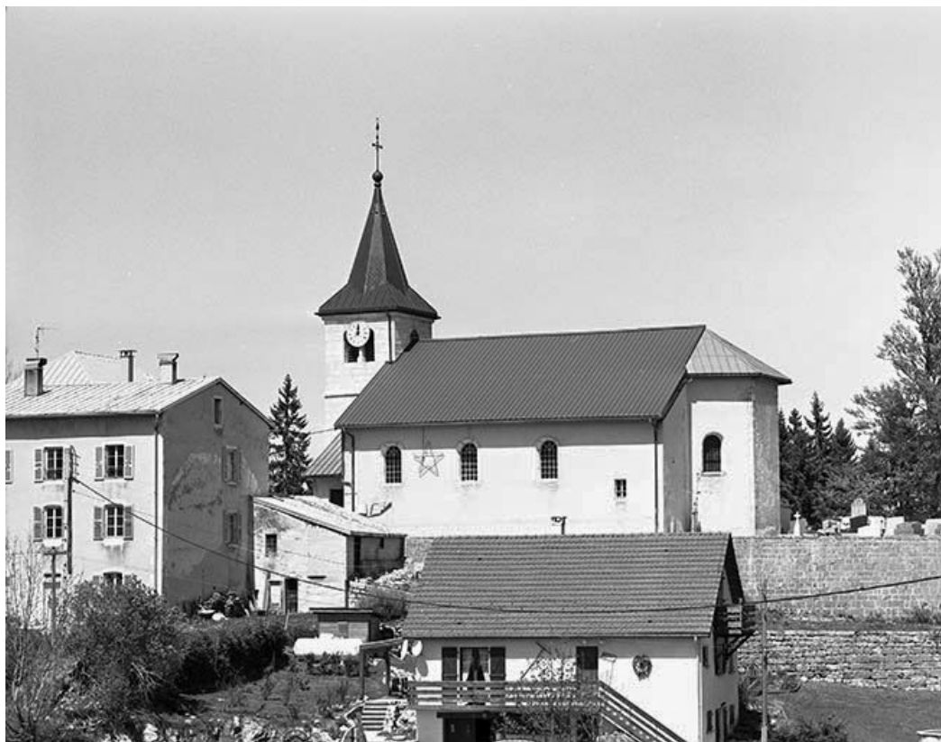
Vue éloignée de la façade latérale droite.