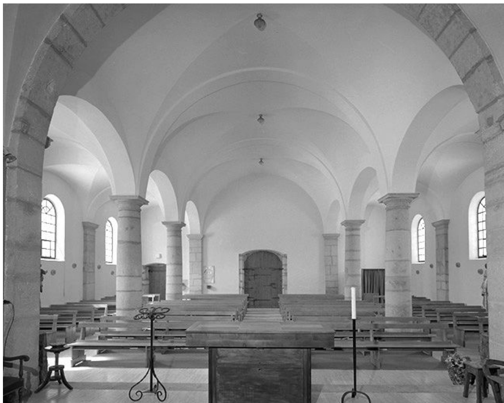
Le vaisseau central vu depuis le chœur.