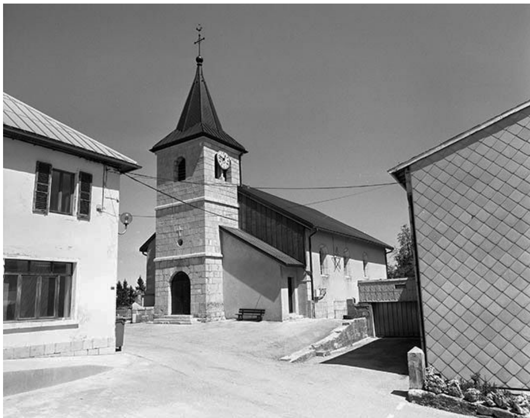
Façade antérieure vue de trois quarts droit.