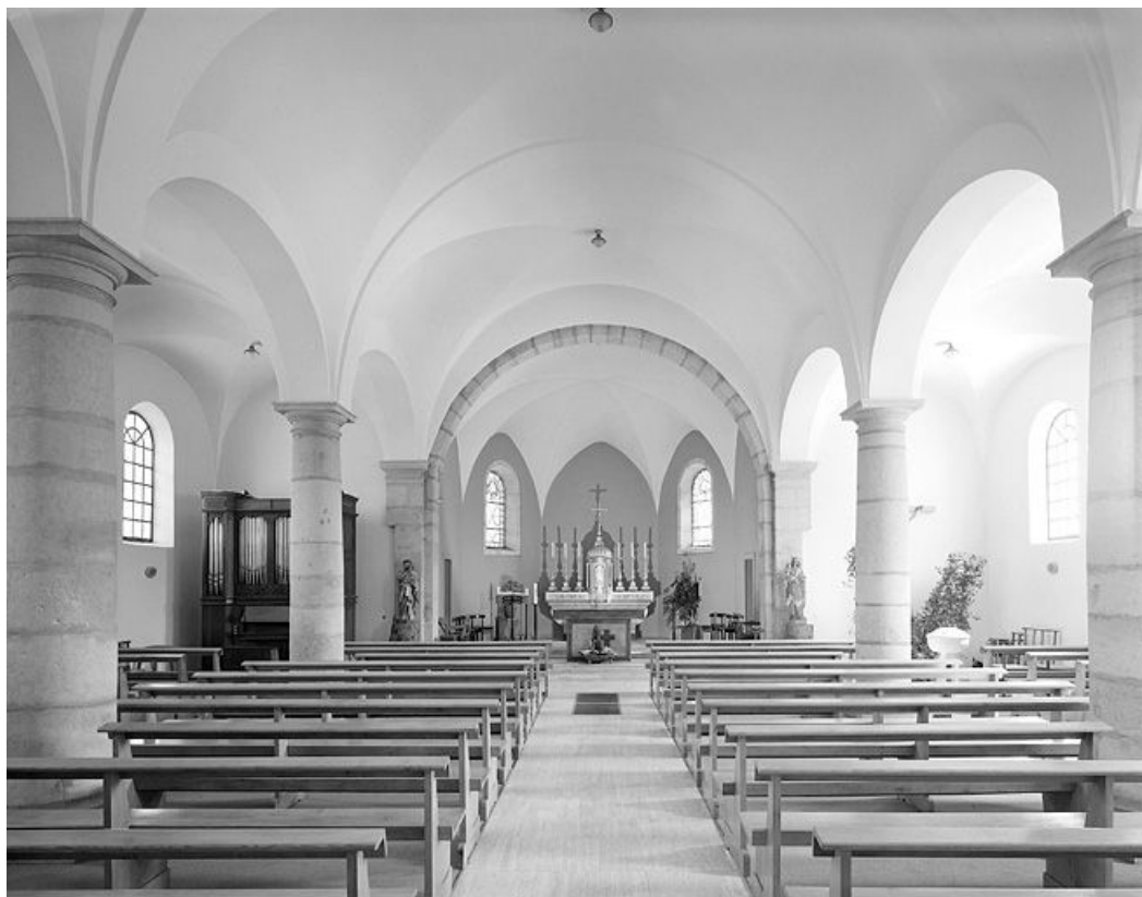
Le vaisseau central vu depuis l'entrée.