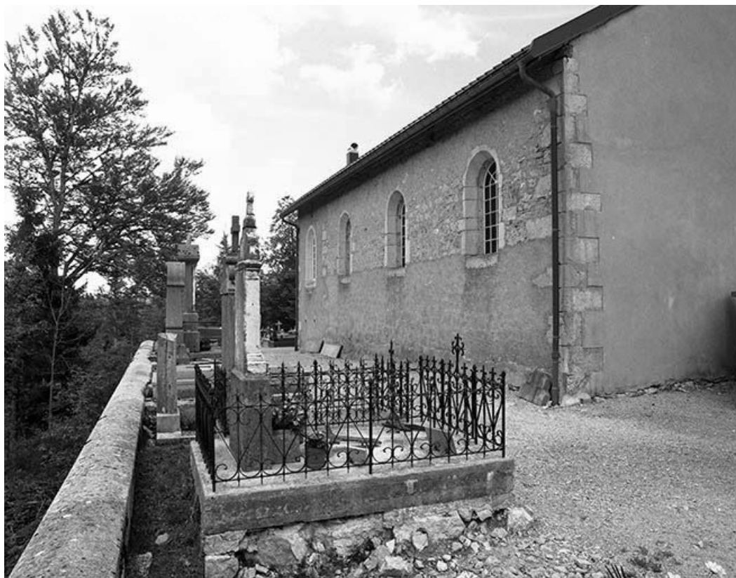
Façade gauche vue de trois quarts.