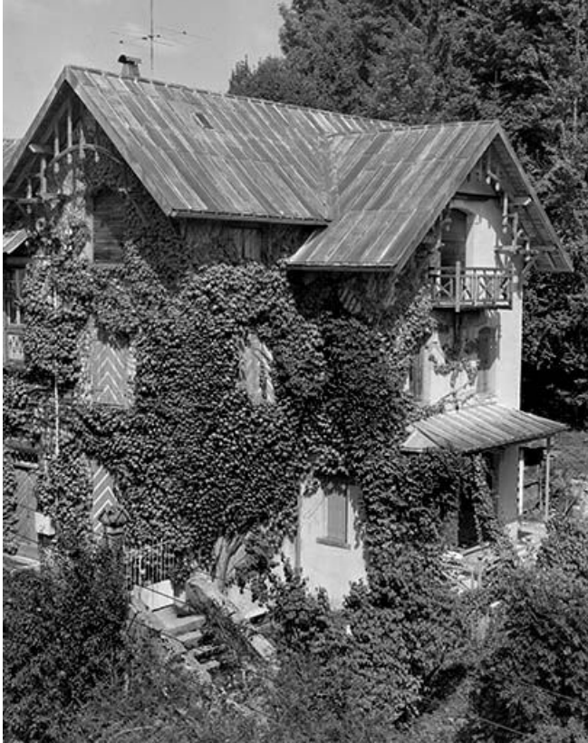
Façades sud-est et sud-ouest vues de trois quarts.