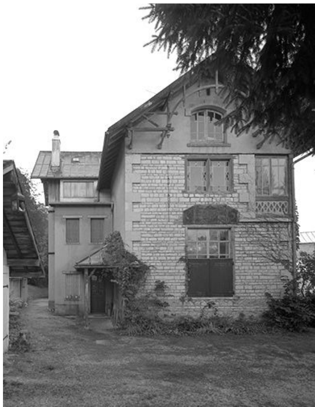
Vue de trois quarts d'une partie de la façade nord-est.