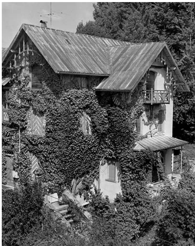
Façades sud-est et sud-ouest vues de trois quarts.