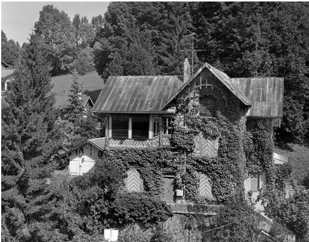
Vue éloignée de la façade sud-ouest.