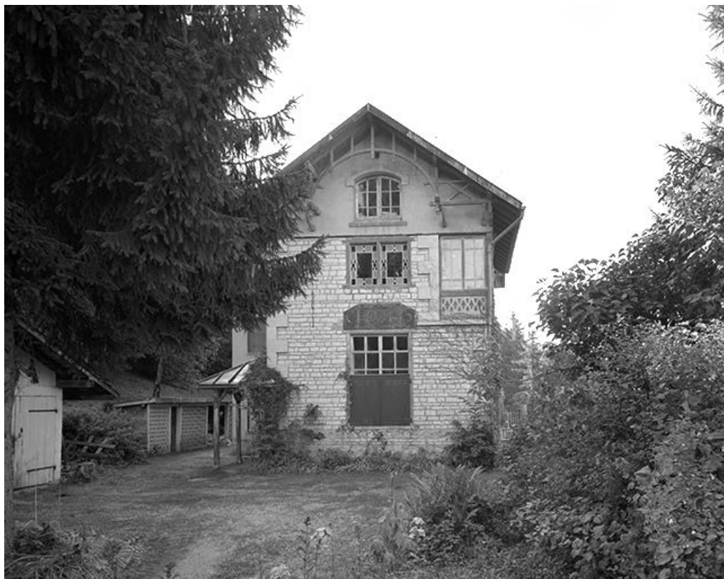
Vue générale depuis le nord-ouest.