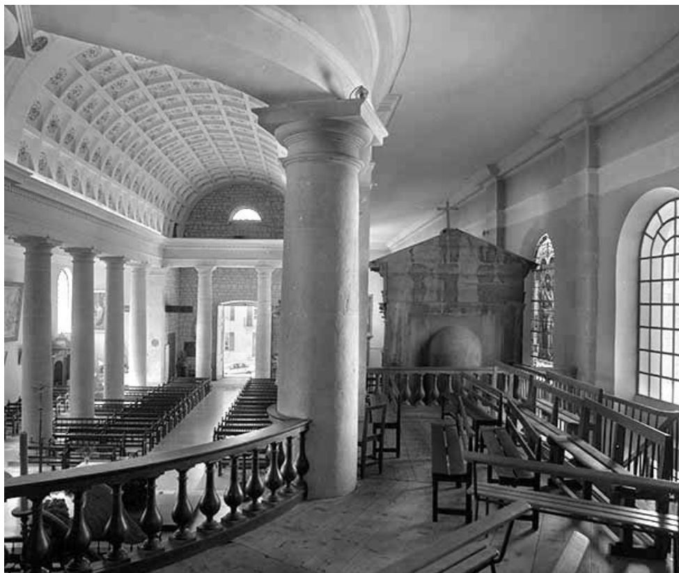
Le vaisseau central vu de trois quarts depuis le déambulatoire.