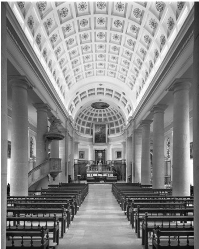
Le vaisseau central vu depuis le porche d'entrée.