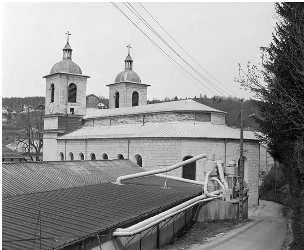
L'abside et la face droite.