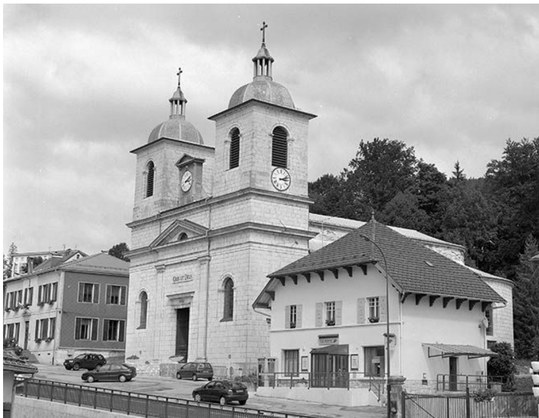
Façade antérieure vue de trois quarts droit.