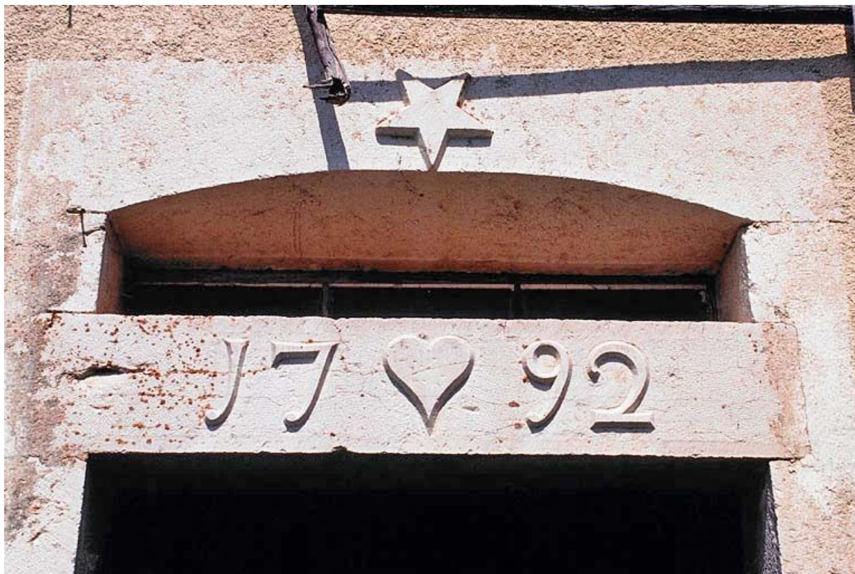
Détail de la date portée sur le linteau de la porte d'accès.