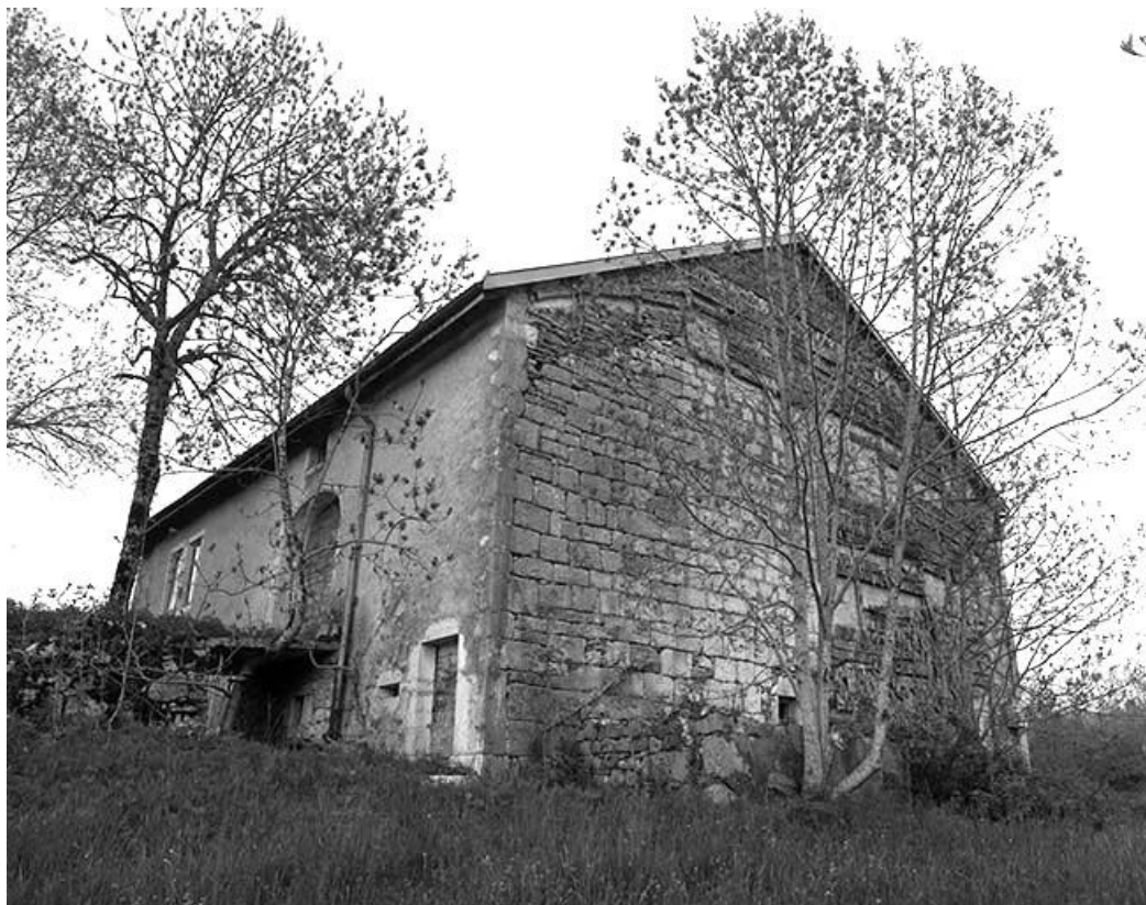
Façade postérieure et face gauche vues de trois quarts.