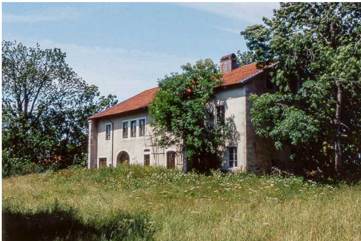
Vue de trois quarts de la façade antérieure.