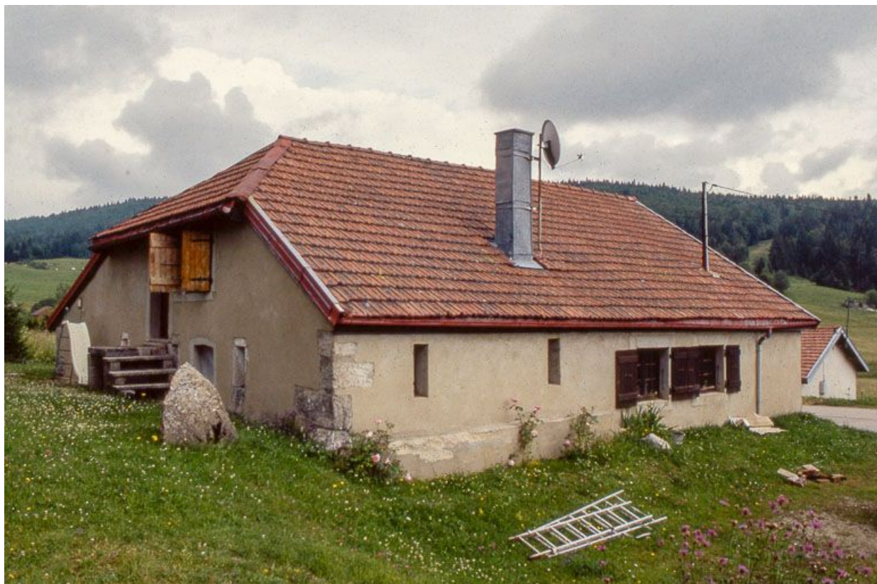
Vue de trois quarts de la façade postérieure et de la face gauche.

39, Longchaumois rue Rosset, lieudit : le Rosset