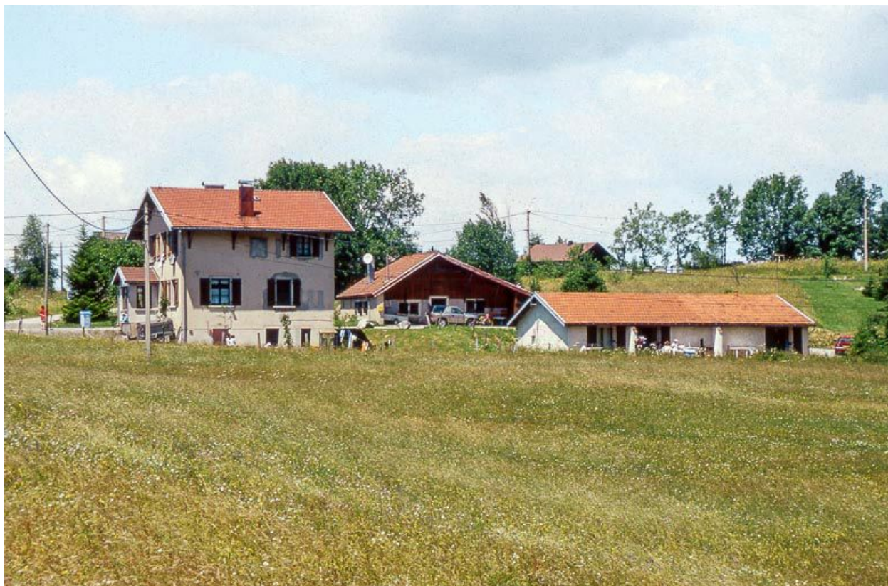
Vue éloignée de la fromagerie ancienne (au centre) et de la porcherie (à droite).

39, Longchaumois rue Rosset, lieudit : le Rosset