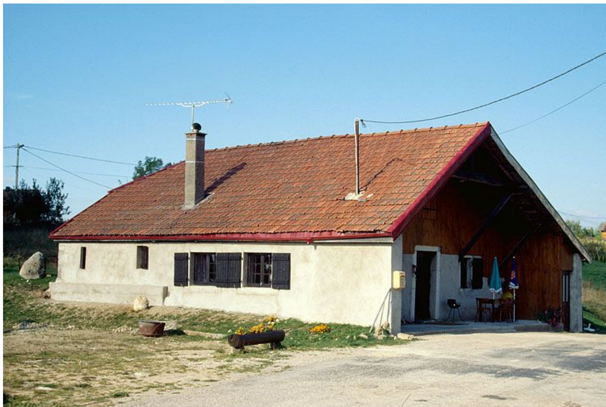
Vue de trois quarts de la façade antérieure et de la face gauche.

39, Longchaumois rue Rosset, lieu-dit : le Rosset