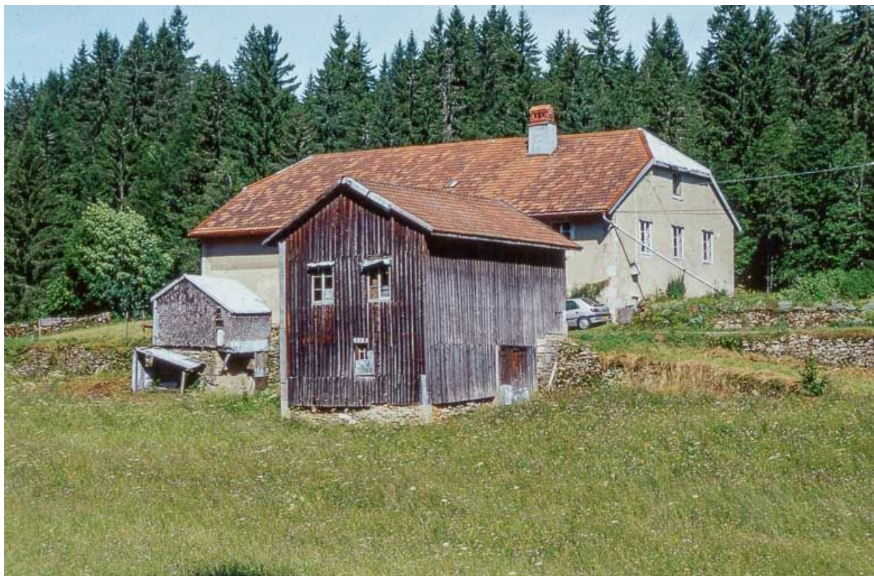
Vue d'ensemble de la ferme, de la remise et du " grenier fort ".

39, Longchaumois, lieudit : les Repentys