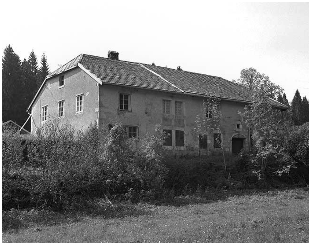
Façade postérieure vue de trois quarts gauche.

39, Longchaumois, lieudit : les Repentys