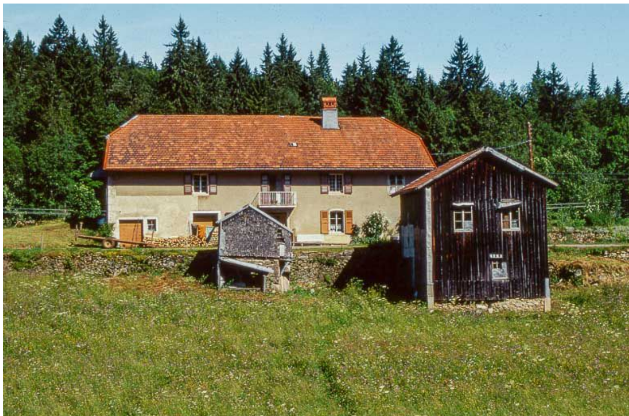
Façade antérieure, " grenier fort " et remise au premier plan.

39, Longchaumois, lieudit : les Repentys