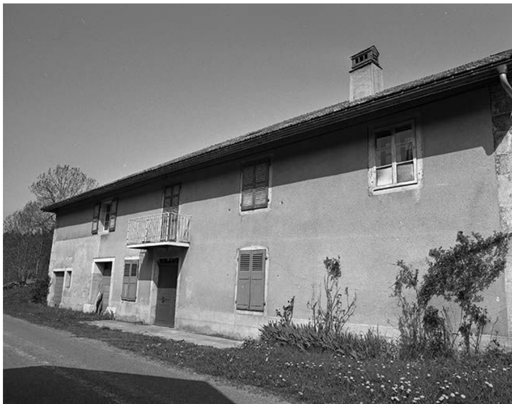
Façade antérieure vue de trois quarts droit.

39, Longchaumois, lieudit : les Repentys