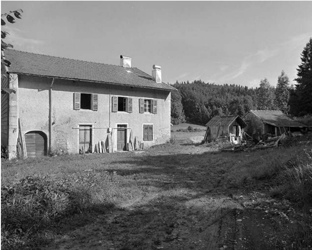
Façade antérieure et " grenier fort " sur le côté droit.