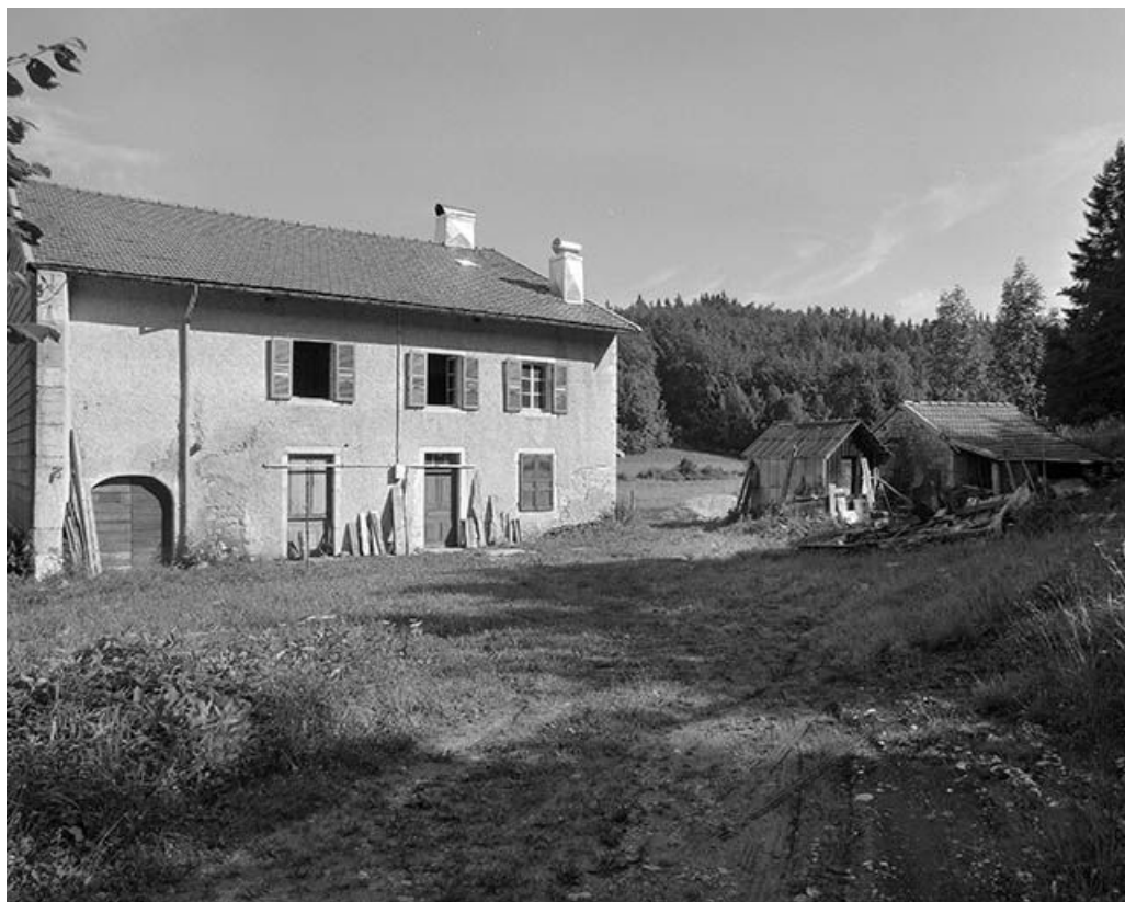
Façade antérieure et " grenier fort " sur le côté droit.