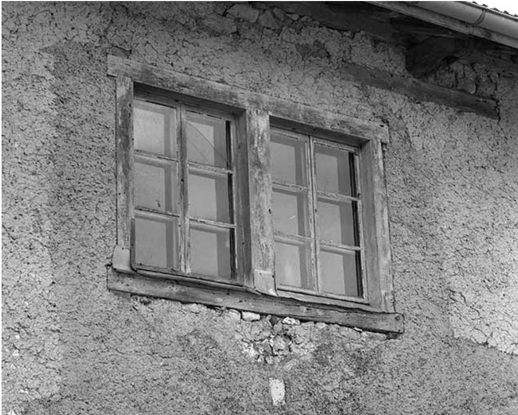
Fenêtre double sur la façade postérieure.