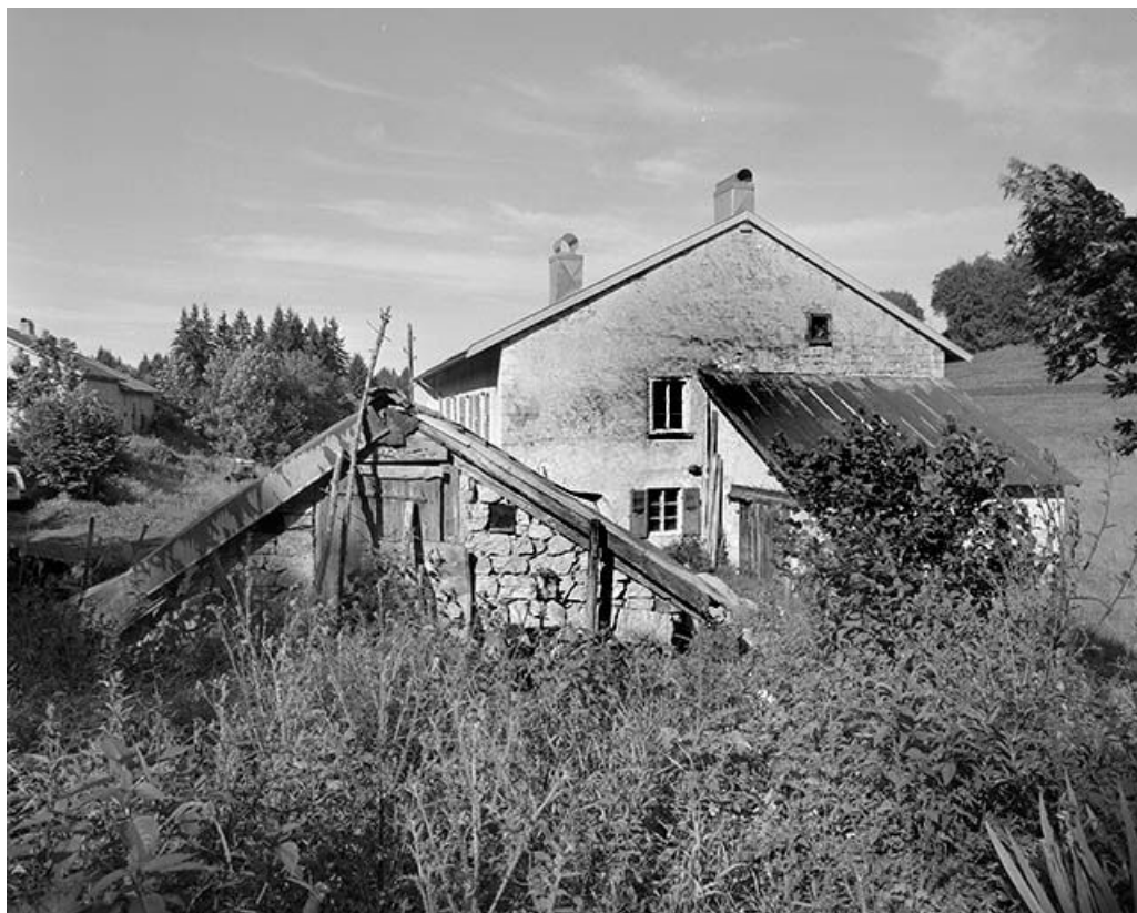
Face droite et remise.