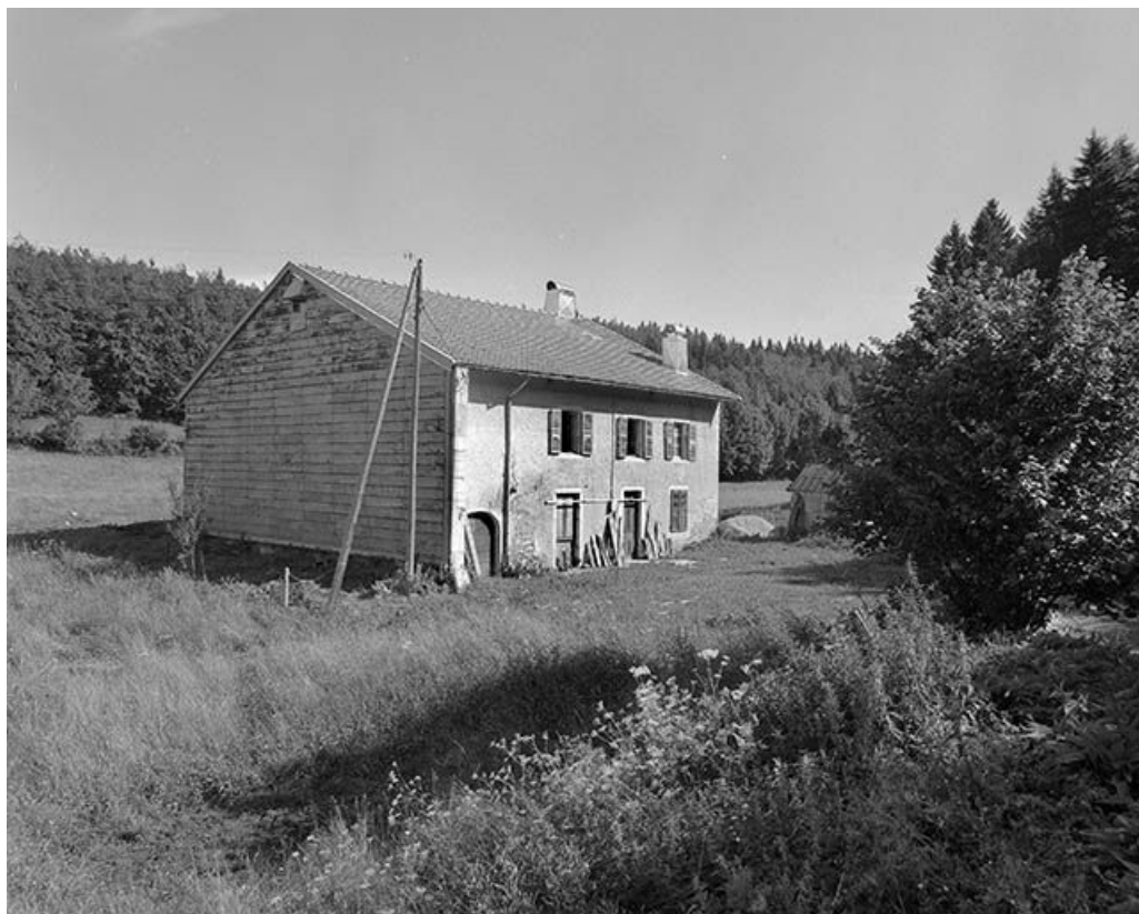
Façade antérieure et face latérale gauche vues de trois quarts.