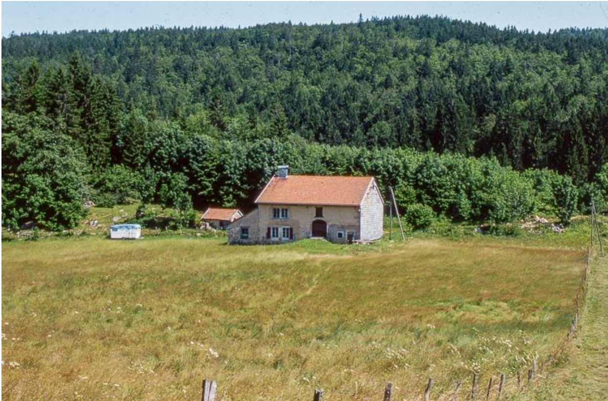
Vue éloignée de la façade postérieure.