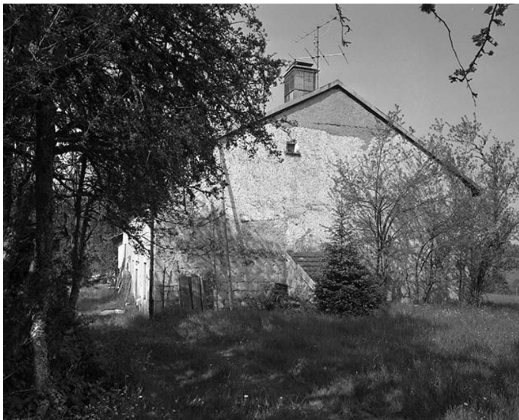
Face droite, four accolé et trace de demi-croupe.

39, Longchaumois, lieudit : les Baptaillards