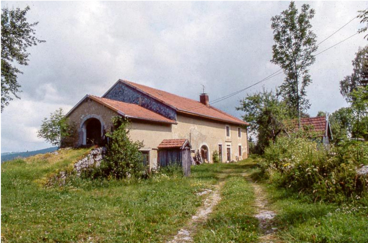
Vue éloignée de la façade antérieure.