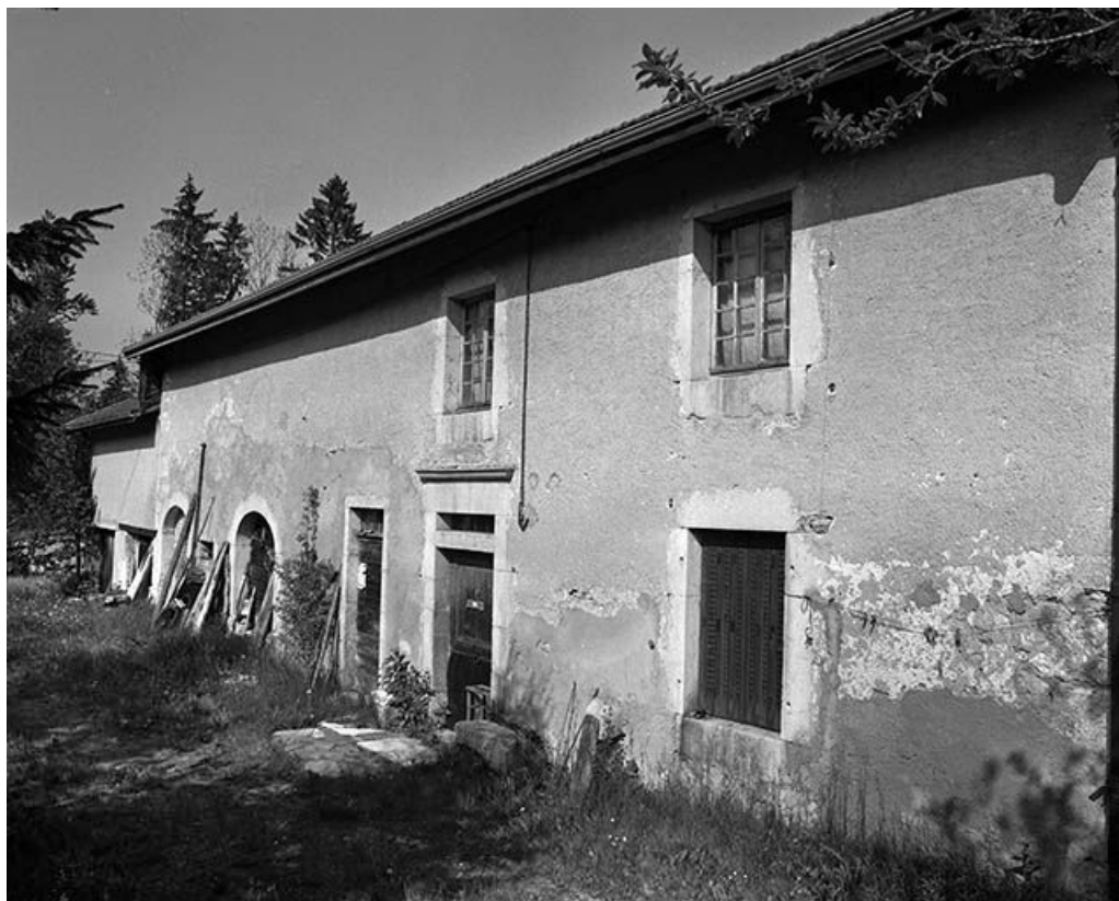
Façade antérieure vue de trois quarts droit.

39, Longchaumois, lieudit : les Baptallards