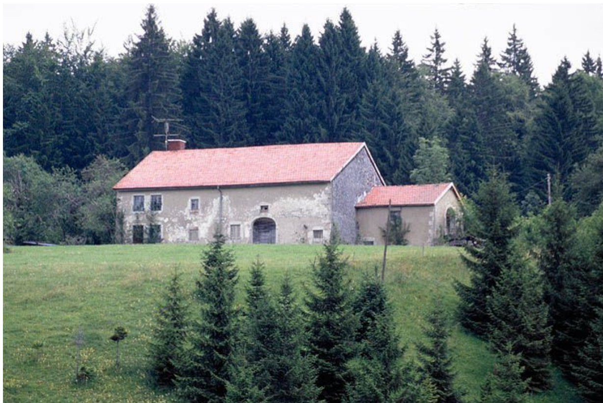
Vue éloignée de la façade postérieure.

39, Longchaumois, lieudit : les Baptaillards