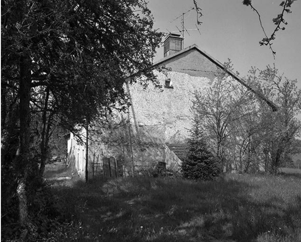
Face droite, four accolé et trace de demi-croupe.

39, Longchaumois, lieudit : les Baptaillards