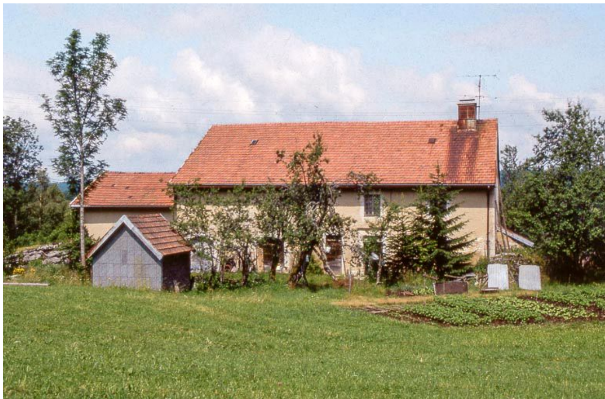
Vue éloignée du grenier fort devant la façade antérieure.

39, Longchaumois, lieudit : les Baptaillards