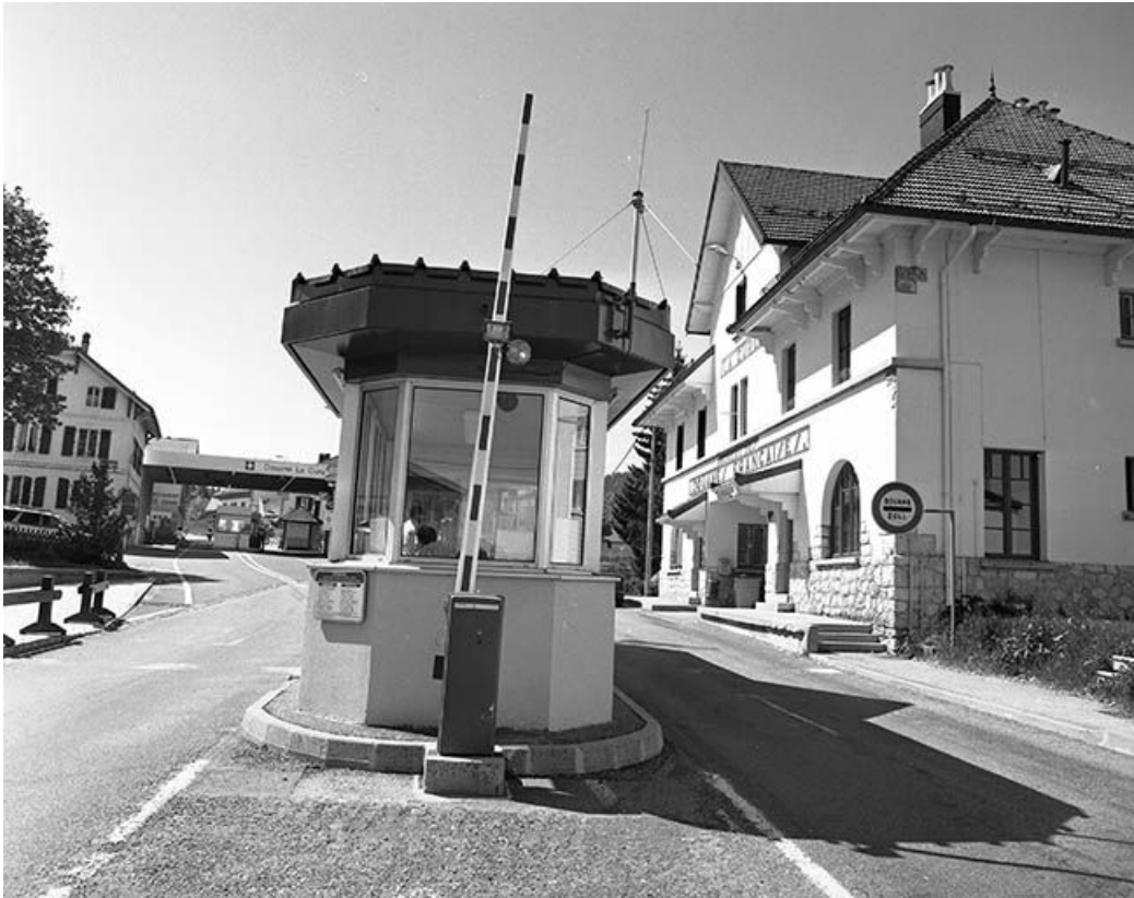
Façade antérieure vue de trois quarts droit.

39, Les Rousses, 498 rue de la Frontière, lieudit : la Cure