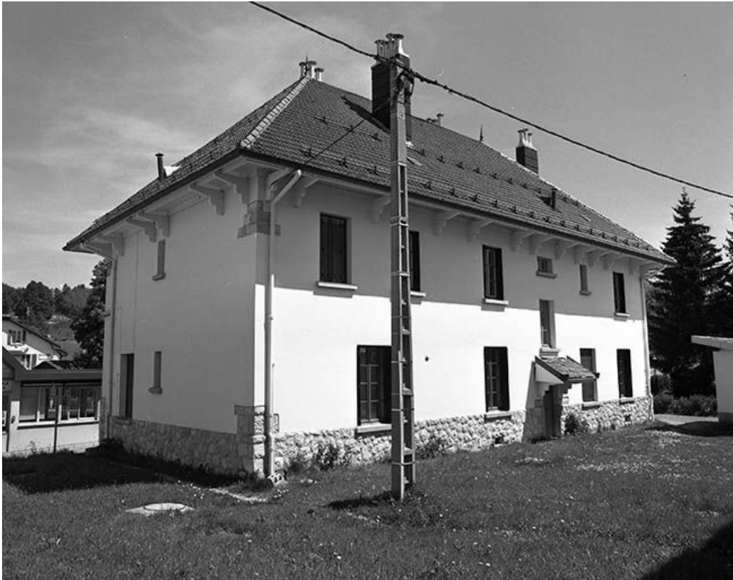
Façade postérieure et face droite.

39, Les Rousses, 498 rue de la Frontière, lieudit : la Cure