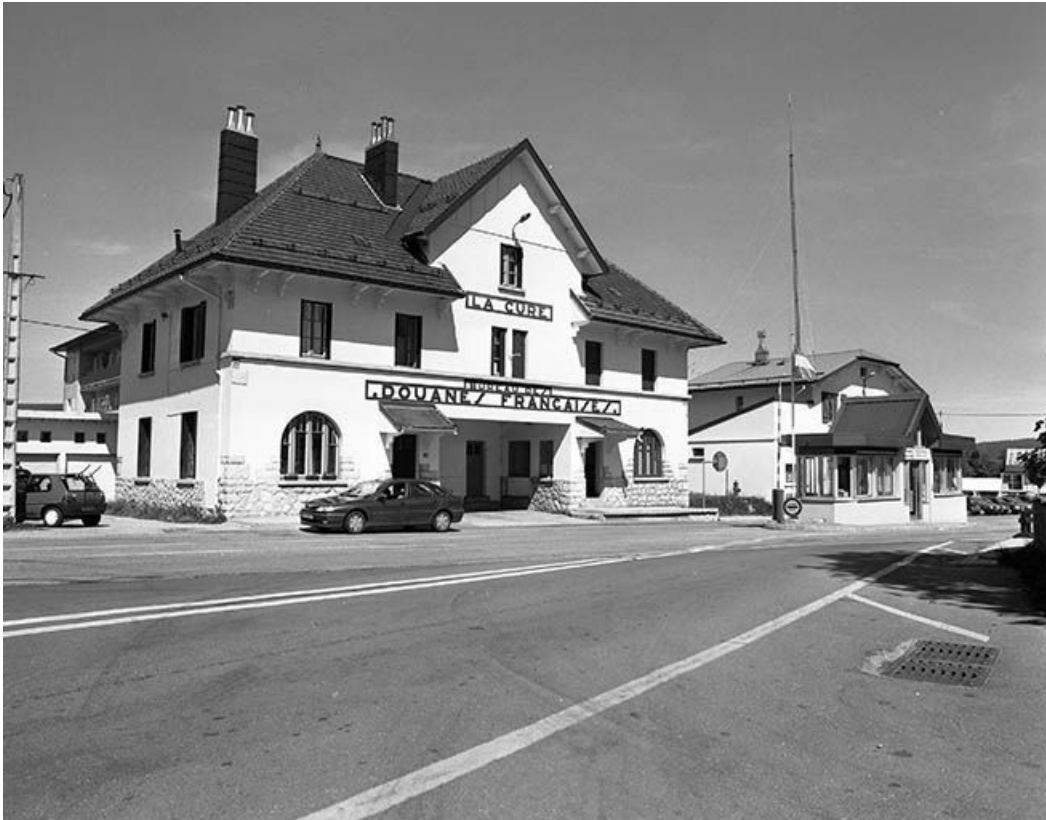
Façade antérieure et face gauche.

39, Les Rousses, 498 rue de la Frontière, lieudit : la Cure