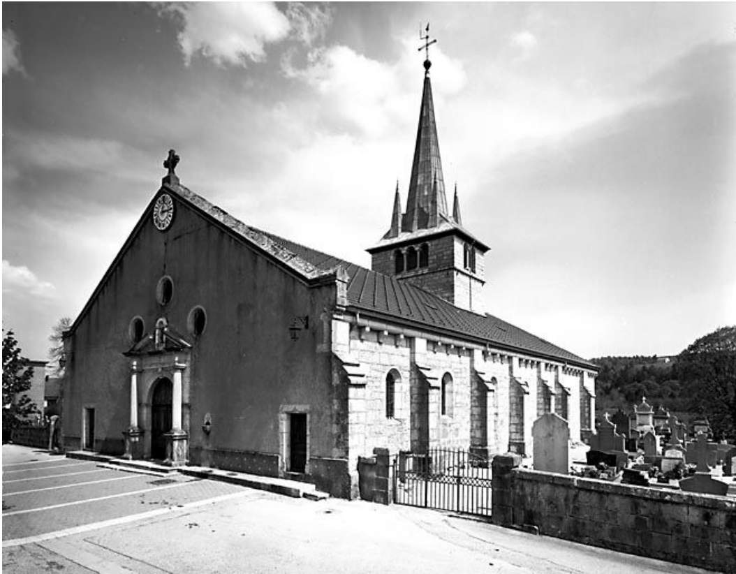
Façade antérieure et face droite.