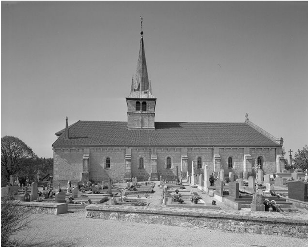
Façade latérale gauche.