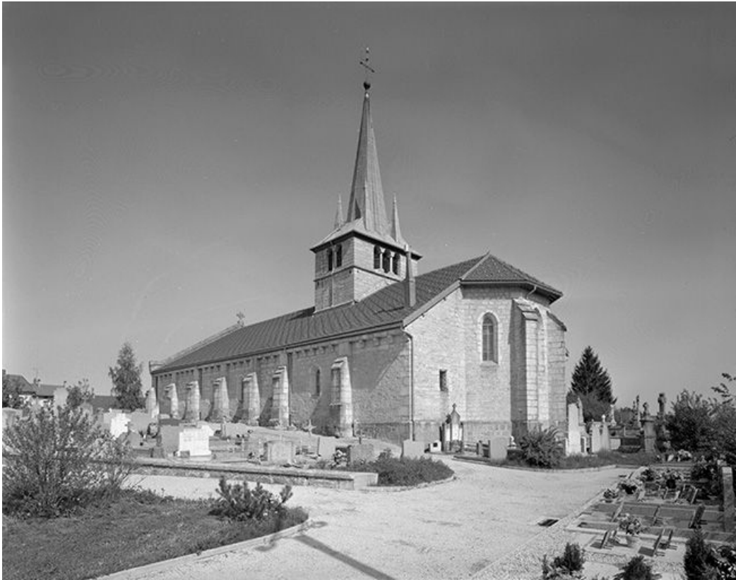
Le chevet et la face gauche.