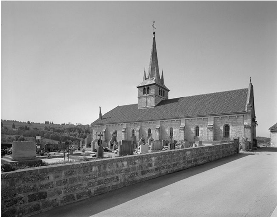
Vue de trois quarts de la façade gauche et du cimetière.