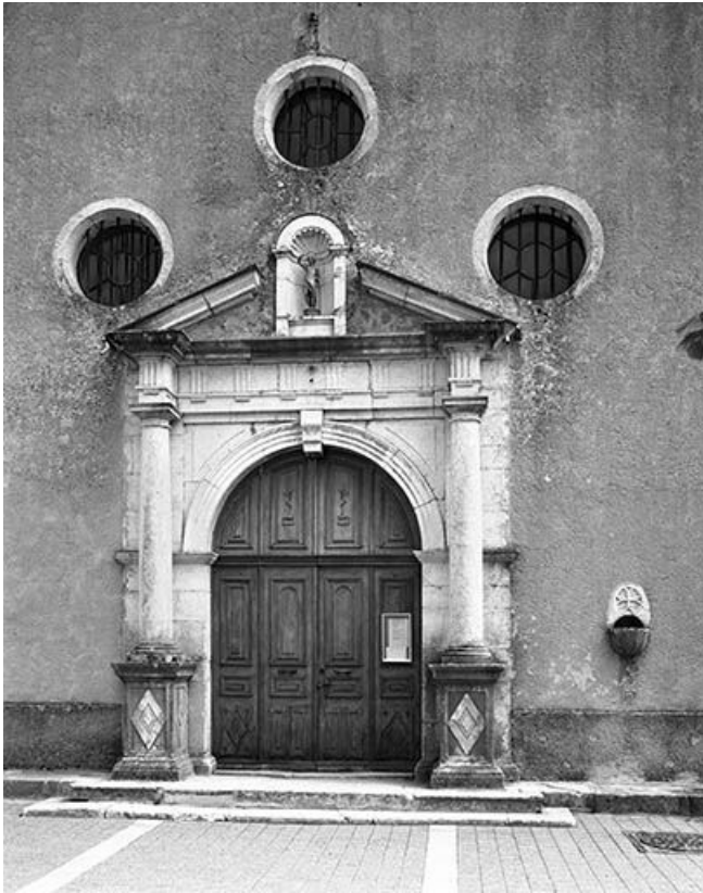
Le porche d'entrée.