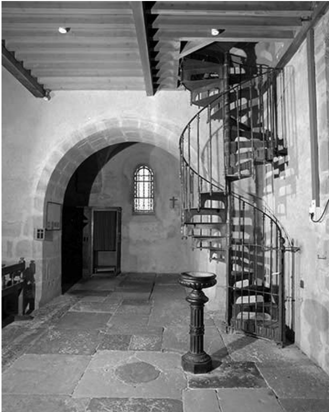
L'escalier d'accès à la tribune.