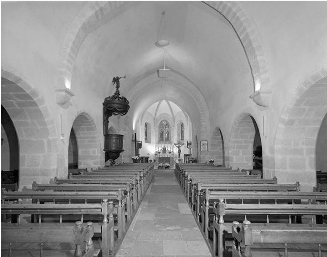
Le vaisseau central et le chœur.