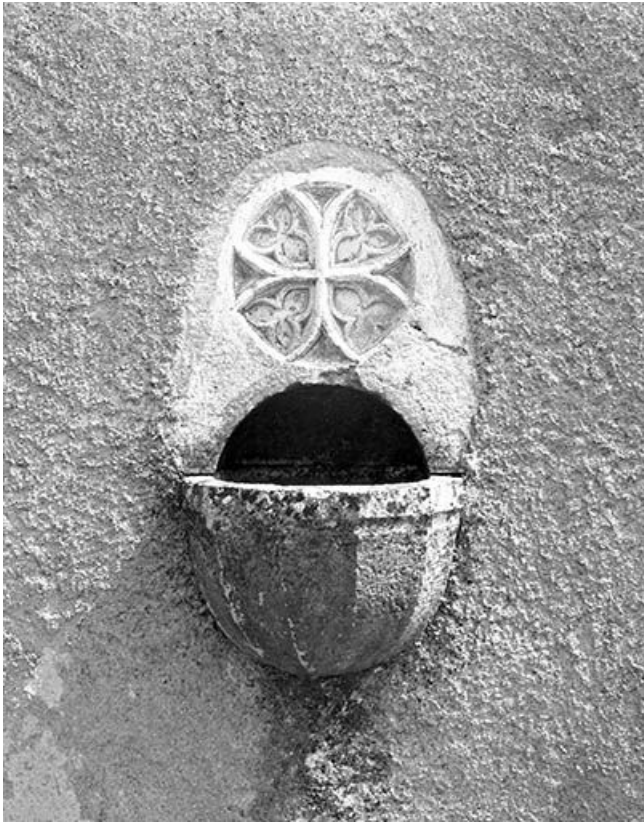
Bénitier du mur de la façade antérieure.