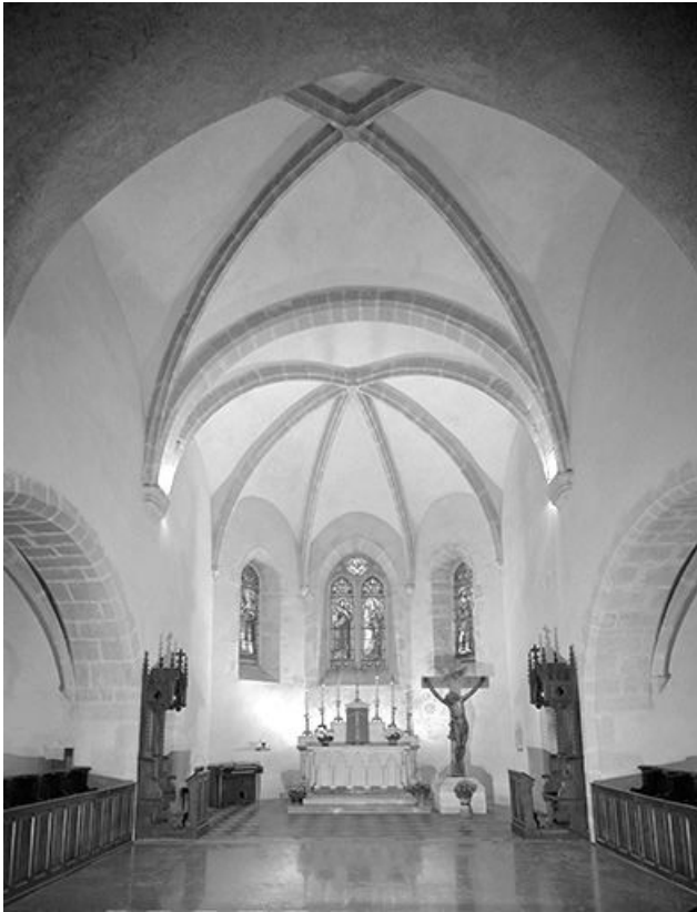
Le chœur vu depuis la nef.