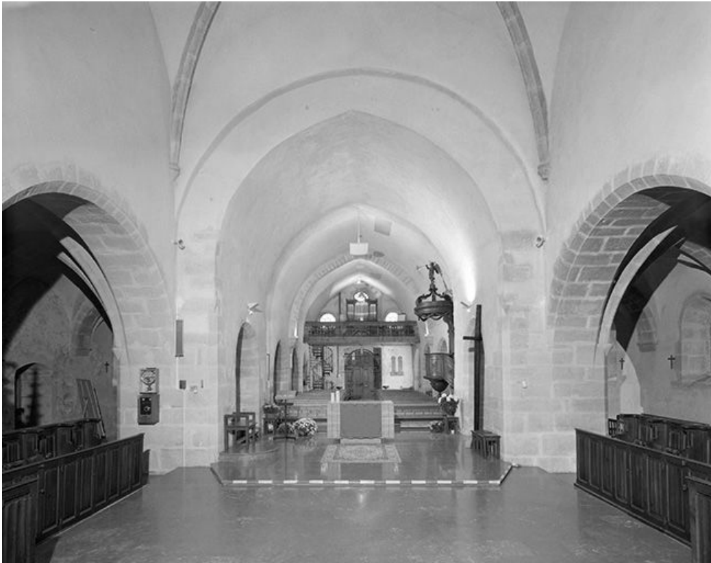
La nef vue depuis le chœur.