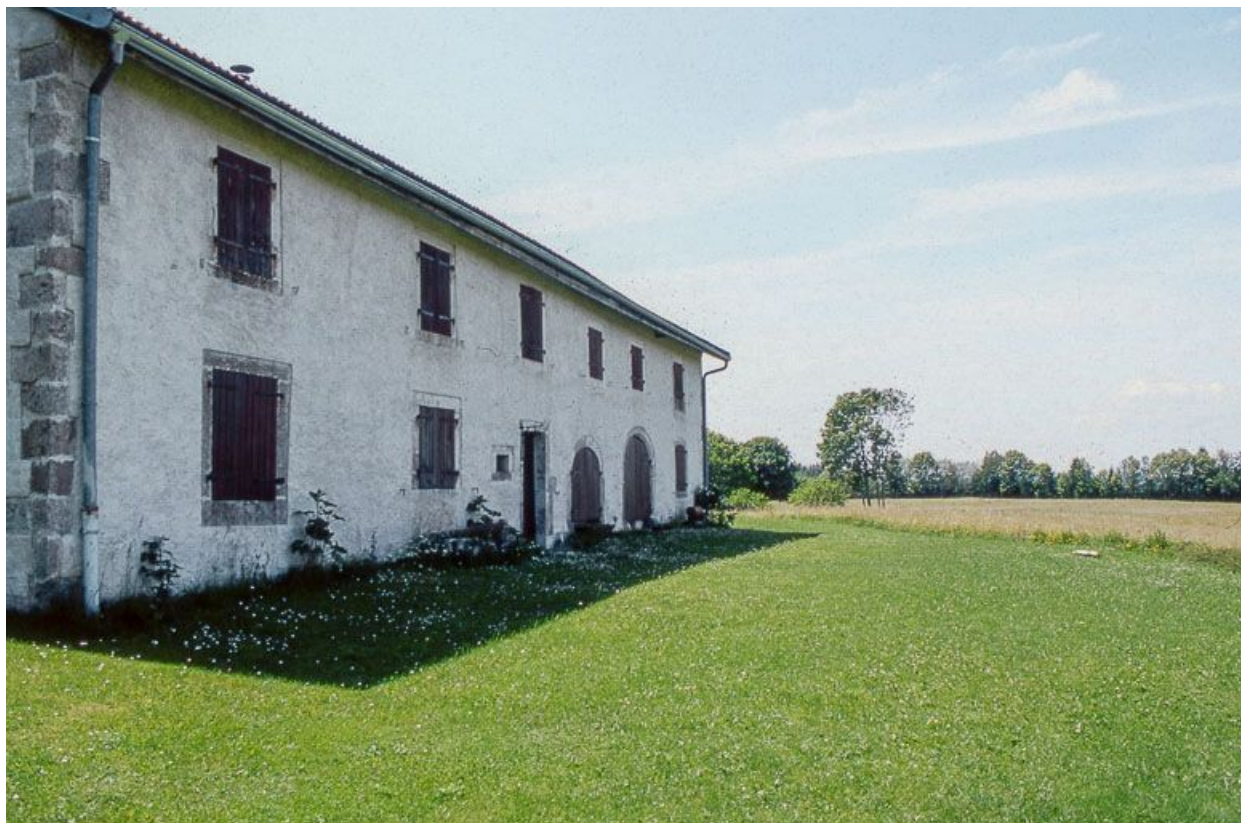
Façade antérieure d'une ferme à Beauregard.