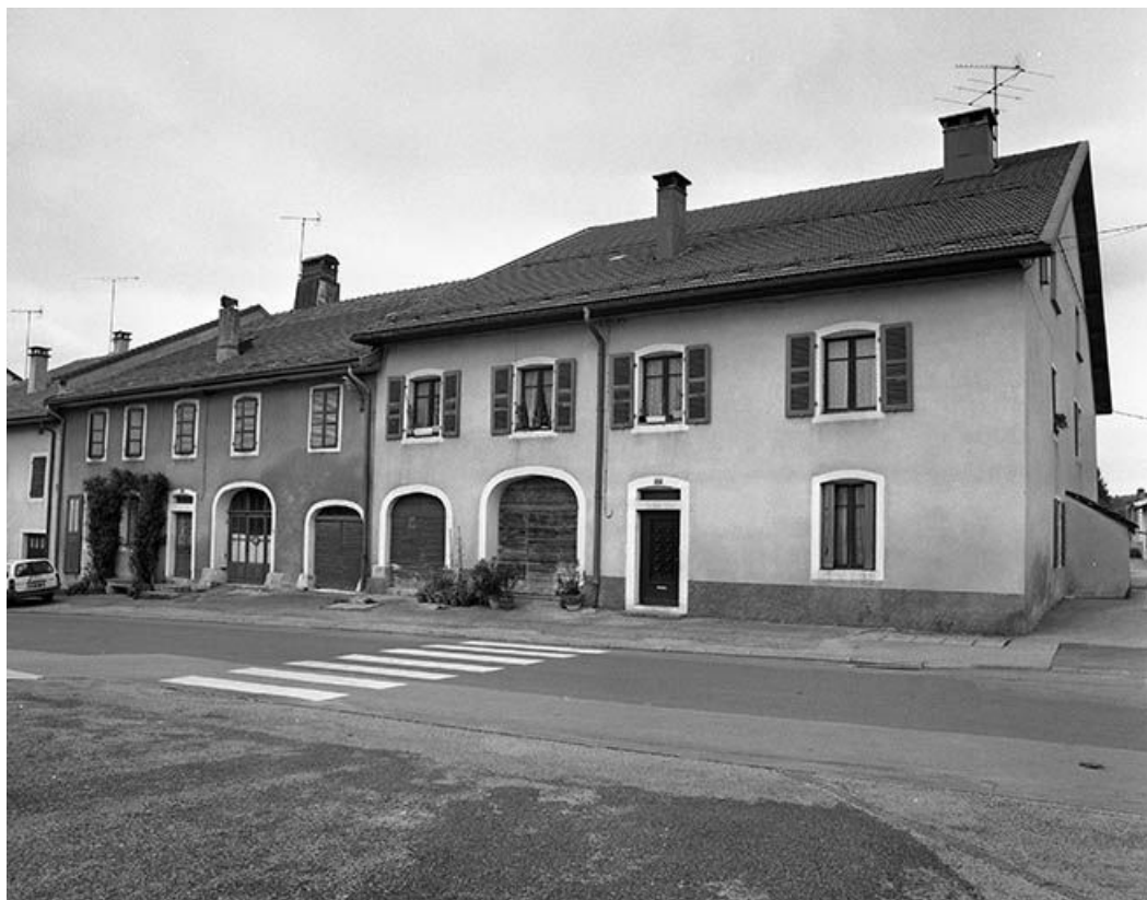
Façade antérieure d'une ferme de village.