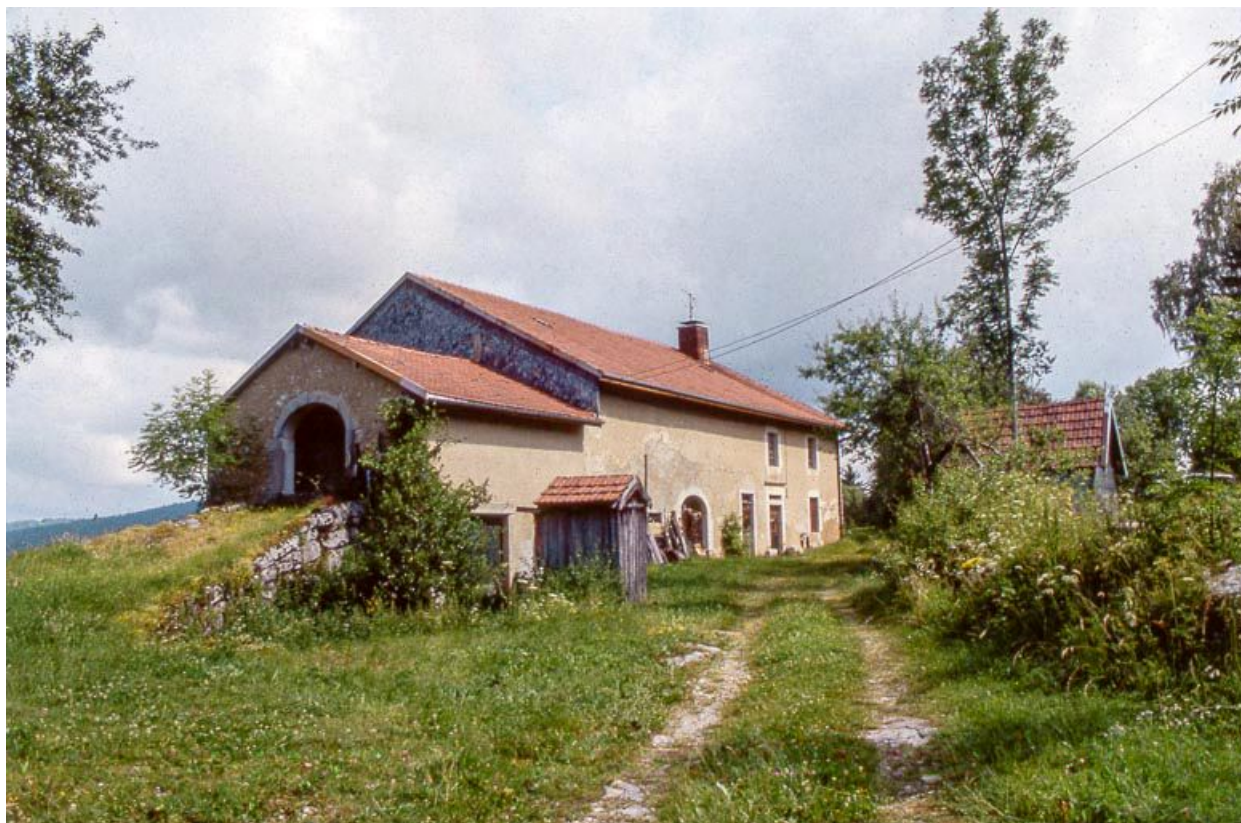
Vue éloignée de la façade antérieure.