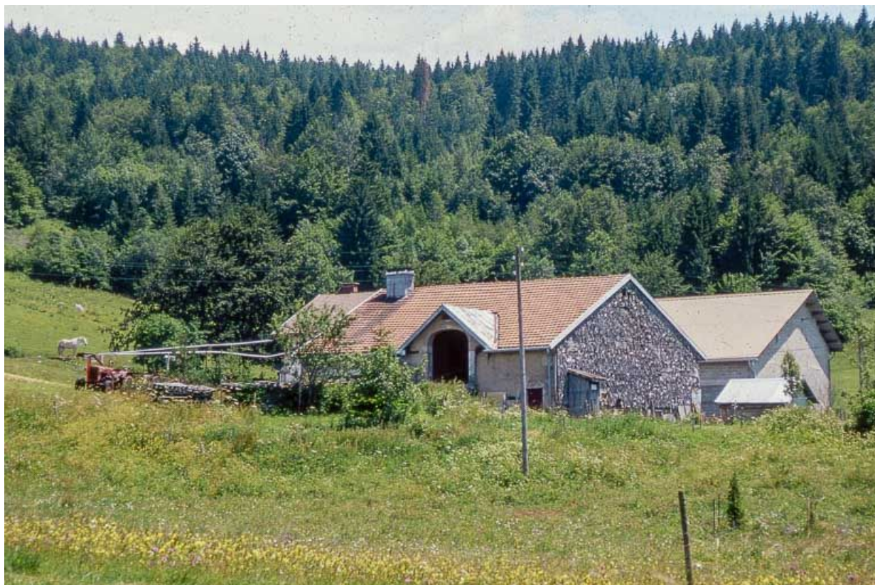
Lucarne à pignon permettant l'accès à la grange haute. 39, Longchaumois