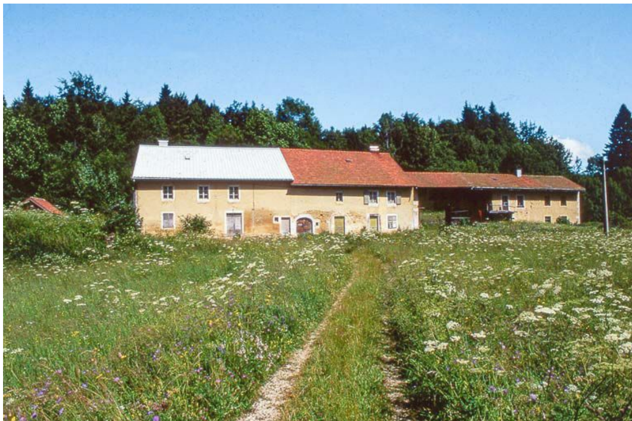
Ensemble de fermes mitoyennes dans la combe des Repentys.