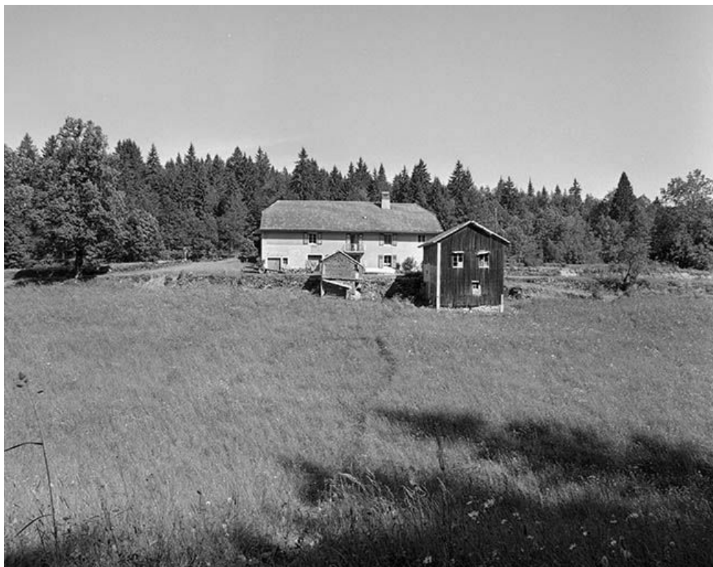
Façade antérieure, vue éloignée.