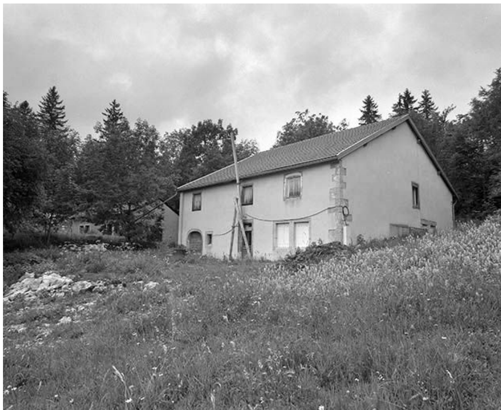
Vue de trois quarts de la façade antérieure et de la face droite.