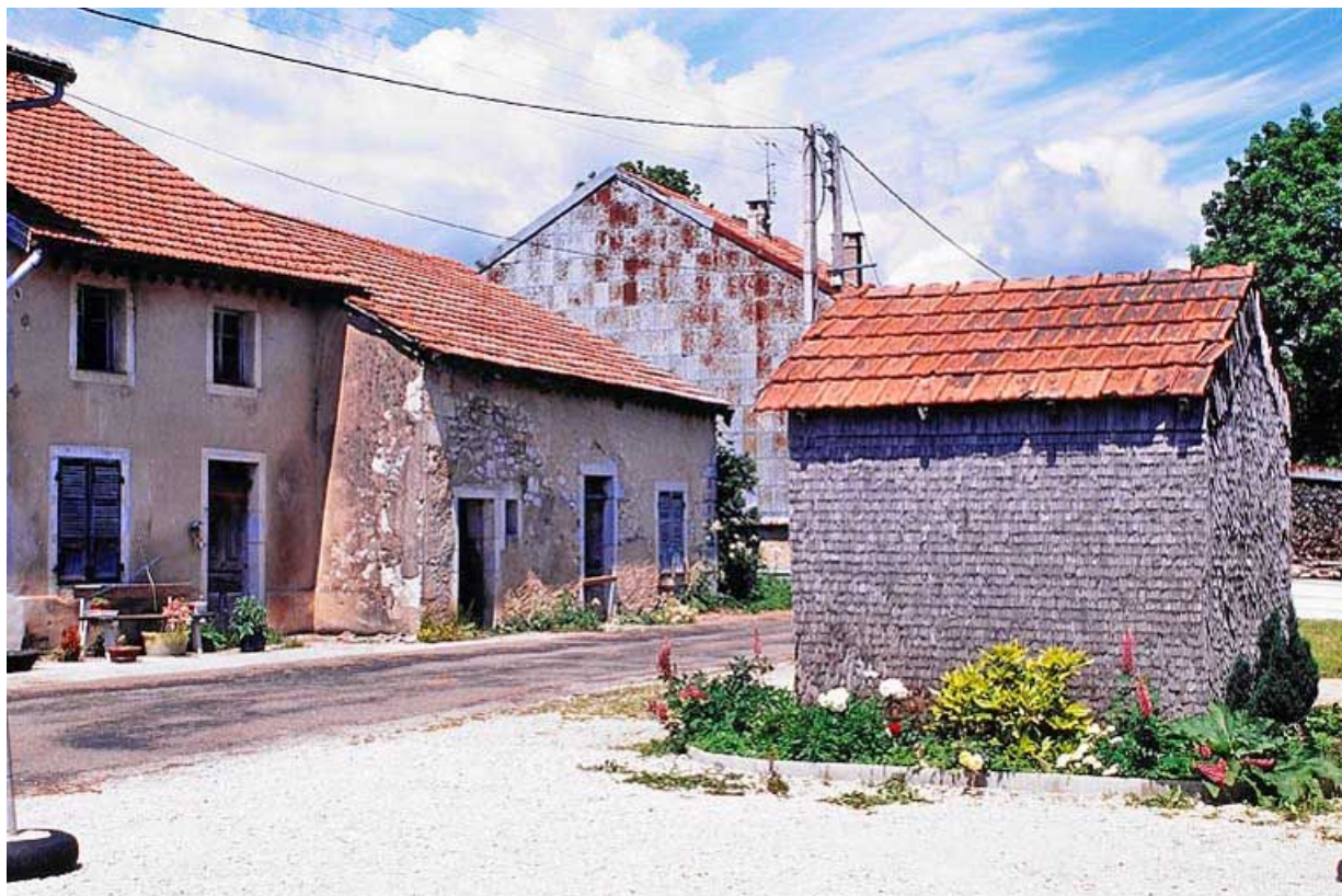
Vue de trois quarts de la façade antérieure et, au premier plan, la resserre. 39, Longchaumois