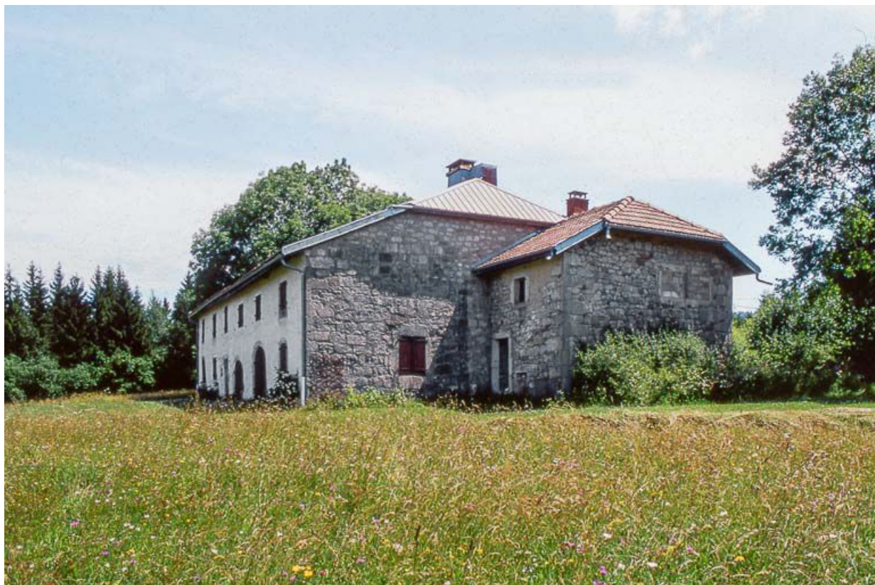
Ferme au hameau de Beauregard.