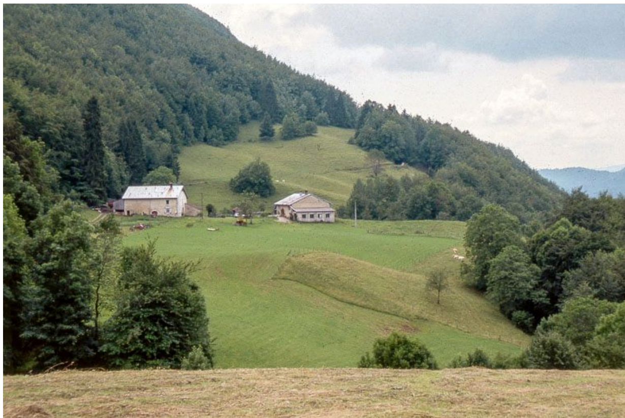
Vue éloignée depuis le nord-est.