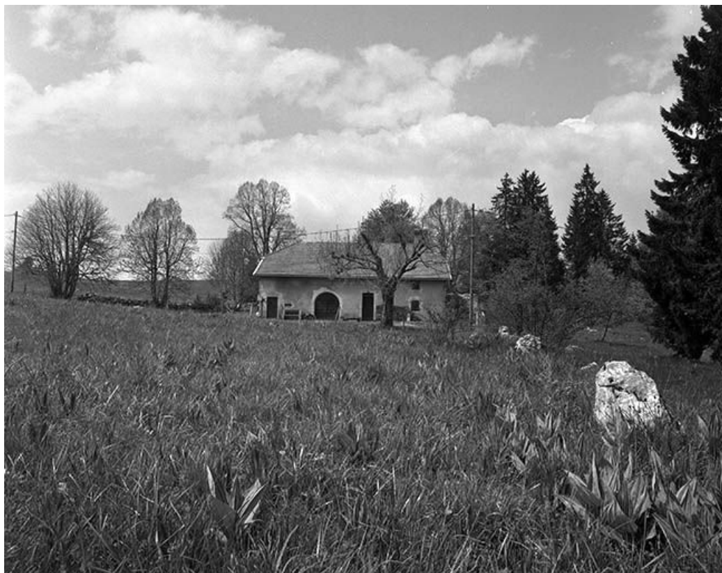
Vue éloignée de la ferme dans le site.