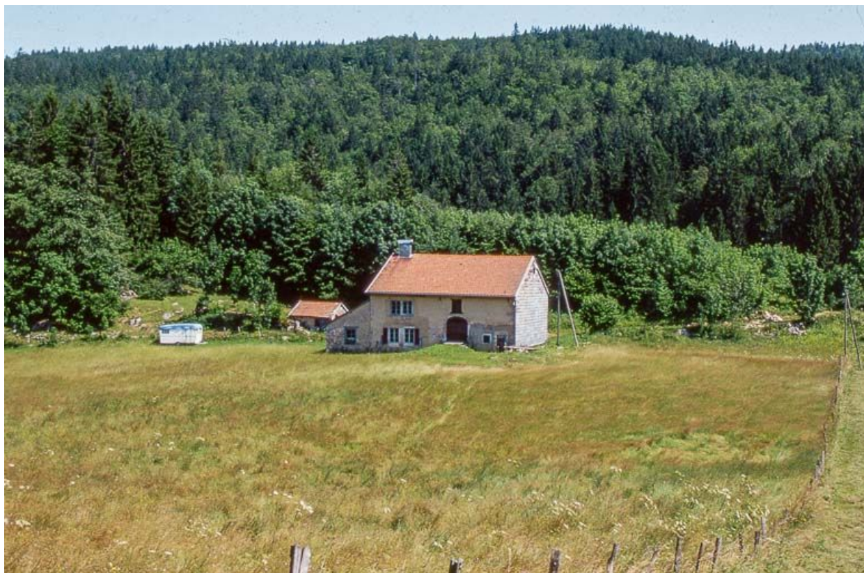
Vue éloignée de la façade postérieure.