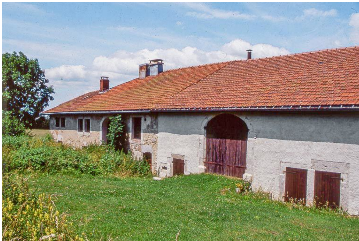
Ferme au hameau de Beauregard, façade postérieure. 39, Longchaumois