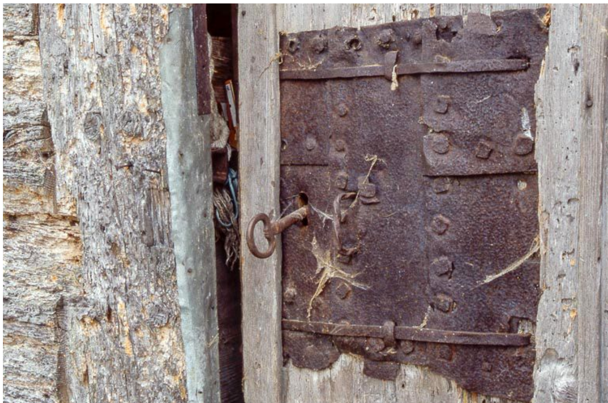
Clef et serrure de la porte du grenier fort.