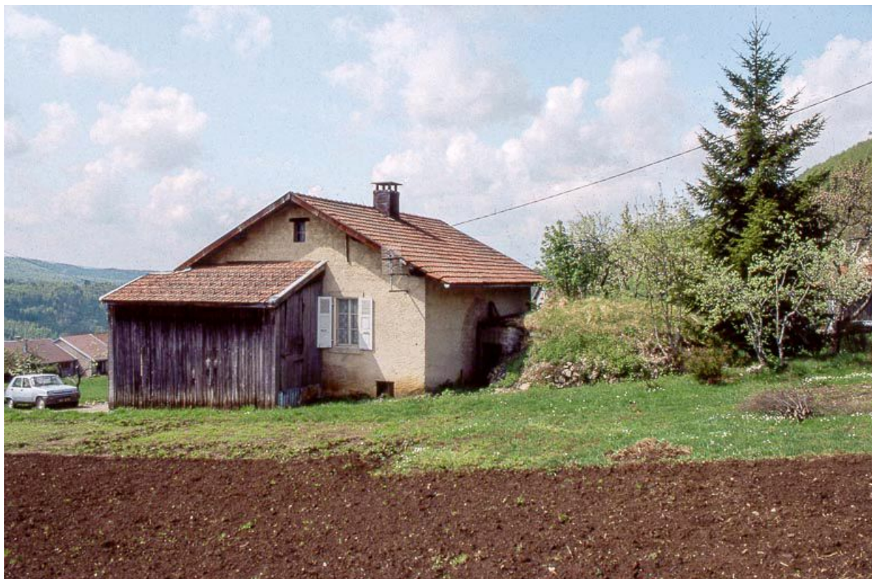
Façade postérieure et face droite.