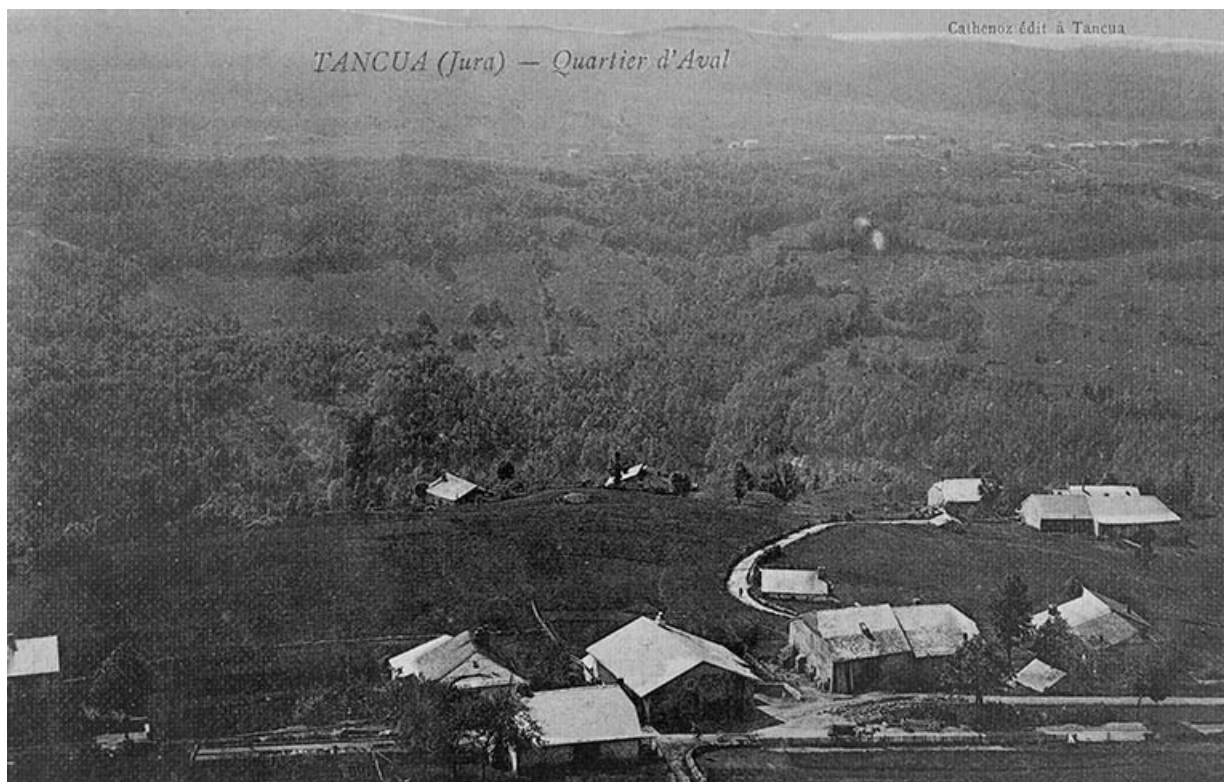
Tancua (Jura) - Quartier d'Aval.