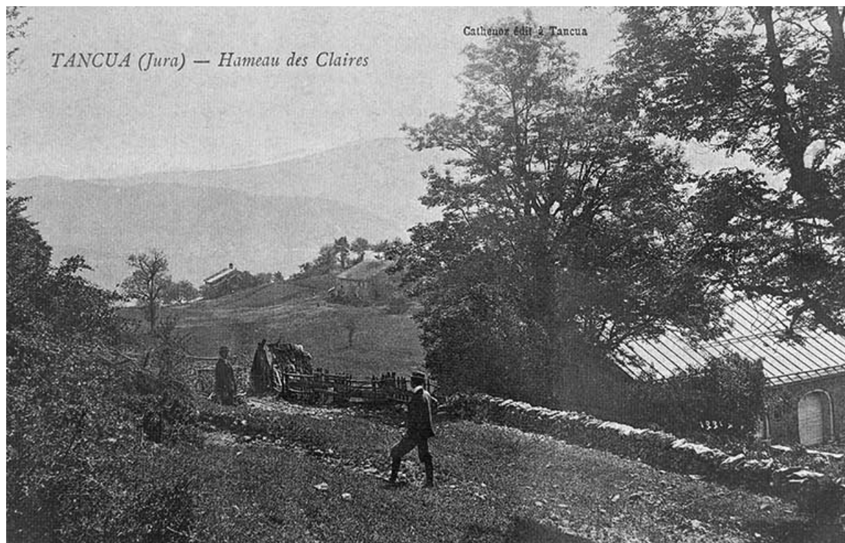
Tancua (Jura) - Hameau des Claires.