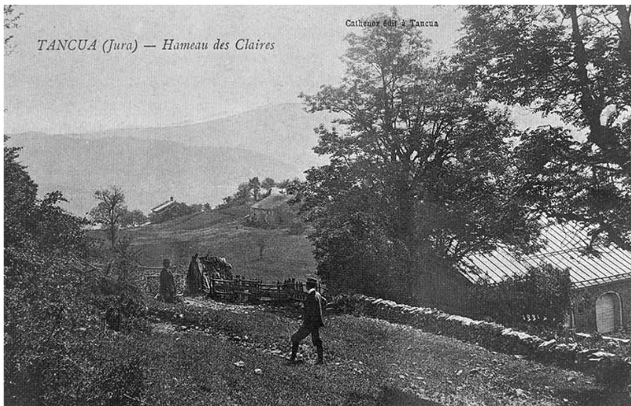
Tancua (Jura) - Hameau des Claires.