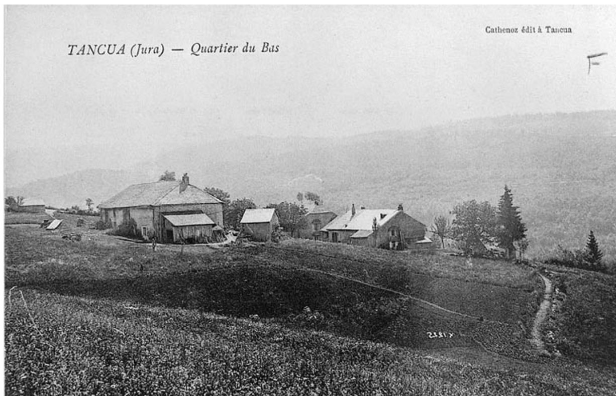
Tancua (Jura) - Quartier du Bas.