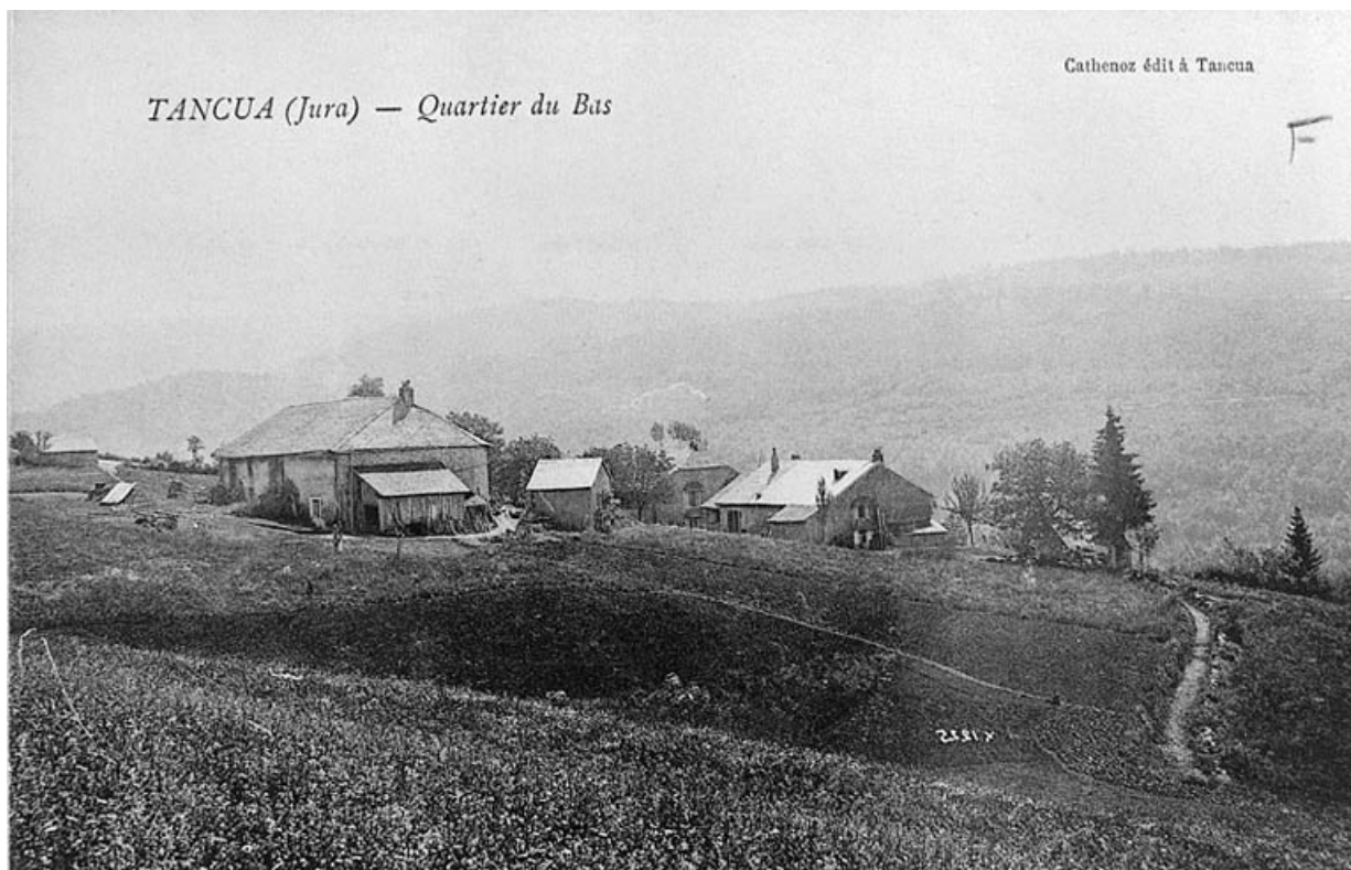
Tancua (Jura) - Quartier du Bas.