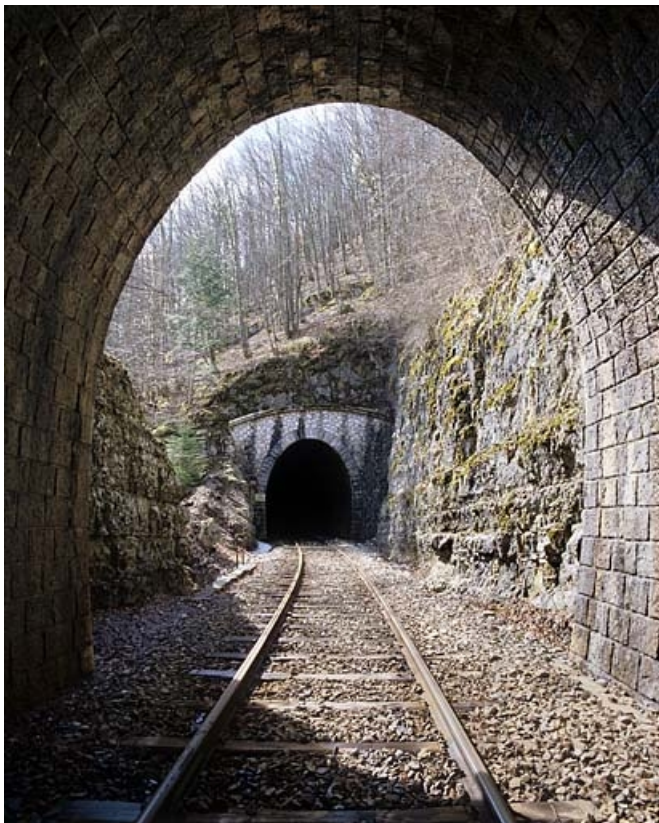
Tunnel du Grépillon : vue d'ensemble côté Andelot-en-Montagne (nord), depuis l'intérieur du tunnel de la Pointe. 65, Tancua