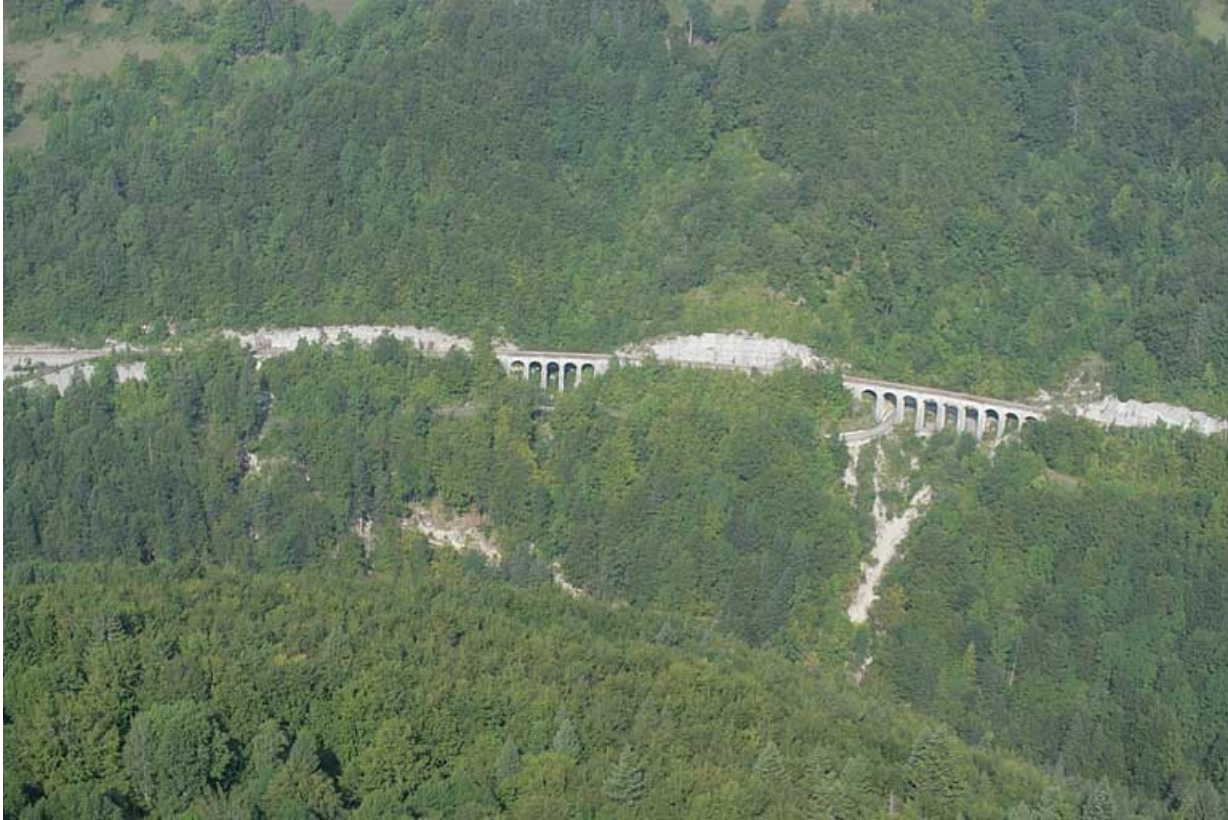
Vue aérienne des deux viaducs, depuis le sud-est. 65, Tancua