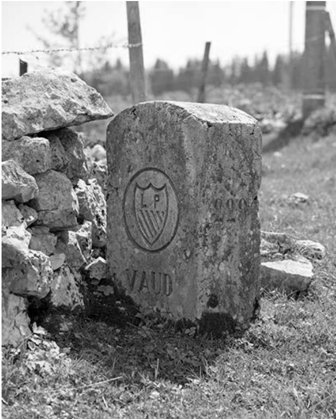
Armoirie du canton de Vaud portée sur une des faces.

39, Les Rousses, lieudit : la Pile dessus