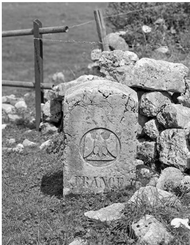
Armoiries de l'Empire français portées sur une des faces.

39, Les Rousses, lieudit : la Pile dessus