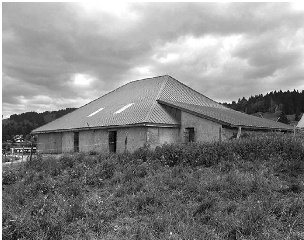
Façade postérieure vue de trois quarts droit.

39, Les Rousses, lieudit : la Pile dessous