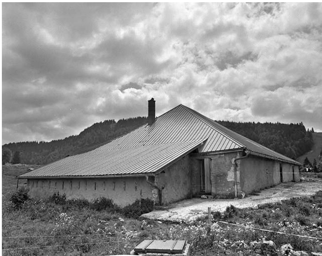
Façade postérieure vue de trois quarts gauche.

39, Les Rousses, lieudit : la Pile dessous