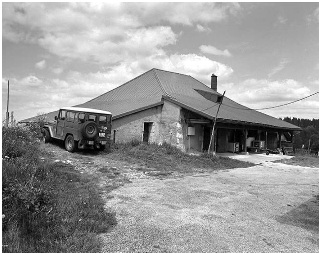
Façade antérieure vue de trois quarts gauche.

39, Les Rousses, lieudit : la Pile dessous