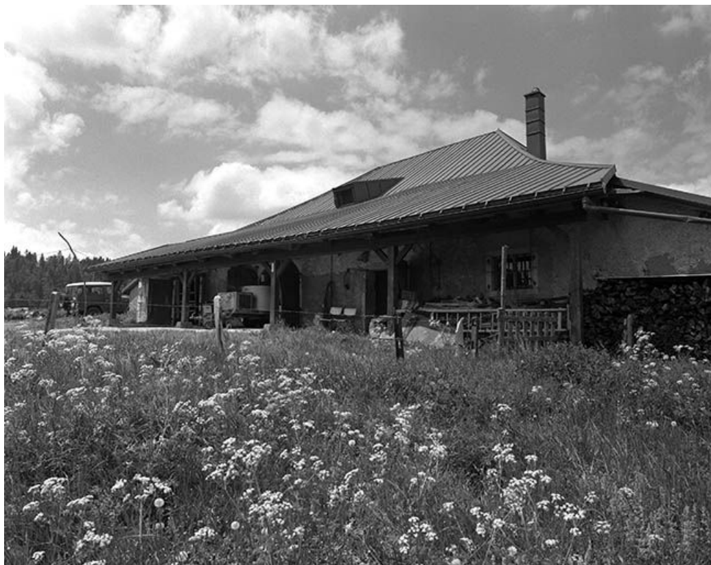
Façade antérieure vue de trois quarts droit.

39, Les Rousses, lieudit : la Pile dessous