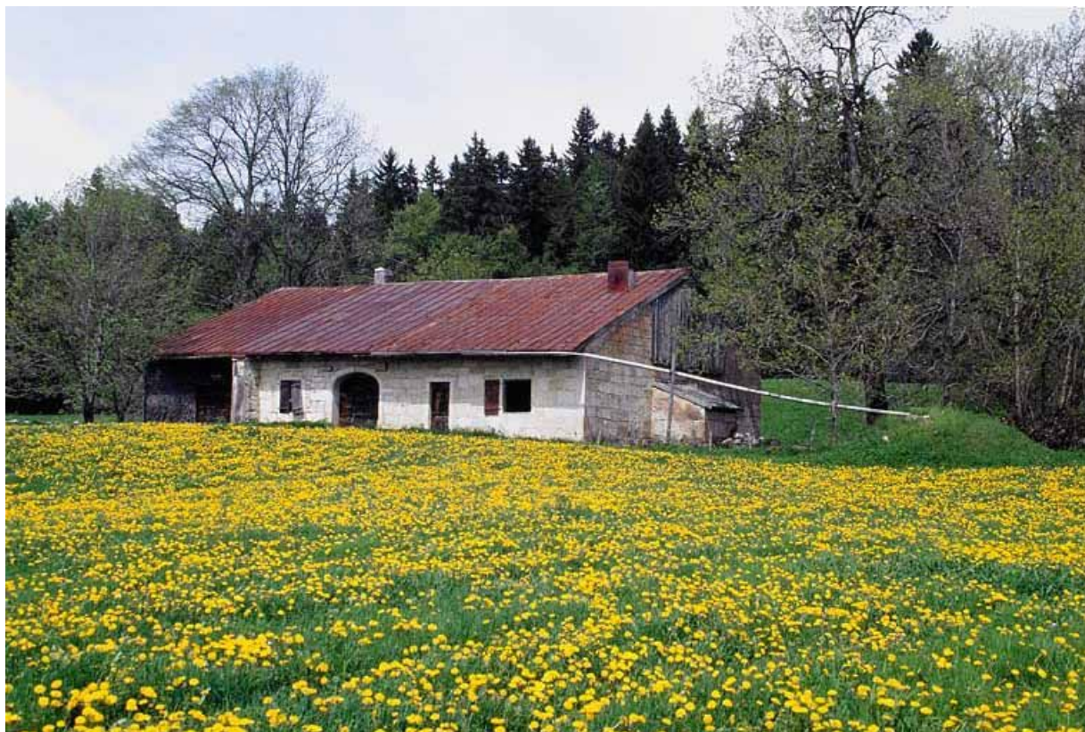
Façade antérieure et face droite vues de trois quarts.

39, Les Rousses, lieudit : Ferme du Commandant