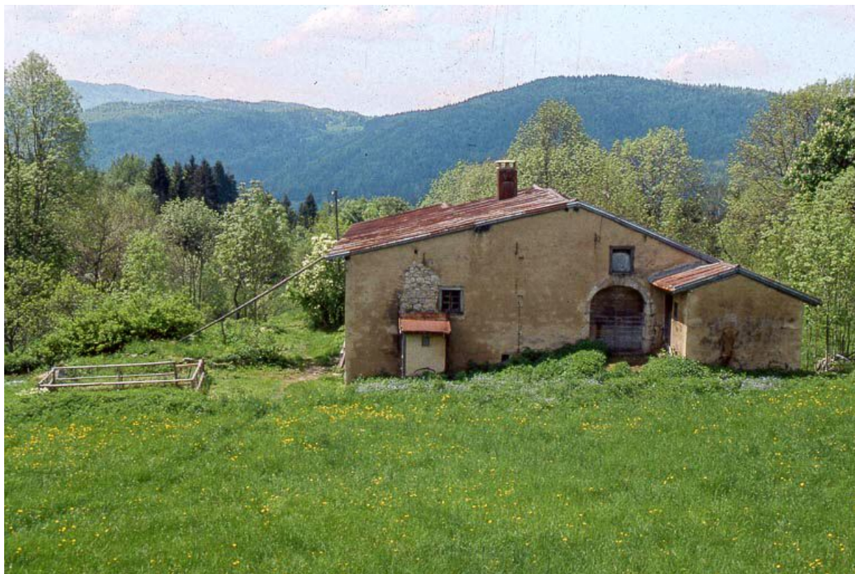
Face gauche et accès à la grange haute.