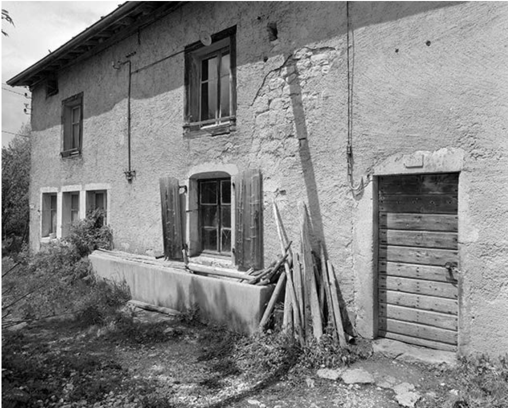
Façade antérieure, vue vers l'atelier dans le prolongement du logis.