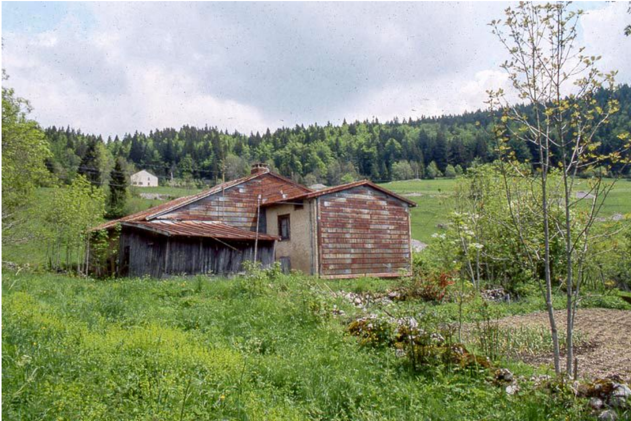
Face latérale droite.