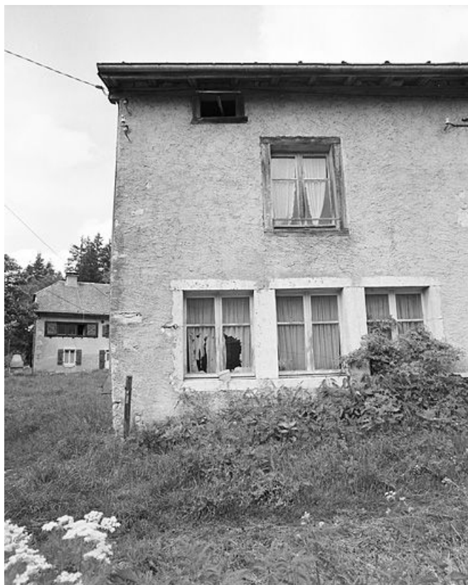
Les fenêtres de l'atelier.