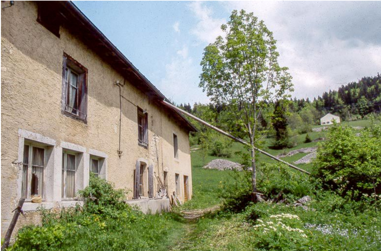
Façade antérieure de trois quarts, descente d'eau vers la citerne.