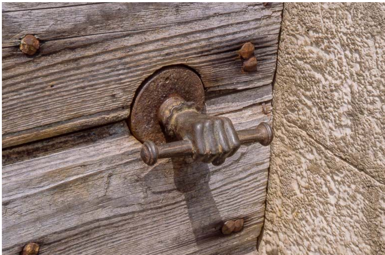
La poignée de la porte d'accès au logis.