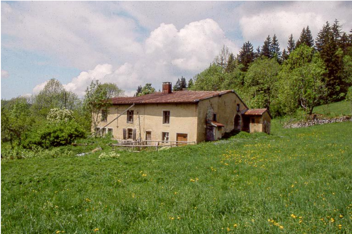
Vue éloignée de la façade antérieure.