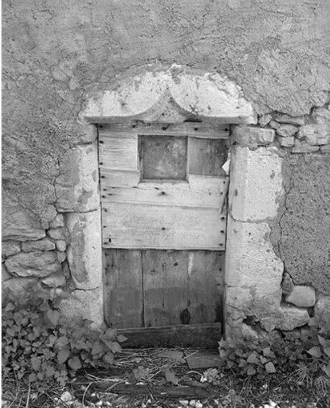
Linteau en accolade sur la façade postérieure.