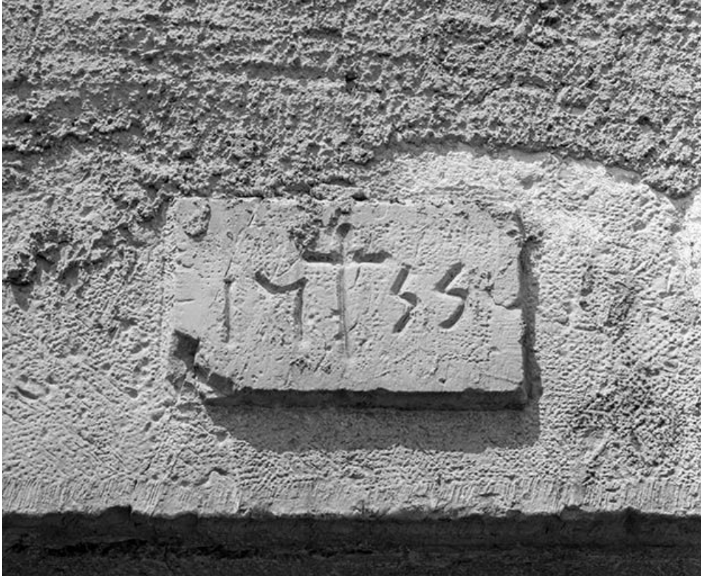
Date portée sur le linteau de la porte d'accès au logis.