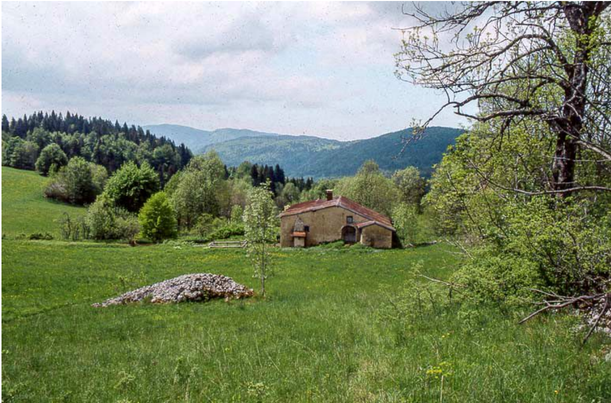
Vue éloignée de la face droite.