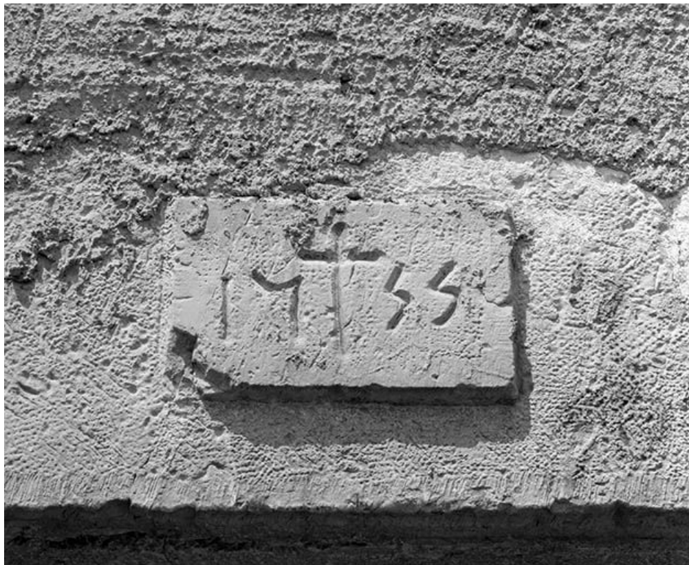
Date portée sur le linteau de la porte d'accès au logis.