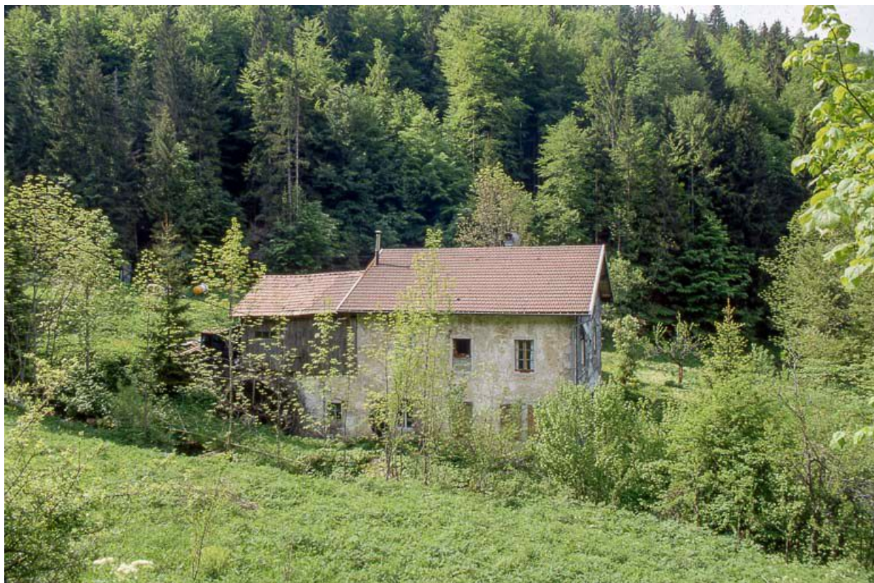
Façade postérieure, vue éloignée.

39, Les Rousses Bief Bruyant 514, lieudit : sous les Barres