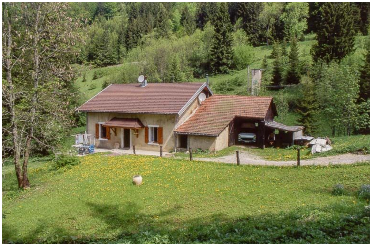
Vue éloignée du bâtiment dans le site, façade antérieure.

39, Les Rousses Bief Bruyant 514, lieudit : sous les Barres