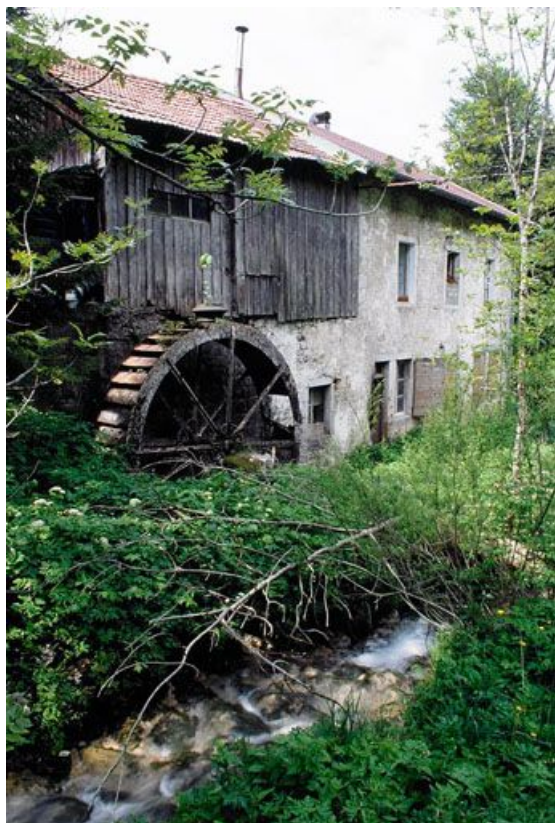
Façade postérieure, roue et bief Bruyant.

39, Les Rousses Bief Bruyant 514, lieudit : sous les Barres