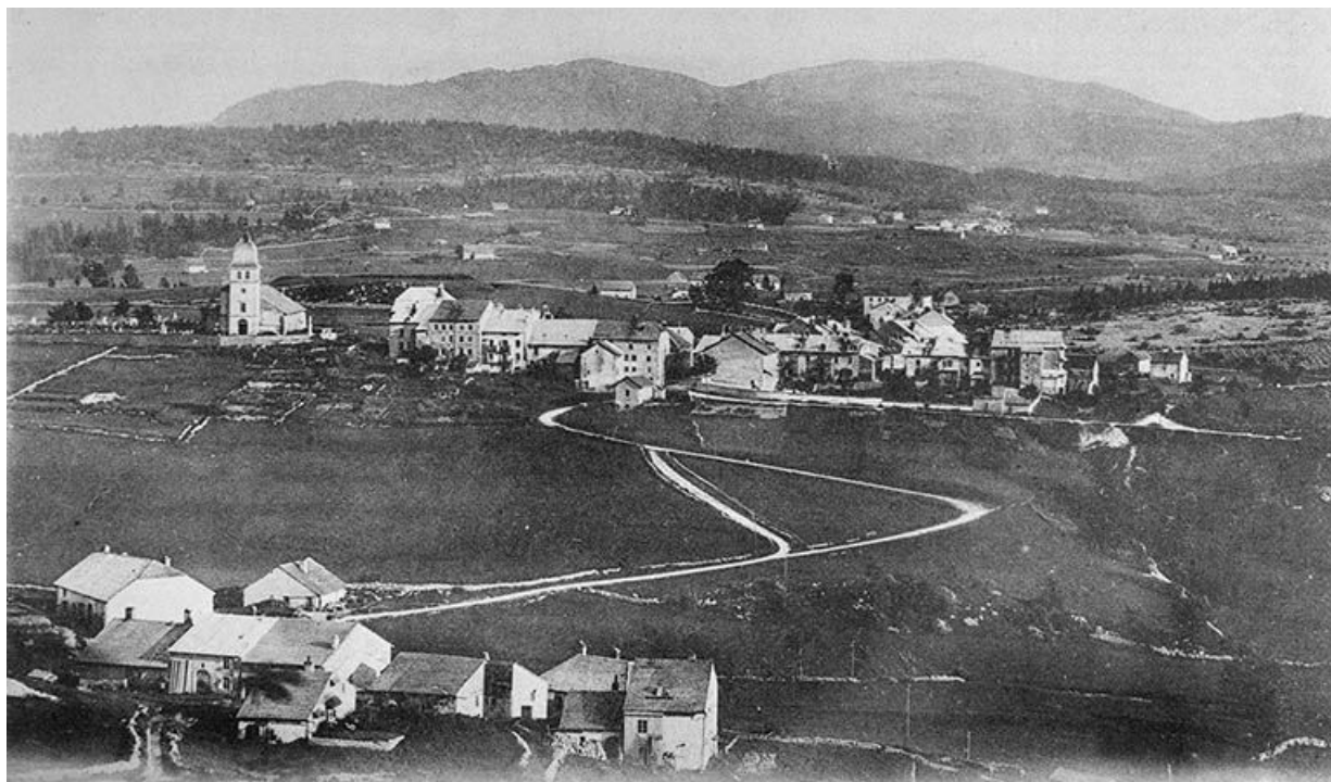
Les Rousses et la Dôle, altitude 1680 mètres.