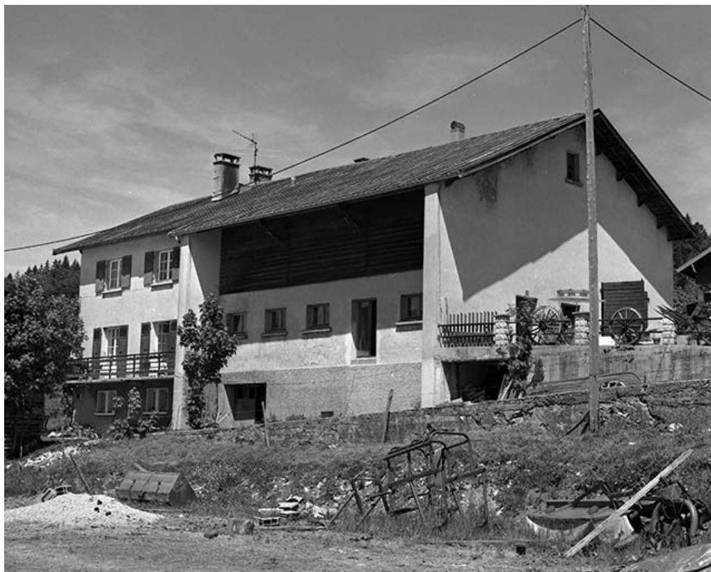
Façade postérieure d'une ferme datant de la reconstruction, vue de trois quarts. 39, Les Rousses