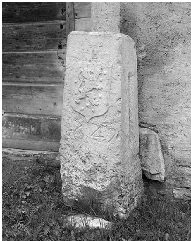
Borne frontière de 1649.