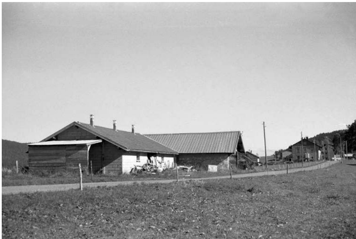
Vue d'ensemble, depuis le sud. Porcherie au premier plan.