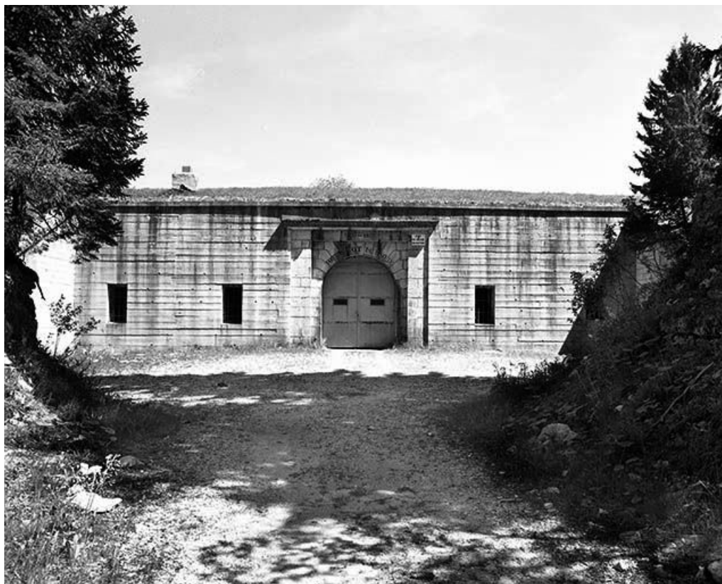
Façade antérieure, vue éloignée.