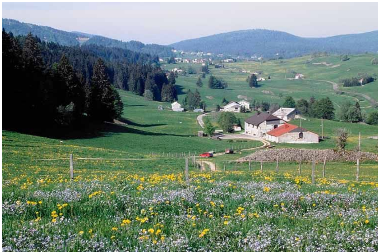
Paysage de combe sur la commune des Rousses.