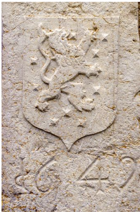
Détail des armoiries.