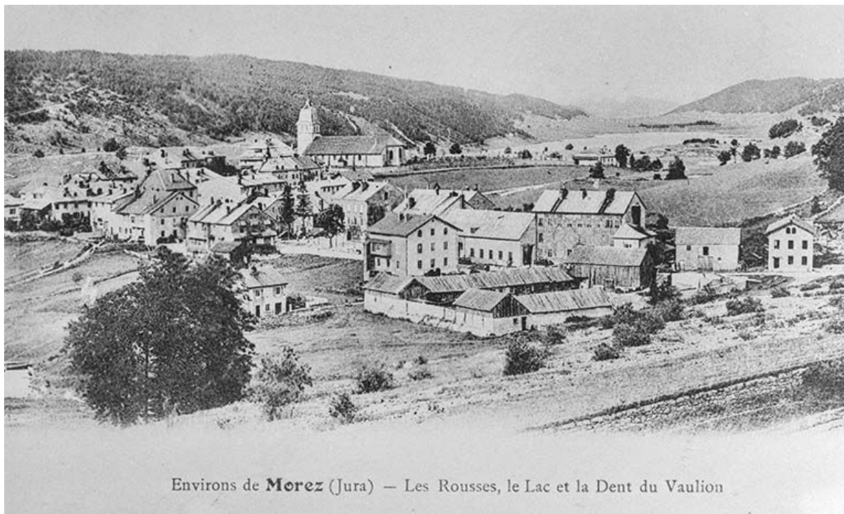
Environs de Morez (Jura) — Les Rousses, le Lac et la Dent du Vaillon

Environs de Morez (Jura) - les Rousses, le Lac et la Dent du Vaillon.