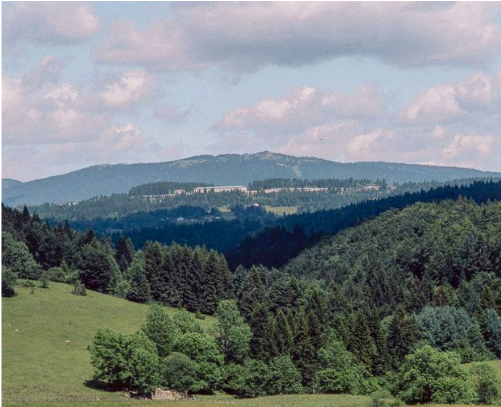
Vue du fort depuis le hameau des Arcets.