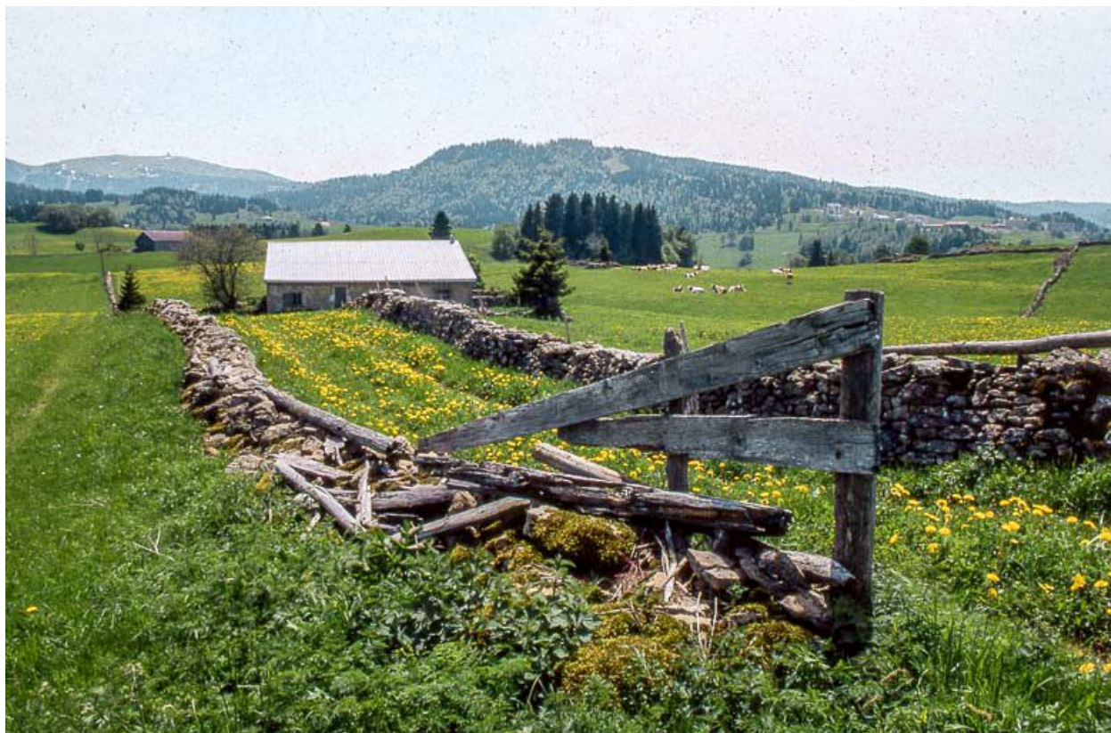
Vue éloignée d'une ferme et du chemin menant des bêtes à la pâture. 39, Les Rousses