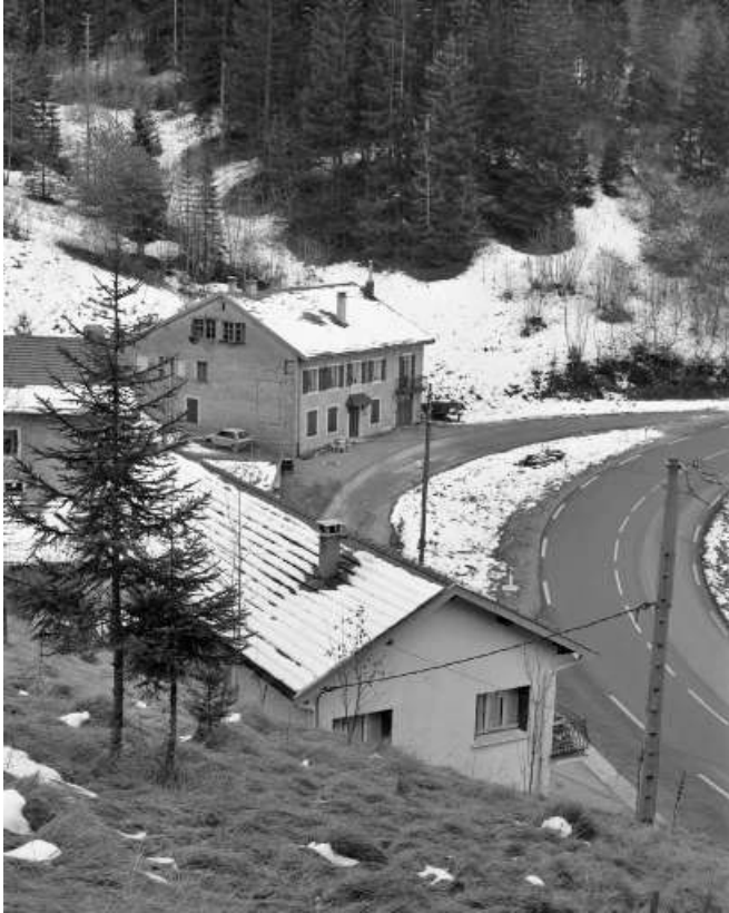
Vue d'ensemble plongeante, depuis le nord.

39, Les Rousses, lieudit : sous les Barres