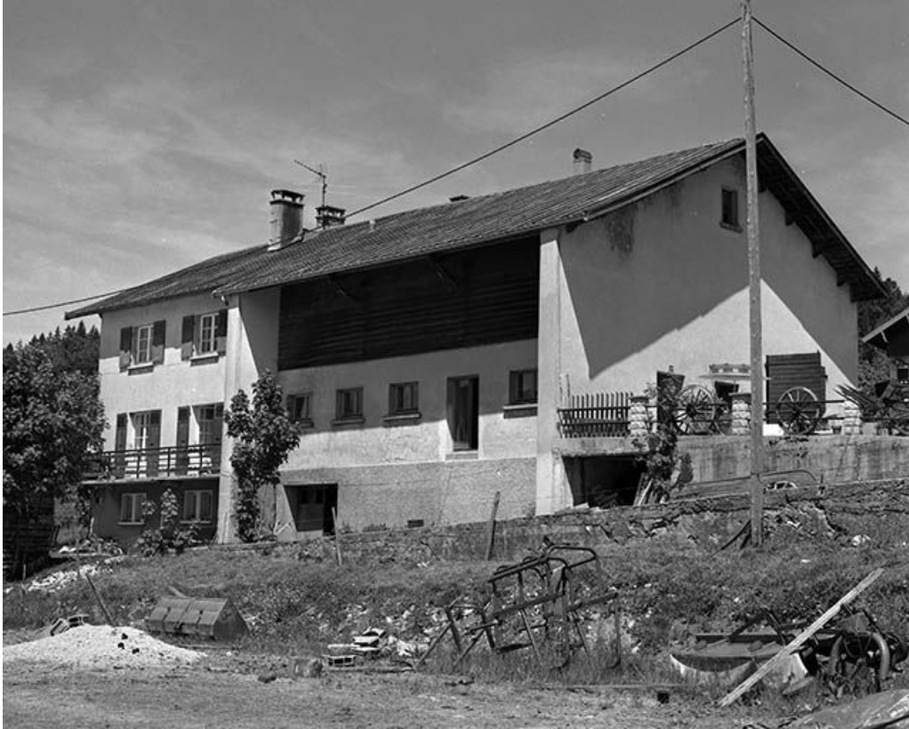
Façade postérieure d'une ferme datant de la reconstruction, vue de trois quarts. 39, Les Rousses