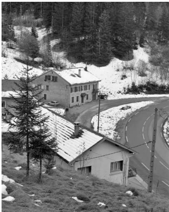
Vue d'ensemble plongeante, depuis le nord.

39, Les Rousses, lieudit : sous les Barres