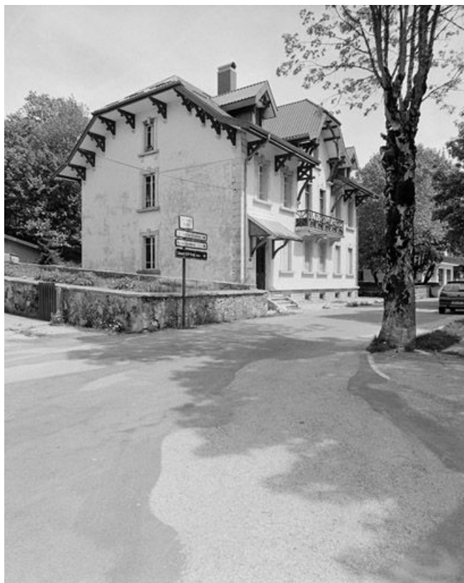
Façade antérieure et face gauche vues de trois quarts.