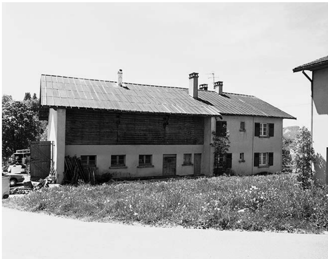
Vue générale d'une ferme reconstruite après guerre.