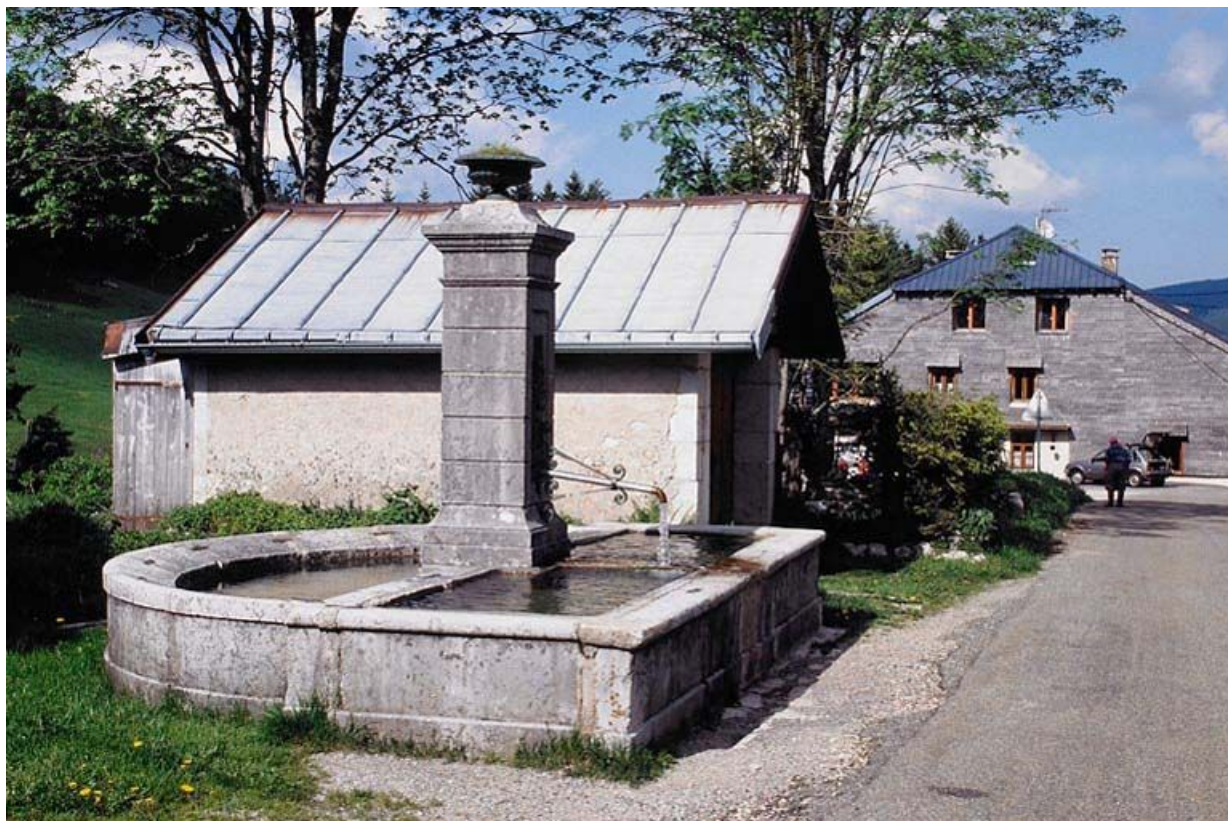
Vue générale de la fontaine.

39, Les Rousses, lieudit : les Rousses d'Amont