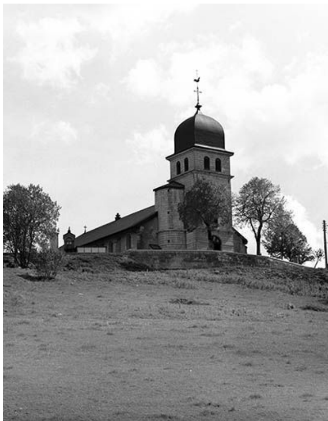
Vue éloignée du clocher porche depuis les Rousses en Bas.