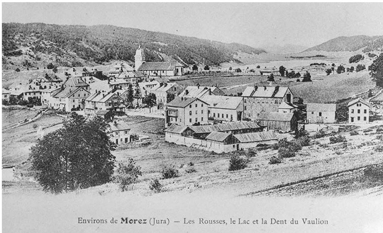
Environs de Morez (Jura) - les Rousses, le Lac et la Dent du Vaulion. 39, Les Rousses

Carte postale, 1er quart 20e siècle. Lieu de conservation : collection particulière