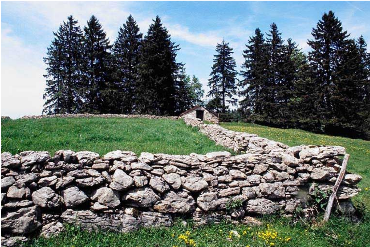
Etable à vaches et murets de pâture.