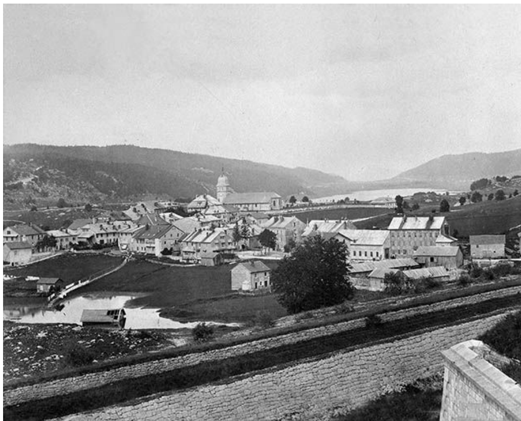
Vue d'ensemble depuis le fort, avant 1888.