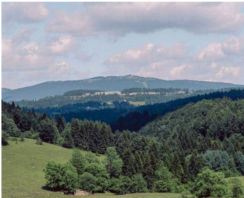
Vue du fort depuis le hameau des Arcets.