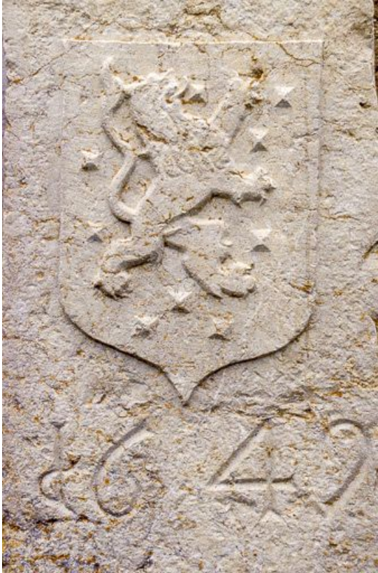
Détail des armoiries.