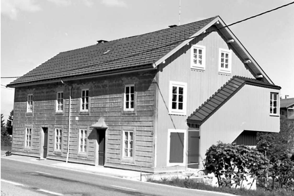
Vue de situation de l'édifice dans la rue.

39, Les Rousses, 501, 509 route du Noirmont