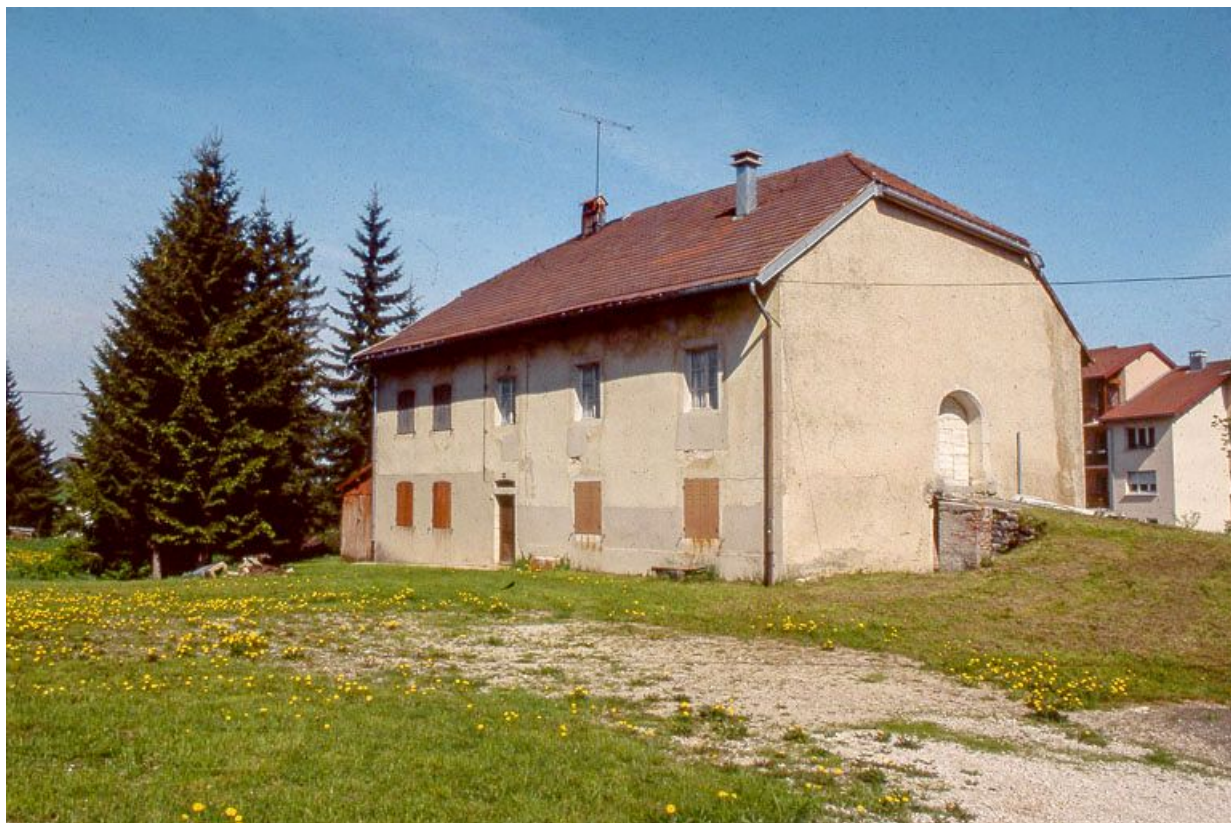
Façade antérieure et face droite.