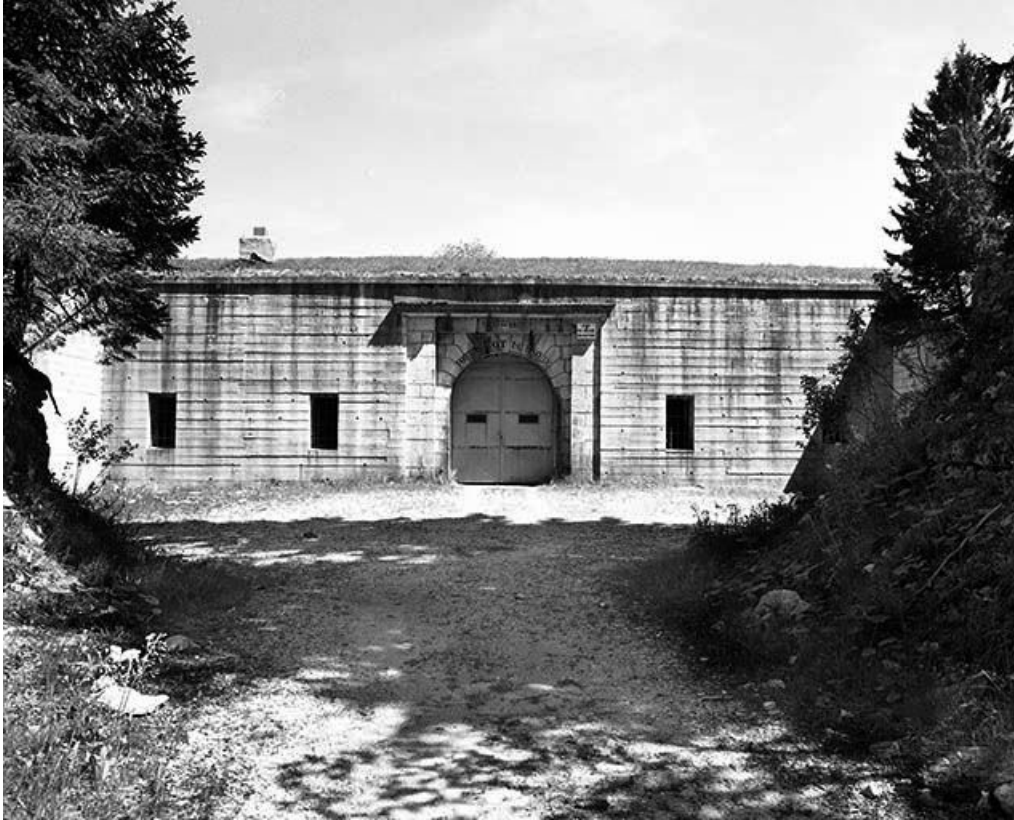
Façade antérieure, vue éloignée.

39, Les Rousses, lieudit : la Combe du vert