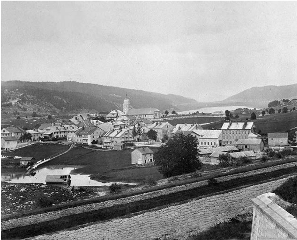
Vue d'ensemble depuis le fort, avant 1888.