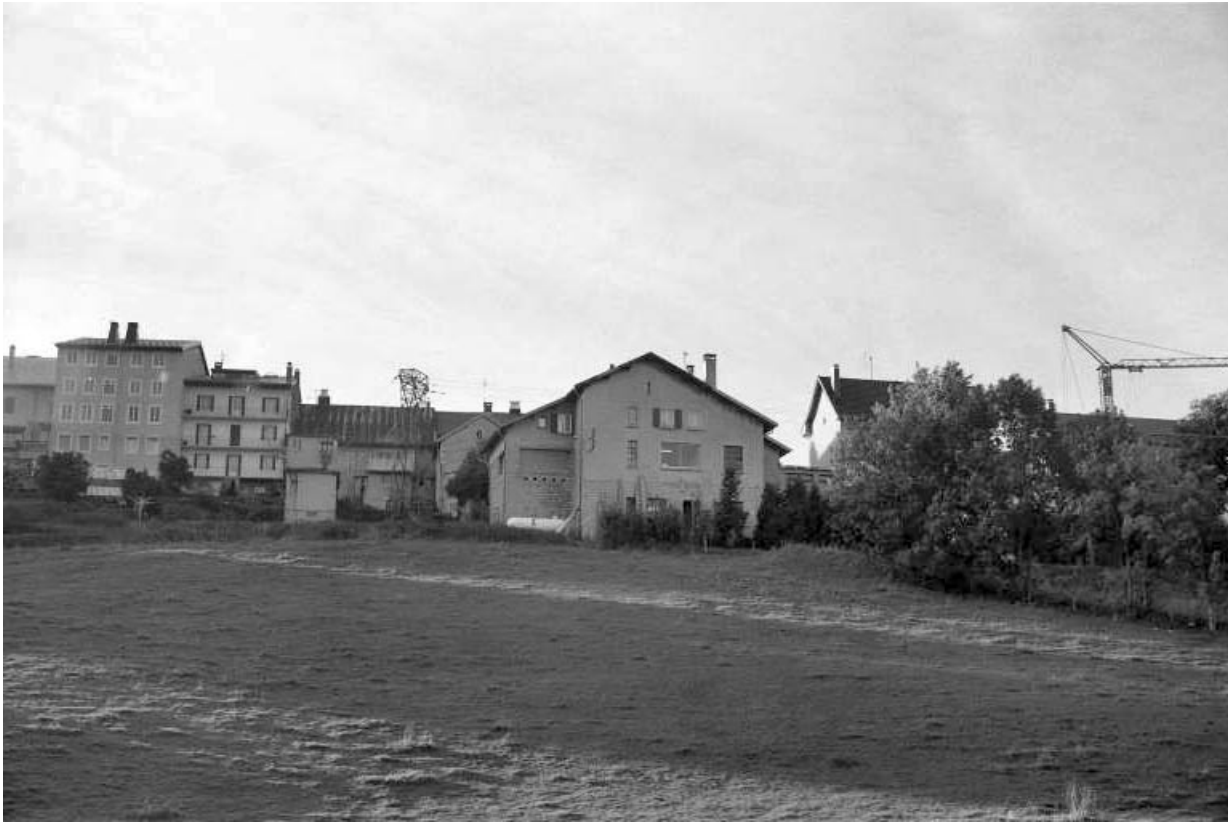
Vue d'ensemble : façade postérieure.