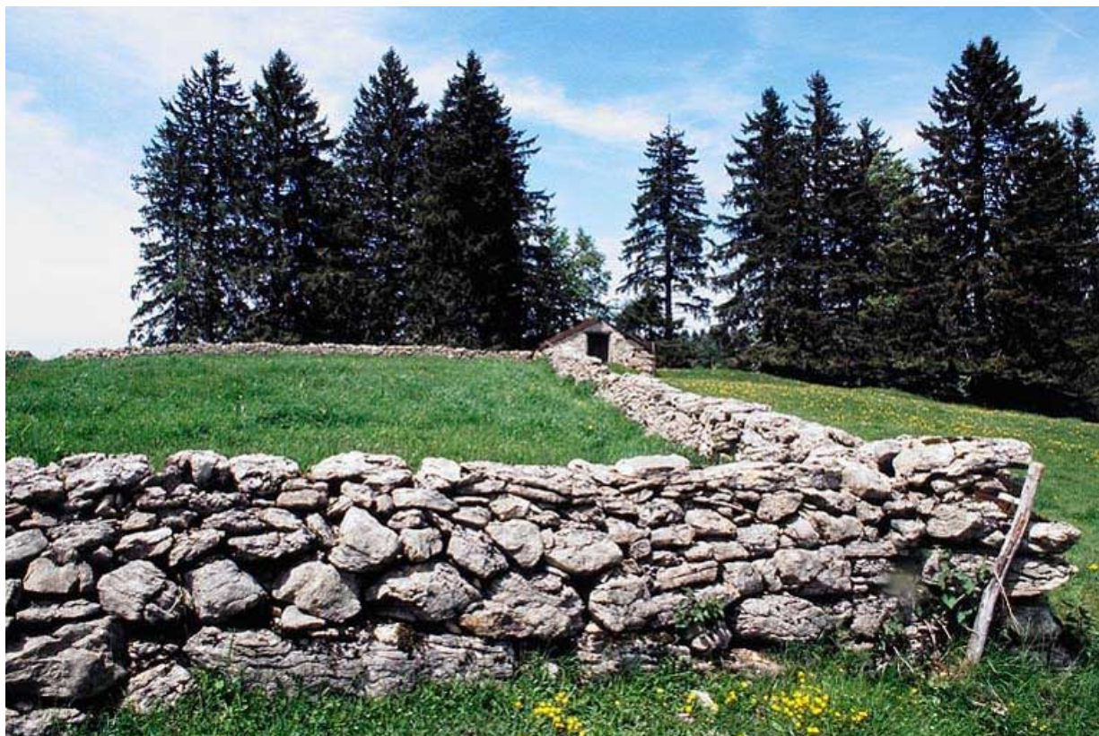
Etable à vaches et murets de pâture.