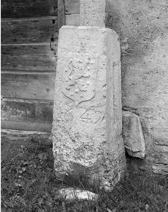
Borne frontalière de 1649.