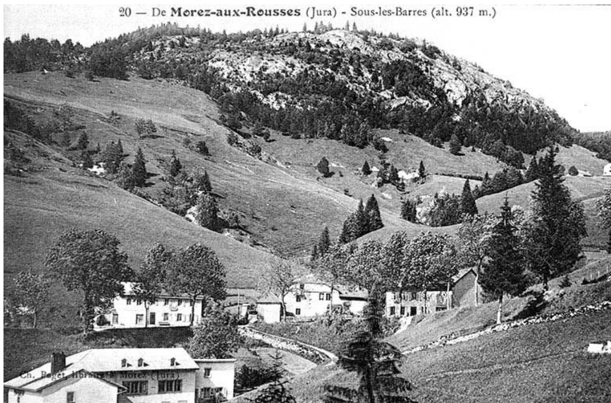
De Morez aux Rousses (Jura) - sous les Barres (alt. 937 m.). 39, Les Rousses