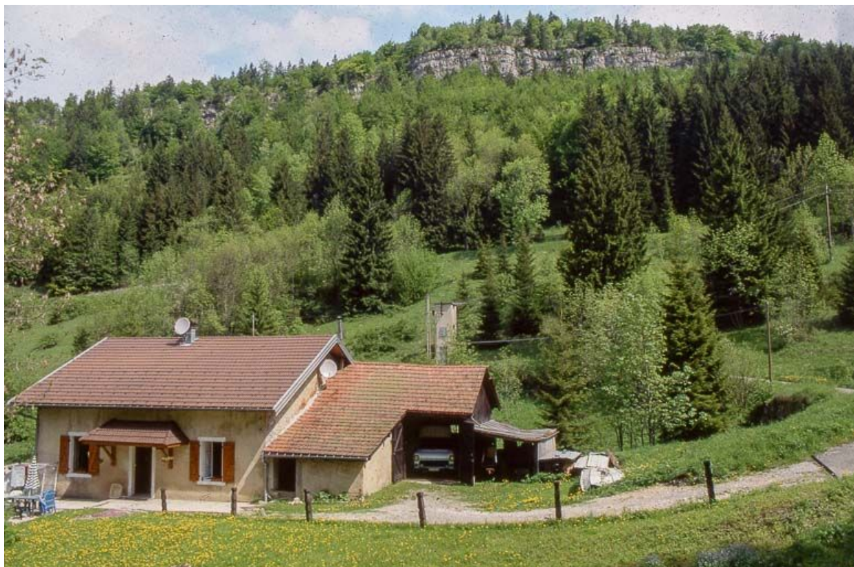
Vue éloignée du bâtiment dans le site, façade antérieure.

39, Les Rousses Bief Bruyant 514, lieudit : sous les Barres