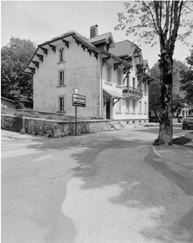
Façade antérieure et face gauche vues de trois quarts.