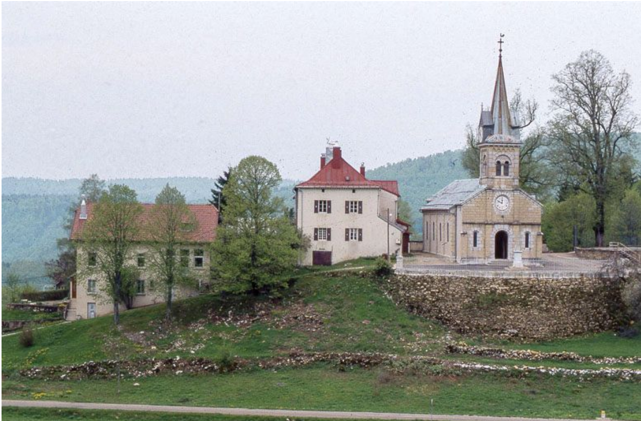
Vue éloignée du presbytère à côté de l'église.