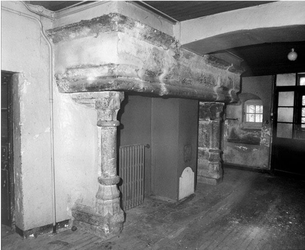
Vue intérieure, cheminée.