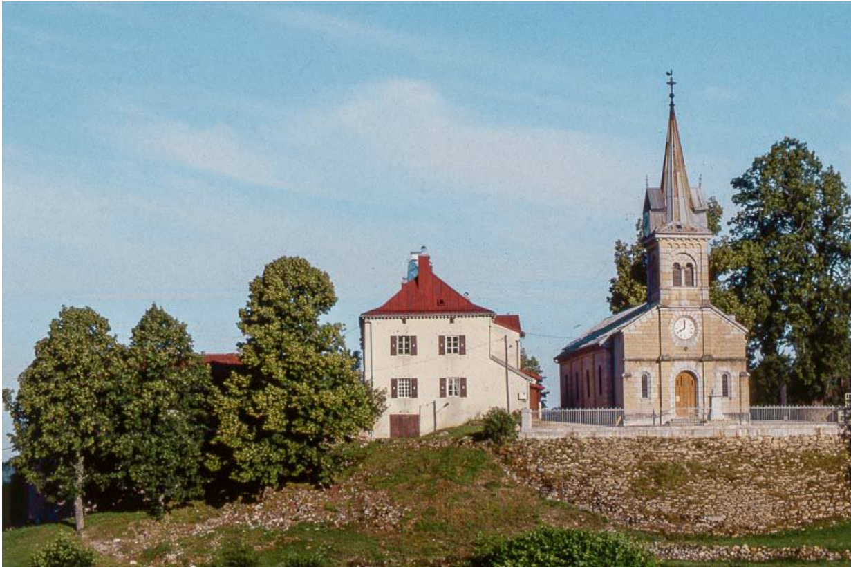
Vue éloignée du presbytère et de l'église.