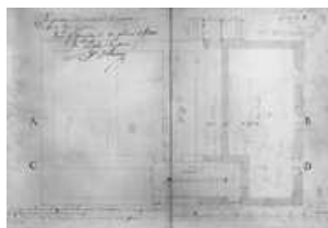
Projet de construction d'une maison d'école : plan du rez-de-chaussée, 1833.