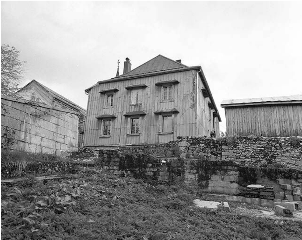
Vue éloignée de la façade ouest.