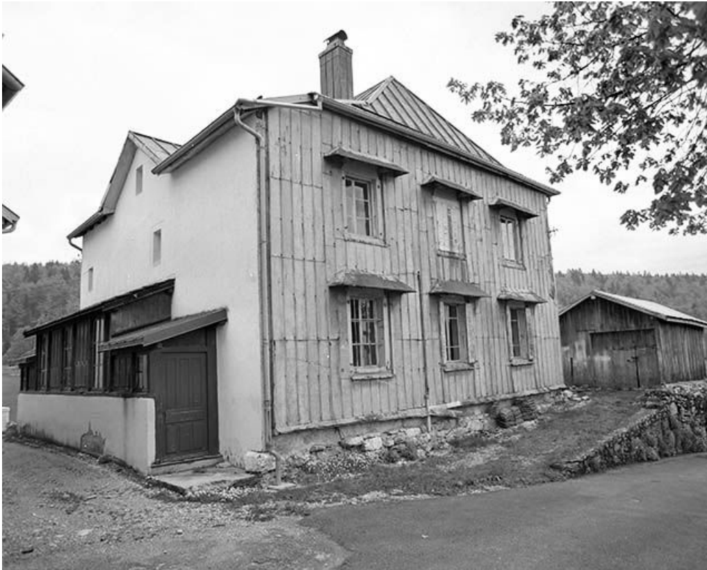
Façades nord et ouest vues de trois quarts.