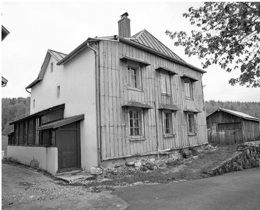
Façades nord et ouest vues de trois quarts.