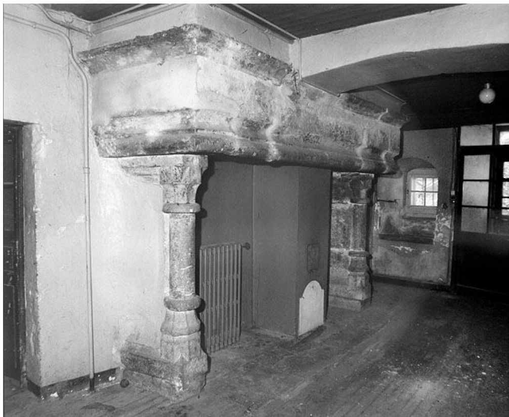
Vue intérieure, cheminée.