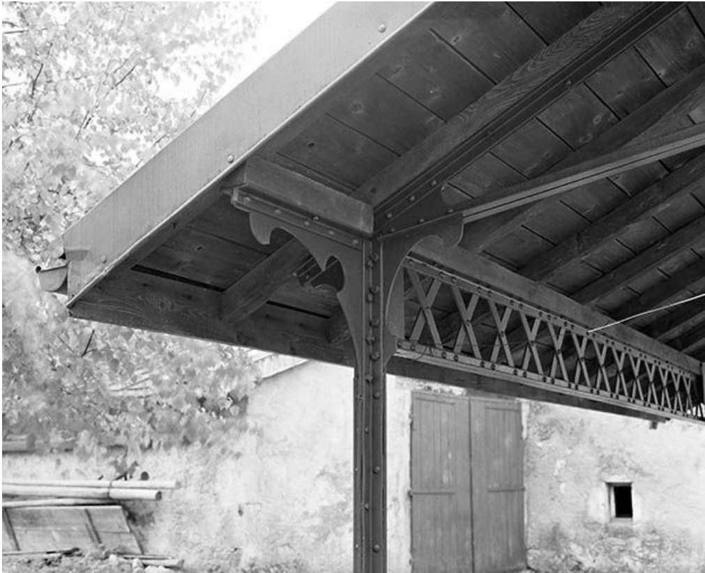
Raccord de la panne sablière et d'un potelet métallique. 39, La Mouille