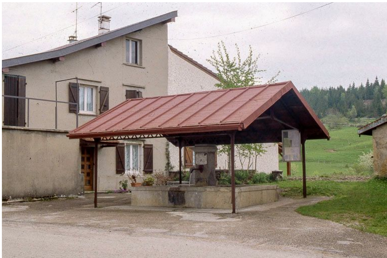
Vue générale d'une fontaine-lavoir.