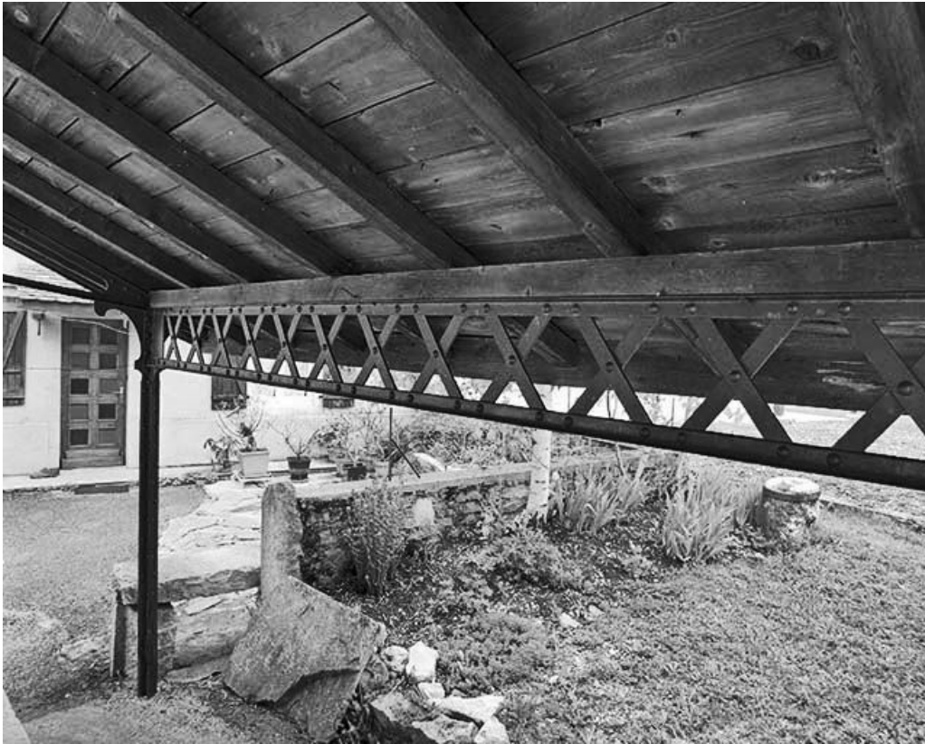
Détail de la panne sablière.