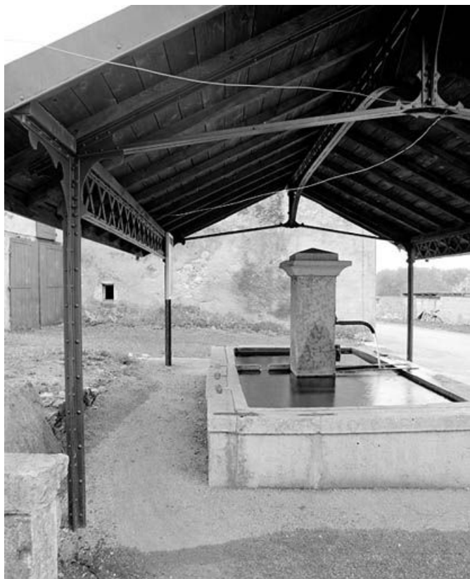
Vue générale du bassin et de la charpente.