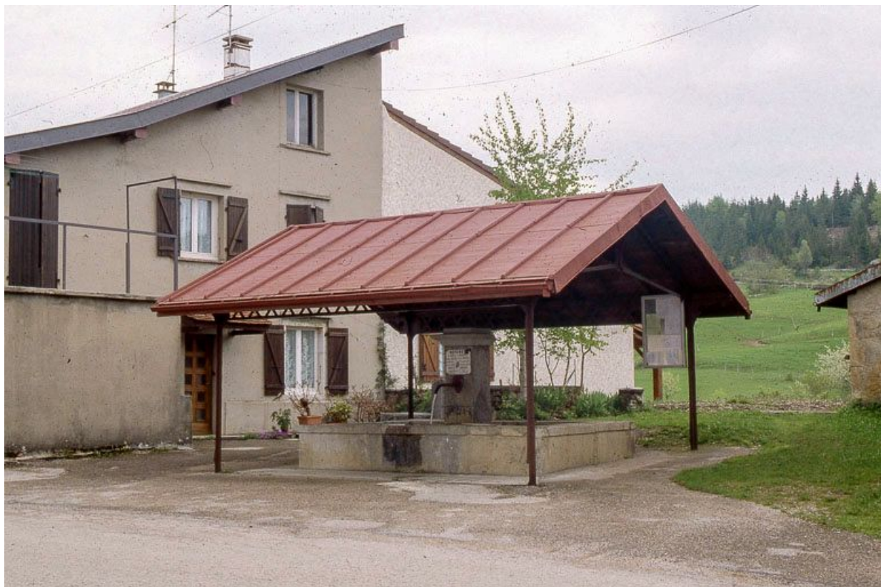
Vue générale d'une fontaine-lavoir.