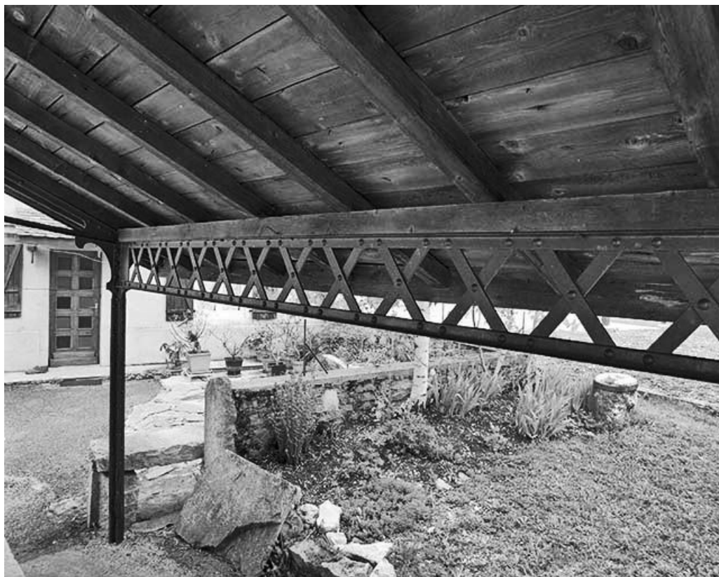
Détail de la panne sablière.