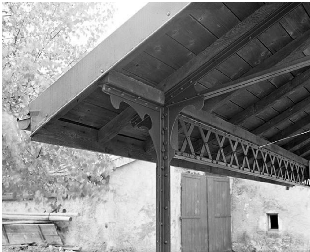
Raccord de la panne sablière et d'un potelet métallique. 39, La Mouille