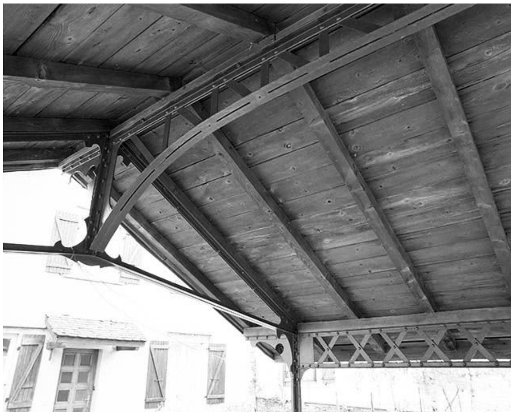
Charpente métallique : faîtage et sablière. 39, La Mouille