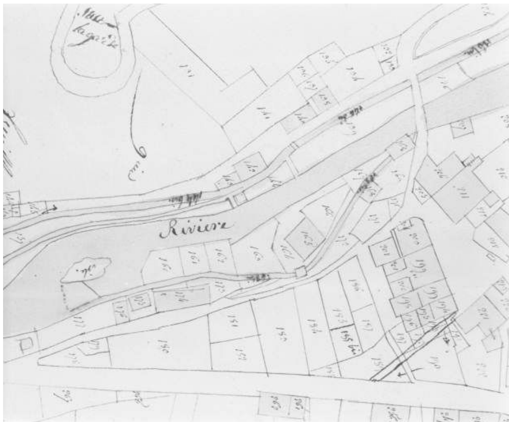
39, Morez, 2 et 4 rue Pierre Morel

Dessin, 1822. Echelle 1:1250, par Tabey (géomètre). Lieu de conservation : Ministère des Finances, Direction des Services fiscaux du Jura, Service du Cadastre, Lons-le-Saunier