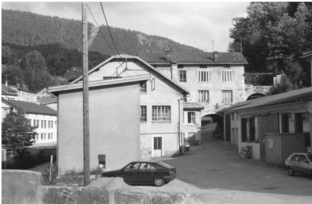
Vue d'ensemble depuis le nord-ouest (aval).