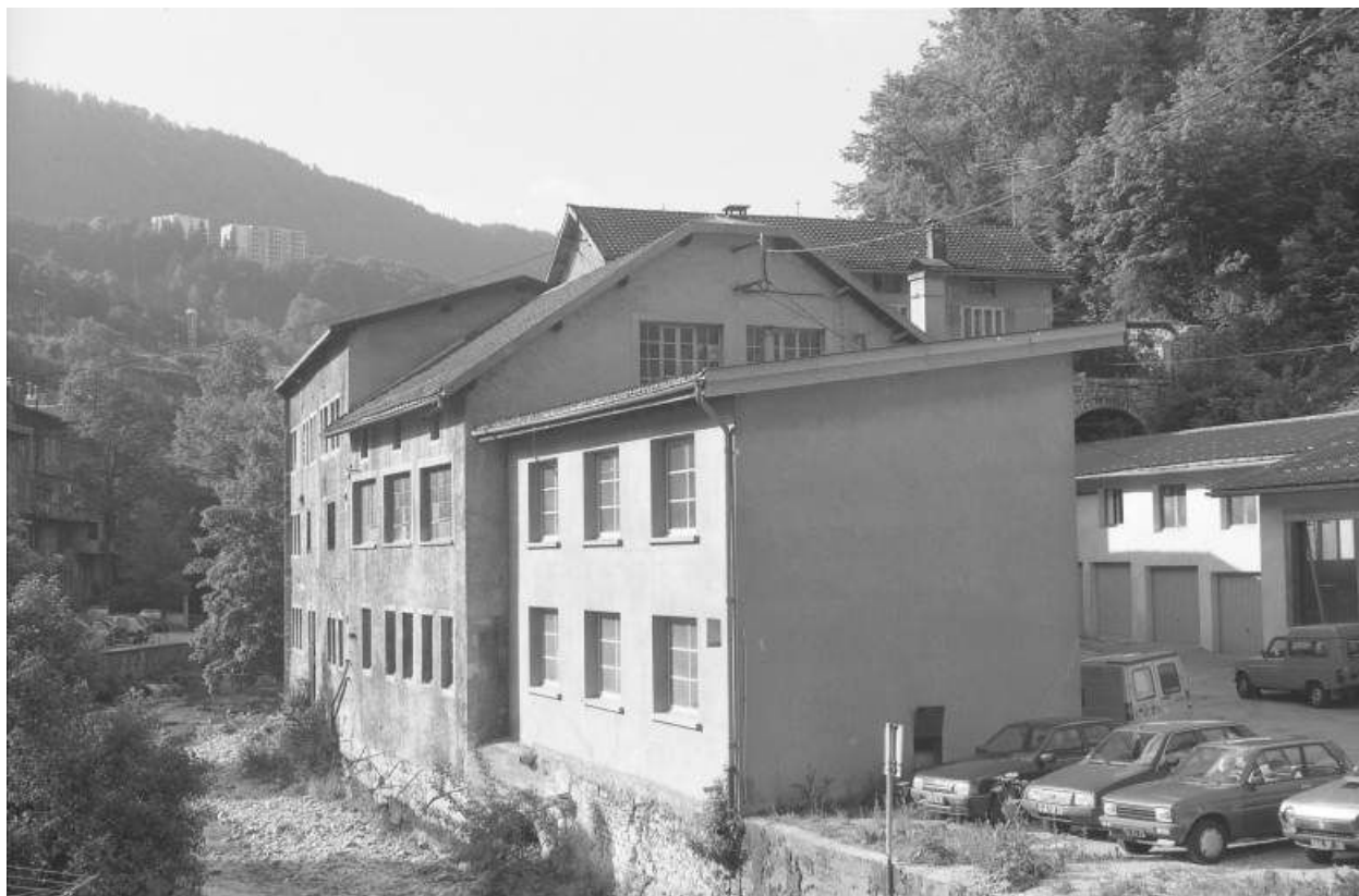
Façade sur la Bienne depuis le nord (aval).