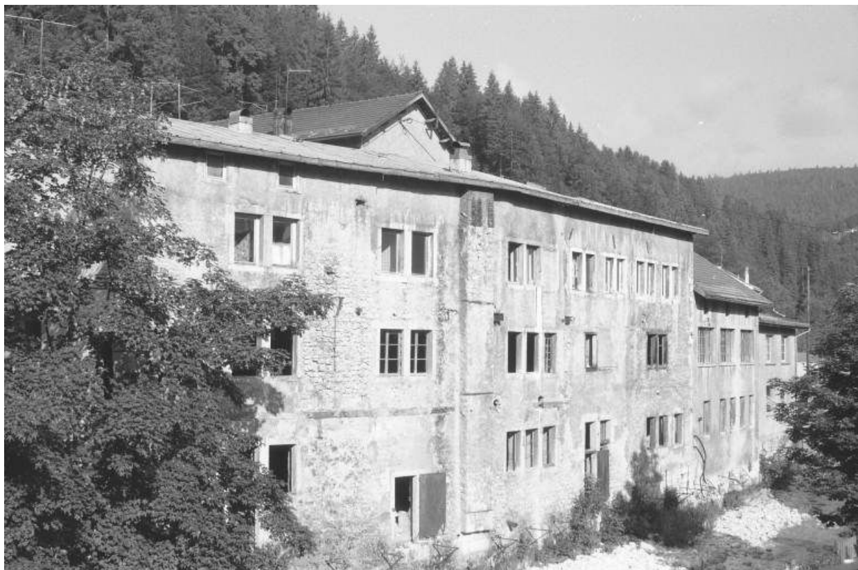
Façade sur la Bienne depuis l'est (amont).