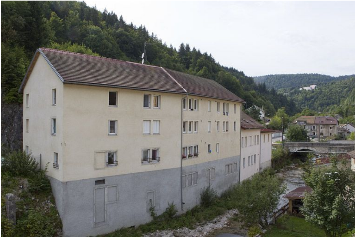
Anciens moulin à blé, usine de quincaillerie (clouterie) et scierie Emmanuel Girod (2 et 4 rue Pierre Morel).