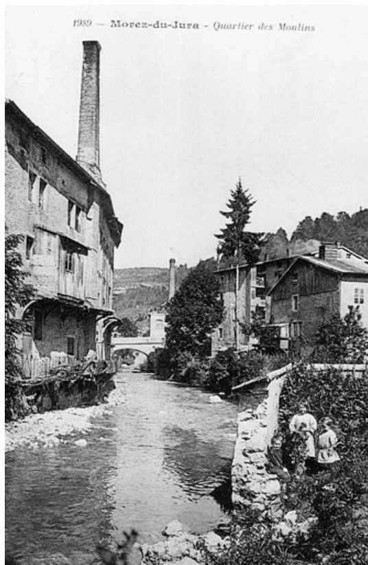
Morez-du-Jura - Quartier des Moulins.