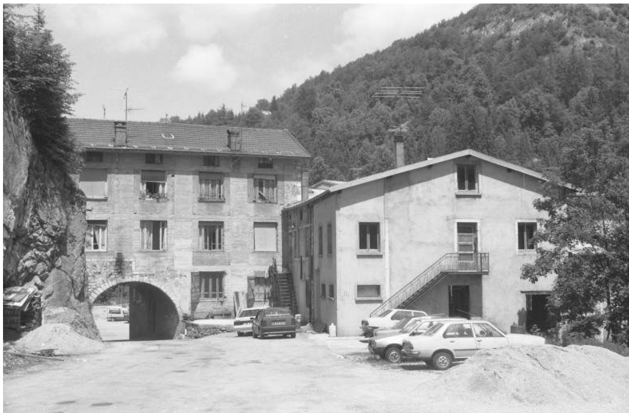
Vue d'ensemble depuis le sud-est (amont).