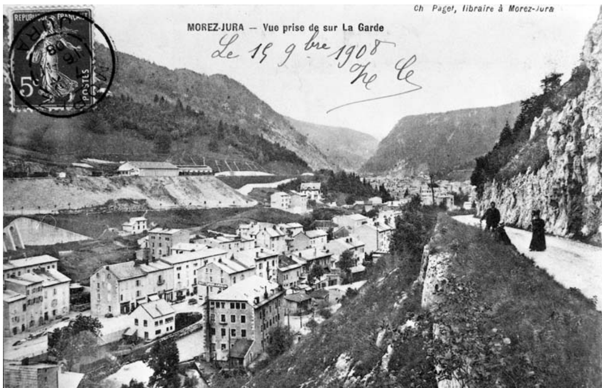
Morez-Jura - Vue prise de sur La Garde [route de La Mouille], avant 1908.