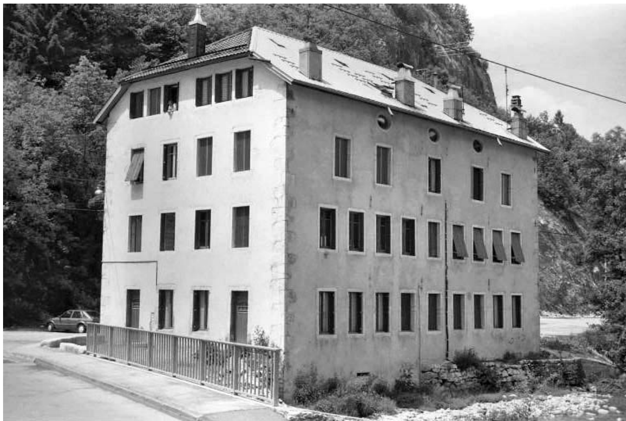
Façades antérieure et latérale droite.