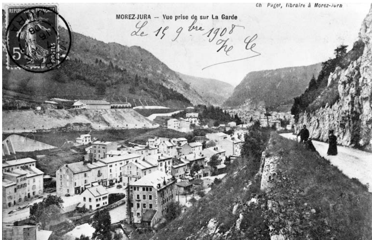
Morez-Jura - Vue prise de sur La Garde [route de La Mouille], avant 1908.