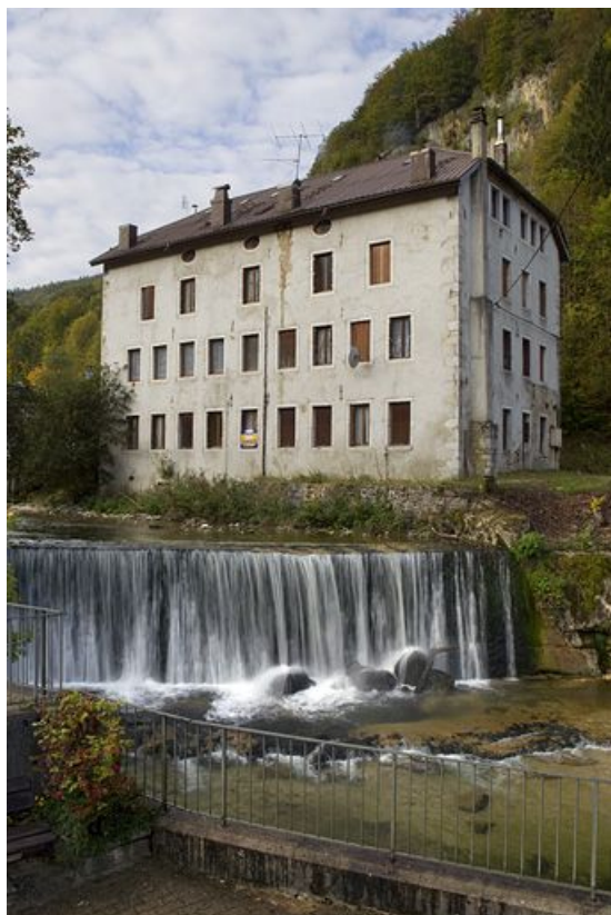
Ancienne usine d'horlogerie Emmanuel Girod puis de matériel d'équipement industriel Benier-Rollet (18 rue Pierre Morel).