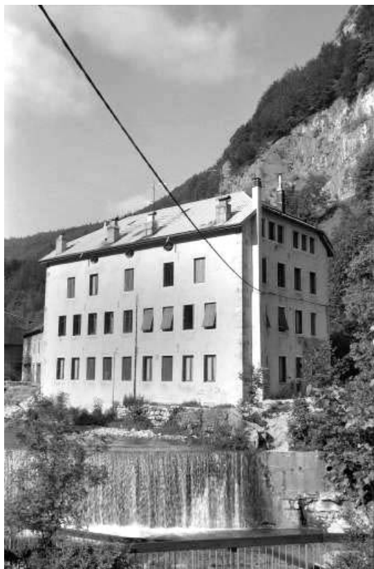
Vue d'ensemble depuis la rive droite de la Bienne, au nord.