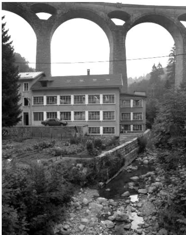
Façade antérieure de trois quarts droite.