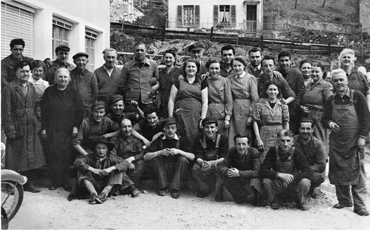
Le personnel de l'usine. 39, Morez, 4 et 6 rue Voltaire