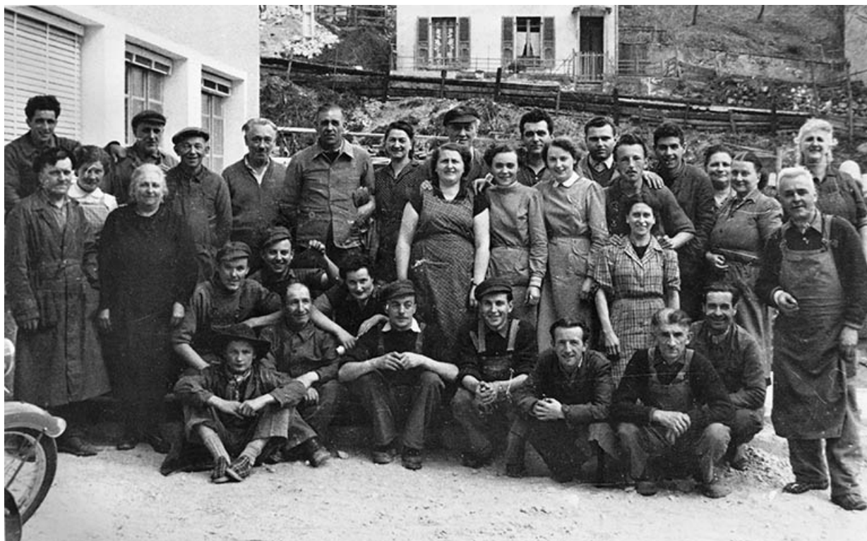
Le personnel de l'usine. 39, Morez, 4 et 6 rue Voltaire