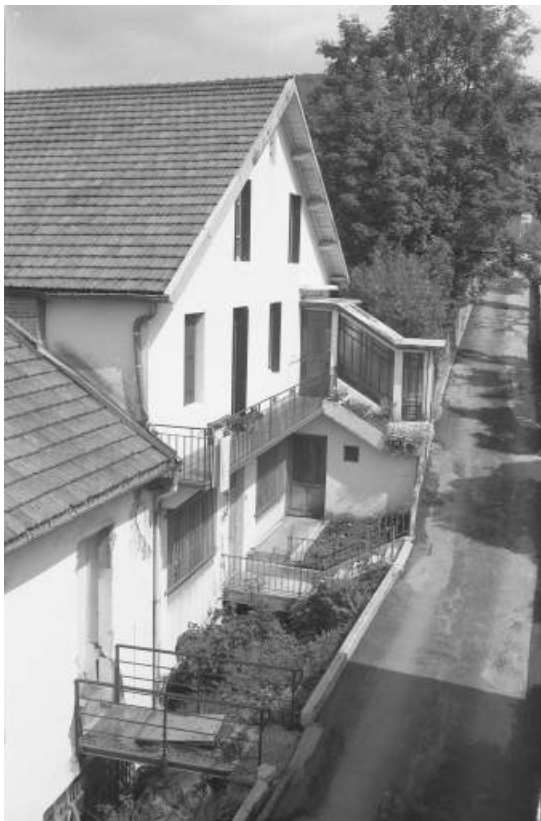
Façade antérieure, de trois quarts gauche.